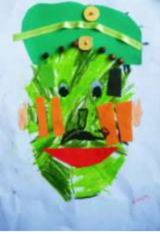
Şekil 5. Maske