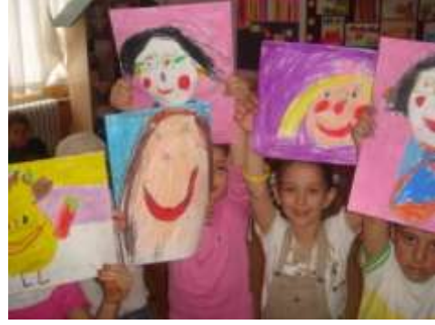
Şekil 4. Öğrenciler

c) 3. ders: “Manzara” konulu ders sırasında önce İbrahim Safi, Cevdet Batur, Namık İsmail, Erkan Geniş, Hikmet Onat, Nuri İyem ve Ayvazovski’nin manzara konulu eserleri gösterilmiştir. Sanatçıların resimlerinin incelenmesi ve üzerlerinde konuşulması bu derste daha çok ön plana çıkarılmıştır. Öğretmen, betimleme, çözümlleme, yorumlama ve yargı basamaklarından birer soruyla dersi başlatarak öğrencilerin yorum yapabilmelerine olanak sağlamıştır. Uygulamada resimlerde arka fon boyamada zorlanılmıştır. Öğrenciler, çizdikleri cisimleri boyamış arka taraflar boş kalmıştır. Mekân algısının henüz gelişmemesinden kaynaklanan bu durum birkaç öğrencide görülmemiştir.