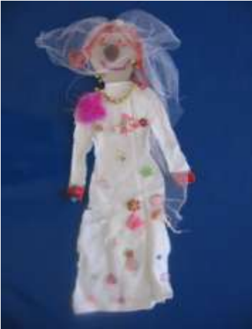
Şekil 8. Kına Gecesi Kıyafeti

Müzedeki bulunan geleneksel Türk kıyafetlerinin fotoğraflarını inceleyen öğrencilerin yaptıkları tasarımlarda modern kıyafetlerin görülmesi dikkat çekicidir. Bunun nedenini, çevrelerinde artık bu tarz kıyafetlerin olmamasına ve yaşanan çevreye bağlayabiliriz. Kızlar genellikle gelinlik, kına gecesi kıyafeti, gece elbiseleri; erkekler ise, korsan kıyafeti, asker üniforması, takım elbise gibi tasarımlar yapmışlardır.