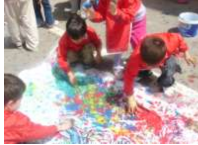
Şekil 2. Öğrenciler

b) 2.ders: “Portre” konulu ders anlatımında portre nedir? İnsanlar neden bu tarzda resimler (portre) yaparlardı? Sadece insanların portreleri mi yapılır? gibi sorular projeksiyonla yansıtılan çalışma kağıtları üzerinde öğrenciler tarafından cevaplandırılmıştır. Turgut Zaim, Nuri İyem, Hoca Ali Rıza, G. Arcimboldo, Osman Hamdi Bey’in yaptıkları portre resimler örnek olarak gösterilmiştir. Dersin sonunda değerlendirme olarak resimli çoktan seçmeli bir çalışma yapılmıştır. Uygulama olarak da, pastel boya ile G. Arcimboldo adlı sanatçının değişik meyve ve sebzelerle oluşturduğu portrelerden faydalanarak kendileri portreler oluşturmuşlardır. Öğrenme ve öğretme ile ilgili kazanımlarda yaş gruplarına bağlı olarak devinişsel, pratik yapma becerilerinde eksiklik olduğu görülmüştür. Anlama, yorum yapma, deneyim, beceri ve tutum kazandırmaya yönelik kazanımlarda ise sorun olmadığı gözlenmiştir.