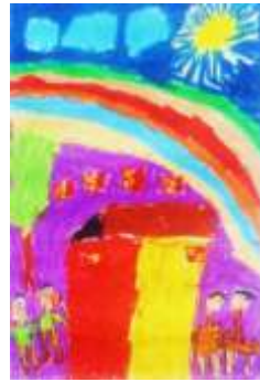
Şekil 16. B