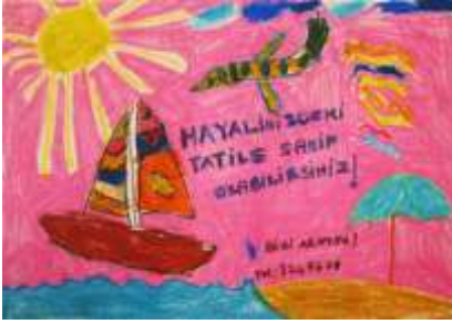
Şekil 12. Tatil Afişi

arasında afişlerin de olduğunu öğrenmişlerdir. Afişler ders boyunca sınıf panosunda asılı tutulmuştur. Öğrenciler uygulamaya başlamadan önce ne yapacaklarına karar vermişler, planlayarak resmi düzenlemişlerdir. Sloganlarını yazacakları yeri düşünerek ona göre düzenlemelerini yapmaları resim yaparken sistemli çalışma özelliğini kazanmış olmaları anlamına gelmektedir. Renklerin canlı seçilmesi, özellikle zıt renklerin dikkat çekmesi açısından yan yana kullanılması renk bilgisinin ve duruma göre bilgiyi uyarlama yeteneğinin kazanıldığının göstergesidir.