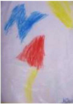
Şekil 15. A

Öğrenciler bu araştırmaya başlamadan önceki çalışmalarında zemin nesne ilişkisini algılayamıyor, farklı yüzeyleri farklı renklerle ifade edebilme, bütün yüzeyi tek renge boyama, boyarken sabırsız davranma gibi sorunlar yaşıyorlardı. Zamanla bu sorunların azaldığı görülmüştür. Konu kapsamında incelenen eserlerde figüratif çalışmalara ağırlık verilmesi öğrencilerin resimlerinde daha rahat figür çizmelerini sağlamıştır.