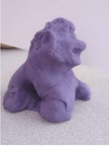
Şekil 10. Aslan Heykeli (6 yaş)

h) 8.ders: “Üç boyutlu çalışmalar” dersi için Arkeoloji Müzesi’nde yer alan aslan heykellerinden, büyük anahtarlar, silahlar, tanrı, tanrıça heykellerinden faydalanılmıştır. Ancak derste sanal müze oluşturulduğu için üç boyutlu çalışmaları iki boyutlu kağıtlar üzerinde resim halinde görmek uygulama için bir dezavantaj oluşturmuştur. Çünkü çocuklar üç boyut kavramını sözel ve görsel olarak izlemiş olduğundan algılama fırsatı bulamamışlardır. Bu durum çalışmalarına yansımıştır. Resimlerde örnekleri görülen eserleri algılayan çocuklar uygulama aşamasında üç boyut olgusunu rahatlıkla verememişlerdir.