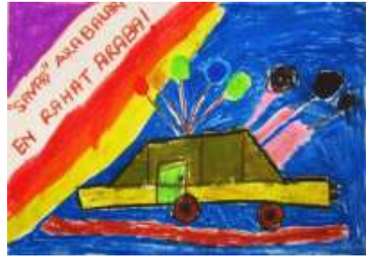
Şekil 13. Araba Afişi

Aynı zamanda örnek gösterilen afişlerdeki bazı noktaları eleştirip “ben olsaydım .... yapardım” gibi sözlerle fikirlerini söylemeleri de eleştirel bakış açısının kazanıldığını göstermektedir. Burada kızların dondurma ve kıyafet reklam afişleri, erkeklerin de araba, uçak, hava yolu şirketleri için reklam afişleri yaptıkları gözlemlenmiştir.