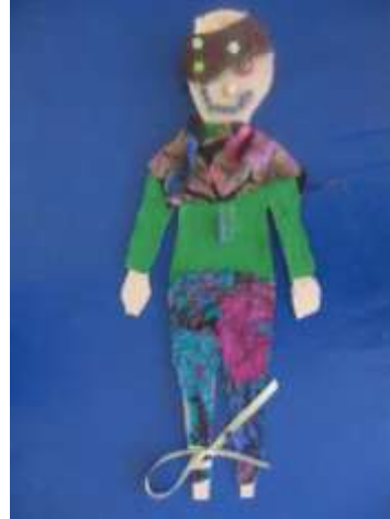
Şekil 9. Korsan