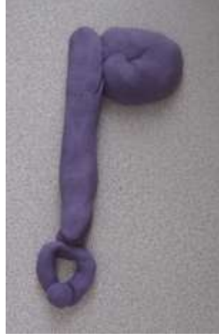
Şekil 11. Anahtar (5 yaş)

Uygulamalarda 5 yaşındaki öğrencilerin arasında üç boyutlu ürün çıkmamış, ancak 6 yaş grubundaki birkaç öğrencide üç boyut kavramına uygun örnekler görülmüştür.