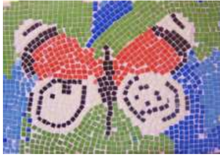
Şekil 7. Mozaik Çalışması - Kelebek

e) 5.ders: “Mozaik” konulu derste slaytlarla Hatay’daki ünlü mozaik eserlerden örnekler sunulurken bu mozaiklerle ilgili efsaneler sınıfta anlatılmıştır. Çocuklar bu hikâyeleri büyük bir dikkatle dinlemişlerdir. Bu yaşlarda masallara ilgi duyan çocukların bu tarihsel hikâyelerle derse başlamaları onlar için farklı olmuş, ilgilerini çekmiştir. Uygulamada üç gruba ayrılan çocuklar, ahşap levhaların üzerine büyük desenleri mozaik taşlarını yerleştirerek yapmışlardır. İşbirliği içerisinde öğrenme ve öğretim kazanımları başarılıdır.