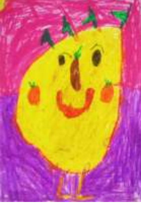
Şekil 3. Portre