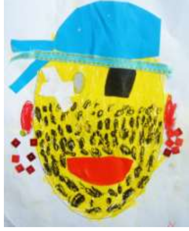
Şekil 6. Maske

e) 5.ders: “Mozaik” konulu derste slaytlarla Hatay’daki ünlü mozaik eserlerden örnekler sunulurken bu mozaiklerle ilgili efsaneler sınıfta anlatılmıştır. Çocuklar bu hikâyeleri büyük bir dikkatle dinlemişlerdir. Bu yaşlarda masallara ilgi duyan çocukların bu tarihsel hikâyelerle derse başlamaları onlar için farklı olmuş, ilgilerini çekmiştir. Uygulamada üç gruba ayrılan çocuklar, ahşap levhaların üzerine büyük desenleri mozaik taşlarını yerleştirerek yapmışlardır. İşbirliği içerisinde öğrenme ve öğretim kazanımları başarılıdır.