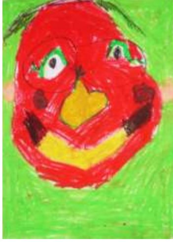
Şekil 14. Portre

Öğrenciler bu araştırmaya başlamadan önceki çalışmalarında zemin nesne ilişkisini algılayamıyor, farklı yüzeyleri farklı renklerle ifade edebilme, bütün yüzeyi tek renge boyama, boyarken sabırsız davranma gibi sorunlar yaşıyorlardı. Zamanla bu sorunların azaldığı görülmüştür. Konu kapsamında incelenen eserlerde figüratif çalışmalara ağırlık verilmesi öğrencilerin resimlerinde daha rahat figür çizmelerini sağlamıştır.