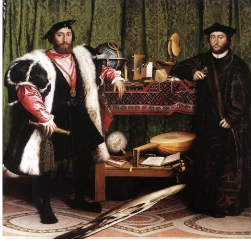
Resim 10: Holbein “Büyükelçiler” 1533

Holbein’in Büyükelçiler adlı tablosunda ayakta dururken resmedilmiş olan İngiltere’de yaşayan Fransa elçisi Jean De Dinteville ve aynı zamanda arkadaşı olan elçi ve piskopos Georges De Selve’nin giysilerinde, dönemin iki önemli erkek cüppesinin örneklerini görmekteyiz. Solda duran Jean De Dinteville’e kadifeden yapılmış, kenarları kürklü Schaube ’si ve saten kıyafetiyle zengin ve başarılı bir aristokrat görüntüsü verilmeye çalışılmıştır. Elçinin üzerinde ki giysilerde Holbein’in geldiği yer olan Kuzey Avrupa gelenekselliği belirgin bir şekilde görülmektedir. Piskoposun Schaube ’si ise yere kadar uzunlukta yine kenarları kürkle kaplı ancak daha modern bir görüntü sergilemektedir.