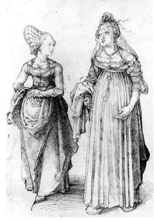
Resim 3: Albercht Dürer, "Nuremberg'li evhanımı ve Venedikli Kadın" 1495