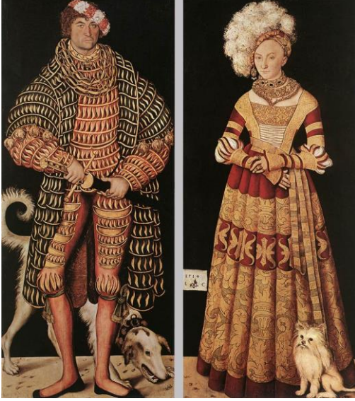
Resim 6: Lucas Cranach "Saxonya Düğü Henry ve karısı" 1514 Erkeğin kıyafetindeki yoğun detayların, kadının kıyafetine de taşınarak bir uyum sağlanmaya çalışılmış.

"Tüm zamanların en iyi portreleri 16.yüzyılda resmedilmişti. Holbein, Bronzino, Titian bunların arasında en iyileri olarak bilinirken bu ressamların çoğunun asilzadeleri asil kıyafetleri içinde resmettikleri bilinmektedir." (Laver, 1969:84)