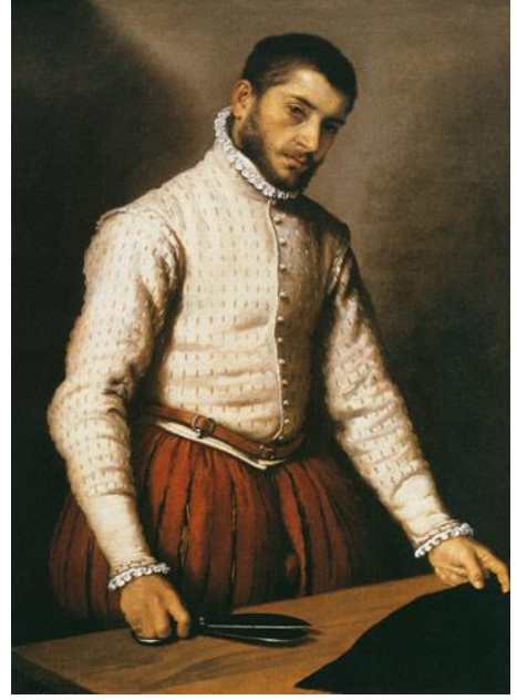
Resim 12: Giovanni Batista Moroni "Terzi" 1571 Orta sınıf kostümüne örnek

Öncelikli olarak İspanyol ressamlarının yapıtlarında karşımıza çıkan TrunkHose (balon pantolon) Avrupa modası içerisinde hızlıca yerini almış ve İngiltere Krallığından sonra İtalya'da da moda olmuştur. Bu pantolonların üzerine giyilen ceketler kısalarak Doublet / Pourpoint adlarıyla kostüm tarihinde bilinmektedir. Bu ceketler iç gömleklerin üzerine giyilmekteydi; ayrıca bu ceketlerin belden aşağısı açık olup, erkeklerin pantolon üzerine taktıkları, cinsel organını koruyan Codpiece adlı parçanın gösterilmesi sağlanıyordu. Doublet 'ler kolları çıkarılabilen ve bağlantı noktaları, yarım ay şeklinde bir apoletle kapatılan ceketlerdi. Kollar bilekte daralacak şekilde kabartılırdı. Göğüs kısmı kütük, pamuk, at kılı ile doldurularak yalancı bir şişkinlik elde edilirdi. Bu gösterişli kabartma yöntemleri ceketler ve pantolonlara yapılırdı. Ceketlerde, tüm şişkinlik giysinin üst kısmına yapılıp, bele doğru azaltılıp