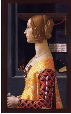
Resim 2: Domenico Ghirlandaio, "Giovanna Tornabuoni" 1488