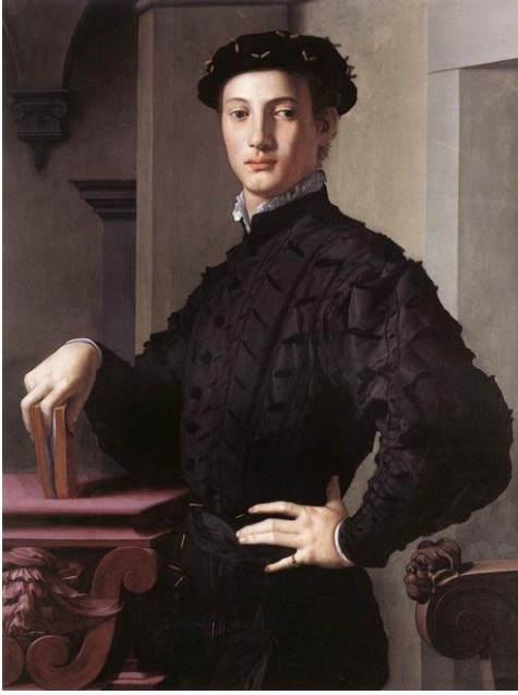
Resim 11: Bronzino "Bir genç adamın Portresi" 1540