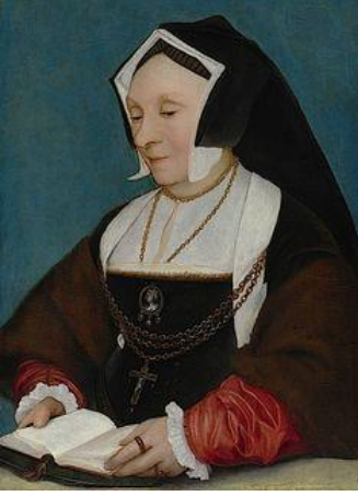
Resim 4: “Lady Alice More” 1530