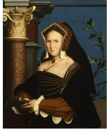
Resim 5: “Lady Guildenford” 1527

Hans Holbein tarafından yapılan iki portrede kadınlar Gable adlı köpek kulübesini andıran alınlıklı başlıklarla gösterilmektedir. (Resim 4, resim 5) Kennel ya da Gable adlarıyla kostüm kitaplarında yer alan bu başlıklar, dış kontürleriyle adeta bir Yunan tapınağının alınlığını hatırlatmaktaydı. Bu başlıklar, başın ön kısmı ve kulakların neredeyse tamamı kapanacak biçimde başa yerleştirilirdi. Başlıkta bulunan arka parça bir bone şeklinde olup, başın arka kısmını içine alacak şekilde kullanılırdı; ayrıca bu başlık daha resmi durumlarda saç görünmeyecek şekilde de kullanılırdı. Aynı modele sahip keten boneler ise saç daha fazla görünecek şekilde başa yerleştirilirdi. Bir Yunan tapınağının cephesini andıran bu başlıklar Rönesans klasik mimari özelliklerinden etkilenecek yapılmıştı.