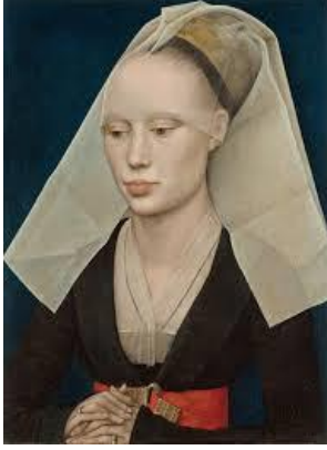
Resim 1: Rogier van der Weyden, "Bir Kadının Portresi" 1455