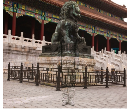
Resim: 14 Liu Bolin, Kentsel Kamuflaj