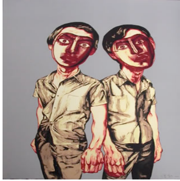
Resim:10 Zeng Fanzhi, Maske 5

Zeng Fanzhi'nin Maske çalışmasında mizah yöntemlerinden, üstünlük teorisinin sorgulama biçimi görülmektedir. Sosyal grubun sosyal tutumların ve sosyal modellerini içerir. Bu yöntemle eser analiz edildiğinde, ekonomik, sosyal, politik devrimlerin toplumdaki travmalarını gizleyen maskeliler, sessizlikleri -asında çok seslilikleri- ile ironik bir gerilim yaratmaktadırlar. Kamusal alanda çoğaltılmış görüntüleri, deneyimlediğimiz ile umduğumuz şey arasındaki karakterleri, aşırı abartılmış yüz bölümleri ile izleyeni baskı altında hissettirmektedirler. Bu iyi giyimli gizlenmiş kentliler, yeni toplum düzeninin yarattığı yalnızlık duygusu altında izole olmuşlardır (Resim:9 – Resim:10).