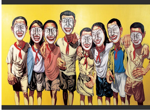
Resim:8 Zeng Fanzhi, Maske Serisi

Hem pozitif hem de negatif etkili çift bağımlı yaklaşımı ile Zeng Fanzhi 1990'lı yıllarda başladığı kapsamlı Maskeler Serisi ile hızla değişen Çin toplumunun karşı karşıya kaldığı psikolojik ve sosyal çekilmeye dikkat çekmektedir (Fanzhi, 2012). Dramatik figürleri ile toplum içi yabancılaşmanın ironik yansımalarıdır. Mao'nun ikonik portresini ve imajını kullanarak yaptığı çalışmalar ile Zeng Fanzhi, kendi kültürünün; kültürel, siyasal ve sosyal tarihiyle yüzleşmektedir. Sanatçının çalışmalarında, ironik ifadesi söylem analizine ilişkin kendi görüşlerini oluşturur.