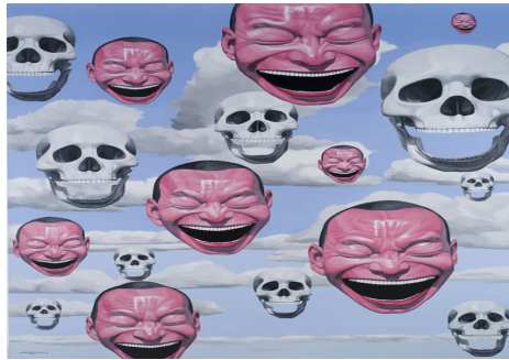
Resim:6 Yue Minjun, Havada Yüzen

Alman romantiklerin de eleştirel teorilerinde, gerçek ve ideal arasındaki karşıtlık olarak ironi, sınırsız karşı sınırlı kapsam olarak, mizah terimine yönelirler (Ziolkowski, 1991:100 ). Buna benzer süreçle Yue Minjun toplumsal olayları sorgularken, mizah ve komik ifade birbirine paralel çözümlenirken acı yada üzüntü verici olaylar ikincil anlamla irdelenmeye başlanmıştır. Sanatçının kompozisyonlarındaki, ikincil anlatım figürleri ve yüz ifadelerindeki 'neşe' gerçek ve ideal arasındaki karşıtlığı yansıtmıştır. Toplumdaki 'Eleştirel İzleyici'leri sanatçı, sosyal algılayıcı olarak kahkaha ile eleştirmektedir. Jensen'in ifade ettiği gibi, mizah ve gülme sosyolojik bağlamda sosyal bağımlılığa işaret edebilir. Bu gülmede ki sosyal bağımlılığı sanatçının havada yüzen çalışmasında (resim:6) şiddet ve anksiyeteyi'nin abartılı görünümünde dikkat çekmektedir.