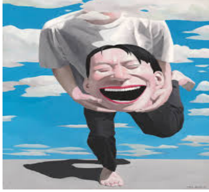
Resim:5 Yue Minjun, Gülen adam

Alman romantiklerin de eleştirel teorilerinde, gerçek ve ideal arasındaki karşıtlık olarak ironi, sınırsız karşı sınırlı kapsam olarak, mizah terimine yönelirler (Ziolkowski, 1991:100 ). Buna benzer süreçle Yue Minjun toplumsal olayları sorgularken, mizah ve komik ifade birbirine paralel çözümlenirken acı yada üzüntü verici olaylar ikincil anlamla irdelenmeye başlanmıştır. Sanatçının kompozisyonlarındaki, ikincil anlatım figürleri ve yüz ifadelerindeki 'neşe' gerçek ve ideal arasındaki karşıtlığı yansıtmıştır. Toplumdaki 'Eleştirel İzleyici'leri sanatçı, sosyal algılayıcı olarak kahkaha ile eleştirmektedir. Jensen'in ifade ettiği gibi, mizah ve gülme sosyolojik bağlamda sosyal bağımlılığa işaret edebilir. Bu gülmede ki sosyal bağımlılığı sanatçının havada yüzen çalışmasında (resim:6) şiddet ve anksiyeteyi'nin abartılı görünümünde dikkat çekmektedir.