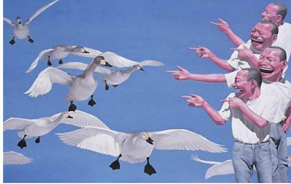
Resim:3 Büyük Kuğu, Yue Minjun

Lim Young Sun'un, Solgun Mavi Ay çalışmasındaki (Ahşap, bronz, çan ve L.E.D. lamba, toplam 170 baş) dil ve söylem ilişkisi, mizahsal anlatımda ruhsal (psşik) salınım teorisine örnek olacak yapıdadır. Resimde kendi içindeki mücadelenin ortaya çıkış ifadesi bireysel ve toplumsal negatif duygular ile sorgulanmaktadır (Resim:1-2).