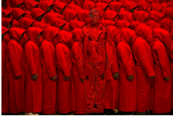
Resim: 13 Liu Bolin, Şehrin içinde gizli, Kırmızı no.2

Sanatçının gölgesel anlatımı, kendinden ve toplumdan silinerek uzaklaşma, yabancılaşma durumu, toplum içindeki varoluşunu sorgulamaktadır. Bu sorgulama yöntemi ironik bir yabancılaşma ile şehrin içindeki gizli anlatımı ifade eder. Sanatçı çalışmalarında bireysel sorgulamayı durumsal ironi yöntemi ile sessiz protesto niteliği taşıyan performanslarında işlemektedir. Performanslarında, kentleşme, ekonomik kalkınma politikaları sonucunda kendi kültüründe yaşanan toplumsal yabancılaşmayı da, eleştirel yöntemle irdelemektedir (Batet, 2008). Liu Bolin, aynı zamanda performanslarında, kentsel dönüşüm kapsamında sansüre kadar pek çok konuda ironik dili kullanmaktadır.