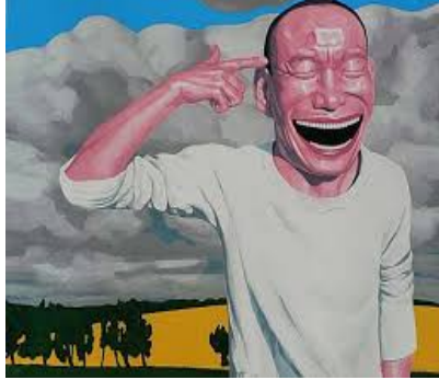
Resim:4 Yue Minjun, Alan (Yaşamdan kaçış)

tanımlayan çalışmalarından biri Yue Minjun'un (Resim:4) "Alan (Yaşamdan kaçış)" adlı anlatımıdır. Toplumda birey olgusu ve anlamın zıtlığını irdelemektedir.