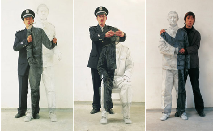
Resim: 17 Liu Bolin, Görünmez Adam

Süpermarket raflarında, reklam afişleri içerisinde, büfelerde ve şehrin pek çok farklı noktasında gizlenerek oluşturduğu gölgesel anlatımı, hem bireyi ‘silikleştirmesini/silmesini’ hemde bireysel yaşam alanlarının daralmasının eleştirisi (Bolin, 2008). Bu paradoksal strateji ile kendi ‘yokluğunu’ sahneleyen Liu Bolin, mecazi anlatımla, kendi bedeninde, gerçek dünyanın egemenliğini göstererek varlığın izole halini oluşturmuştur.