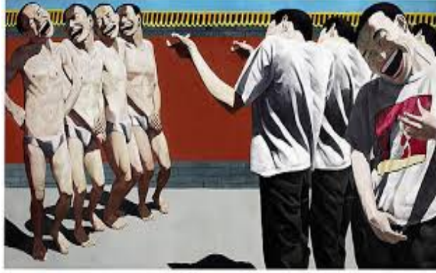
Resim:7 Yue Minjun, İdam