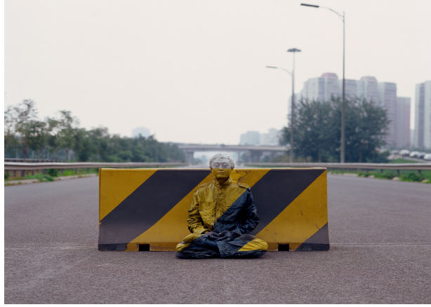
Resim: 12 Liu Bolin, Şehrin İçinde Gizlenme, no:51, Blok Yol

ruhsal (psişik) salınım anlatımı ile açıklanabilir. Sanatçı ruhsal (psişik) salınım teorisinde görünen ve görünmeyenin ikili anlamlılığını işlemiştir.