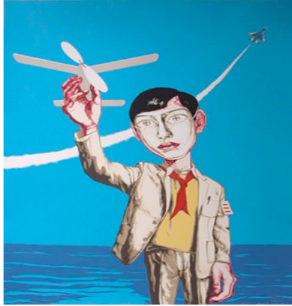
Resim:11 Zeng Fanzhi, Maske 6

tutumların sosyal ifadesi kendi sanatsal söyleminin temel taşı oluşturmaktadır (Resim:11).