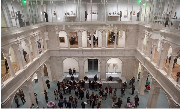
Resim 1: Harvard Üniversitesi Sanat Müzesi “Akıllı Bina”