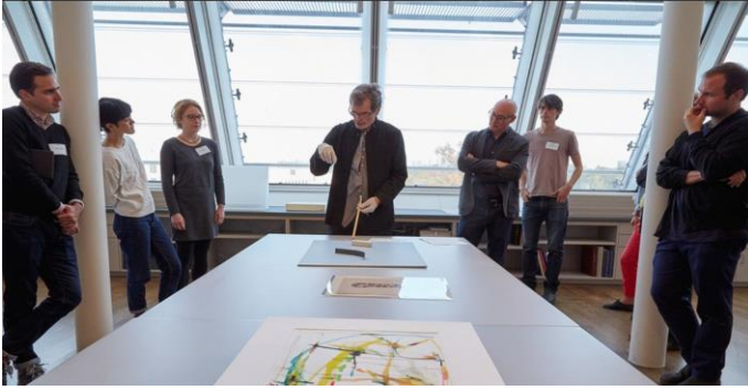
Resim 4: Sanat Çalışma Merkezi

sergiyle eşzamanlı olarak öğrencilere yönelik çalıştaylar da düzenlenmiş, sanatçı konuşmaları gerçekleştirilmiştir.