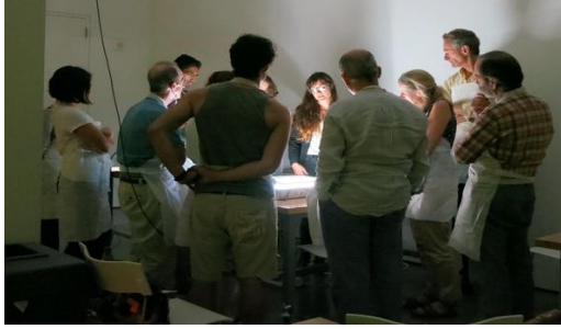
Resim 7: Konservasyon çalıştay

Koruma ve Teknik Çalışmalar İçin Straus Merkezi: Koruma ve Teknik Araştırmalar Merkezi olan Straus, güzel sanatları koruma, araştırma ve bu konuda eğitim verme alanında dünyada ilk sırada olma özelliğine sahiptir. Merkez laboratuvarları, eserleri koruma, konservasyon bilimi ve küratörlük deneyimleri sayesinde müzede bulunan 250.000 eserin en iyi şekilde bakımını sağlamaktadır. "Straus Center for Conservation and Technical Studies" eserler için bir araya gelerek geliştirmenin ve zenginleştirmenin sağlandığı bir araştırma merkezidir.