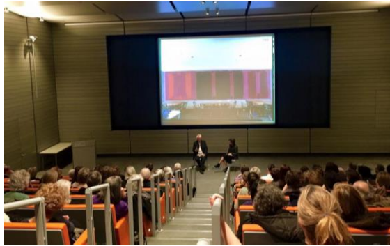
Resim 6: Harvard Sanat Müzesi'nde sanatçı ile söyleşi

Halk Programları: Kalabalık bir üniversite kampüsünde yer alan Harvard Sanat Müzesi, komşuları ve ziyaretçileri tarafından daha aktif kullanılabilmesi için yıl içerisinde yapılan halka açık programlar bu birimin katkılarıyla düzenlenmektedir. Ziyaretçiler galerileri bağımsız bir biçimde, dijital bir turla ya da öğrencilerin kılavuzluğunda ziyaret edebilmektedir. Halk programları kapsamında katılımcılara dersler, performanslar, konserler, çalışma kurultayları ve filmler sunulmaktadır.