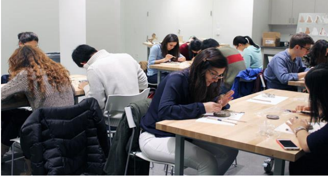
Resim 5: Halk Programları Çalıştayı

aracı olarak kullanmaktadır. Müzenin tüm mekânları, öğretim ve sanat eğitimi yoluyla öğrenmeyi kolaylaştırmak için tasarlanmıştır. Farklı kitlelere uygun hazırlanmış programlarla müze, nesne tabanlı eğitimin gücünü keşfetmeyi hedeflemiştir.