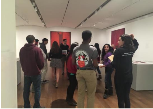
Resim 3: "Mark Rothko Duvar Resimleri" sergisinde doktora öğrencisi eşliğinde yapılan eser analizi dersi

"Mark Rothko Duvar Resimleri" sergisinde Mark Rothko'nun restore edilen duvar resimleri tekrar düzenlenerek, dijital sunumlar teknolojik imkanlar eşliğinde izleyiciyle buluşturulmuştur. Yıl boyunca açık kalan sergi, hocalar ve doktora öğrencileri eşliğinde yürütülen sanat tarihi derslerine konu olmuş ve sergi alanında öğrencilerle birlikte eser analizi yapılmıştır.