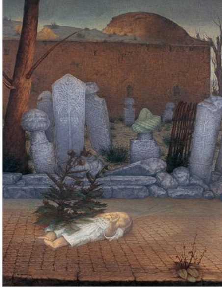
Resim 7 : Aydın Ayan, Bir Memleketin Simgesel Portresi

Aynı şekilde sembol anlatımlarında mezar taşını ölümün en bariz şekilde kullanan sanatçılardan biriside Aydın Ayan'dır. Bir memleketin simgesel potresi adlı eserinde (Resim: 7) mezar taşları sembol olarak ön plana çıkmaktadır. Ayan'ın resimlerinde mezartaşlarının ısrarla öne çıkması görünen anlamının yanında başka anlamlarına gönderme yapabileceği düşünülmektedir (Giray,1999: 19). Nitekim resimde kompozisyon olarak merkeze alınmış bebeğin ölümle olan ilgisi ölümün belirsizliğine olan bir gönderme, hemen yanında taşlar içerisinde yeşeren bitkinin de hemen arkasında ki mezartaşındaki hayat ağacına ve yeniden doğuşa yapılan bir atıf olduğu düşünülmektedir. Ayrıca mezartaşlarının eski kültüre ait olması da kadim ölümün çözümü gerektiren estetik bir halidir.