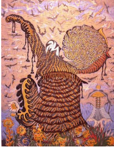
Resim 4: Hasan Kıran, Gösteri

gerçeği ortaya çıkarmak değil, o gerçeğin kılık değiştirilerek, farklı şekilde imgeler aracılığıyla ortaya konulmasıdır ( Kıran, 2010).