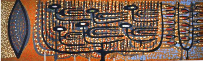
Resim 3: Bedri Rahmi Eyüboğlu, Hayat Ağacı

Göğe ulaşmada bir başka araçta evrenin direği olarak kabul edilen "Hayat Ağacı" dır. Hayat ağacı, "Eski Türk geleneğine göre, bu dünyanın ortasından geçtiği düşünülen, dünyayı öte âleme ve Demirkazık'a bağlayan ağaç olarak kabul edilmektedir. Gök katlarının ve göğün temsilinde sıkça görülen hayat ağacı eski Türklerin şaman ritüellerinde, şamanın ölen kişiye eşlik etmesi, ölümler diyarına geçişi ve haberler getirmesi imgeleminde sembol olmuştur. Halen Anadolu'da yaşayan gelenekler arasında ağaca verilen bu kutsiyet servi ağaçlarında ulu çınarlarda ve ağaca çaput bağlama ritüellerinde kendini göstermektedir. Hayat ağacının bu sembolleri bazen direkt biçimsel özellikleri bazen de imge ile çağdaş Türk sanatı eserlerinde belirir. Bedri Rahmi Eyüboğlu'nun "Hayat Ağacı" eseri bu bağlamda biçimsel özellikleri ile kendini belli eder. (Resim: 3) Resimde semboller doğrudan yan anlamlara gönderme yapar.