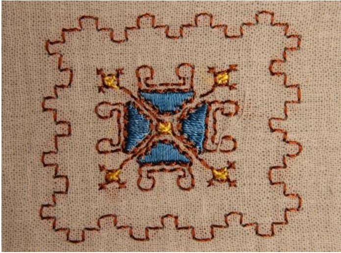
Resim. 7.;Şile İşlemlerindeki "Gazi Sofrası" Motifi, (Foto. Suzan Karaman, 2010)

Şile’de kullanılan işleme tekniği hesap işidir. Şile bezi işlemlerinde Düz iğne, Verev iğne, Hasır iğne, gibi farklı hesap işi işlem basamakları, ayrı ayrı veya bir arada kullanılarak motifleri oluşturmaktadır (TEMİR, 2010:270). Şileli kadınlar nazar, bereket, güzellik, aşk, ölümsüzlük gibi kavramları dokuma ve işlemlerle ifade ederek, duygularını anlatmaktadırlar. Süslemeler, kasnağa gerilen bez üzerine motiflerle işlenir. Genellikle kanaviçe ve sarma tekniklerinin kullanıldığı, işlemlerde ise gözenek ve ipliklerin sayılarak yapıldığı görülür. Günümüzde, iplik olarak pamuk, floş ve çamaşır ipeğinin kullanıldığı bilinmektedir. “İşlemler yöreye has özellik taşıyan motiflerle süslenir. Bu motifler halk arasında; “Çatlak kahve”, “Samatya”, “Galata köprüsü”, “Kartopu” , “Gazi sofrası” (Resim.7.), “Kabak çiçeği”, “Ciğer Deldi”, “Yasemin” (Resim.8.), “Hanım yanağı” gibi değişik isimlerle anılır. İşleme yapılan kumaşların çevresine, işlemede kullanılan bir ya da iki renkte iplikle, tığ veya iğne oyası teknikleri kullanılmaktadır” (TEMİR,2010:272).