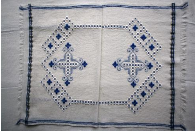
Resim. 3.:Şile İşlemeli Örtü , 40x 125 cm., Meserret Kibar Koleksiyonu ,