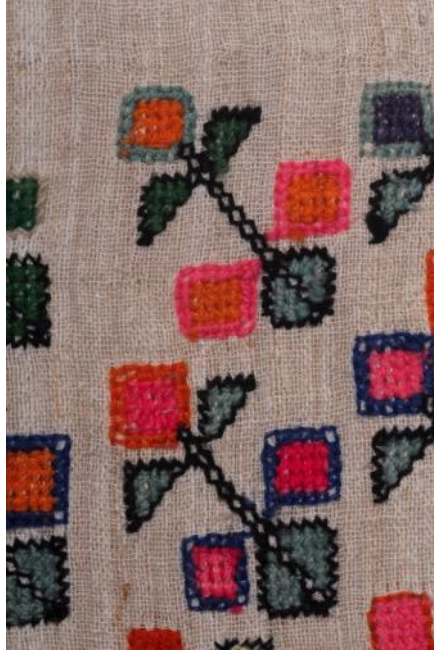
Resim. 13.: Cem Tabakoğlu Koleksiyonuna Ait Uçkur, İşleme Detayı,