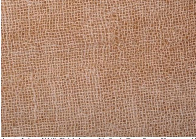
Resim. 1.: Orhan Çiftlik Koleksiyonu, Şile Bezi, (Foto. Suzan Karaman, 2010)