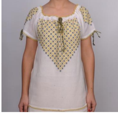
Resim. 14.: Yaşar Tan Koleksiyonuna Ait Bayan Bömleği , (Foto. Suzan Karaman, 2010)