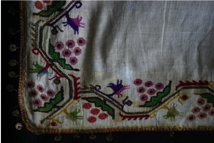
Resim. 6.:Çevre, 60x60 cm., Cem Tabakođlu Koleksiyonu,