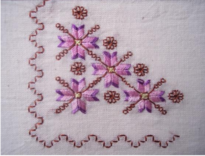
Resim. 8. ; Şile İşlemelerindeki "Yasemin" Motifi