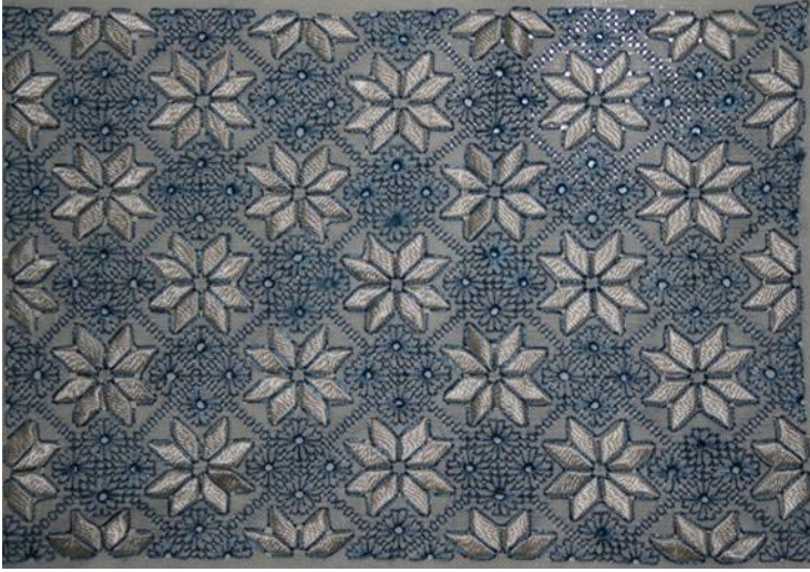
Resim. 16.: Tam tekrar ilkesi ile düzenlenmiş desenler, Cem Tabakoğlu Koleksiyonu ,

uyandırmaktadır. Böylelikle tam tekrar ilkesiyle düzenlenmiş bu motiflerin, yapmış olduğu tek düzelik ortadan kalkarak, kuvvetli bir görünüm de elde edilmektedir (Resim.16.).