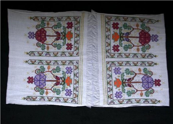
Resim. 4.: Yaşar Tan Koleksiyonundan Peşkir, 46 x 118cm.,