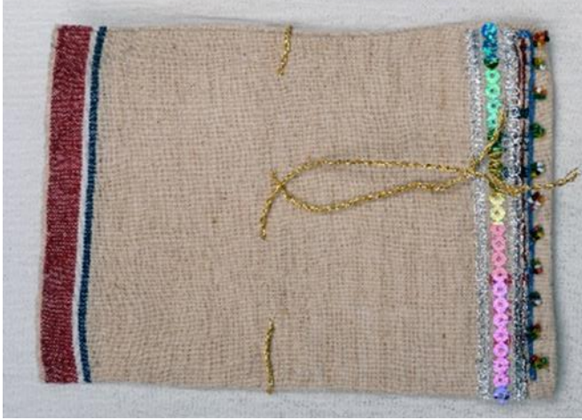
Resim. 2.: Şile Bezinden Yapılmış Kese, Zuhâl Olguncu Koleksiyonu, (Foto. Suzan Karaman, 2010)