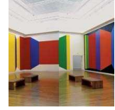
Tablo 5 Sol LeWitt, Wall Drawing #1081: Planes of Color. Kunstsammlungen, Chemnitz, Germany, March 2003. All images © Sol LeWitt. Unless otherwise noted, all photos courtesy of the artist.