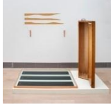
Tablo 1, Marcel Duchamp (1887-1968) Título: 3 stoppages étalon (3 zarcidos patrón) Técnica: Caja con piezas de madera. Edición de 8 réplicas. Medidas: 129,2 x 25 cm. . Año: 1913-1964 Video "Duchamp en Buenos Aires": http://www.youtube.com/duchampnbsas

Sanatçı bu görüntülerden İllüstrasyondan kurtulmak için faydalanacaktır... “Bir uçtan diğerine, ilinek, ikinci anlamıyla rastlantı, edim, seçim haline gelmiş olacaktır, belli bir tipteki bir edim ya da seçim olacaktır” (Deleuze, 2009: 88).