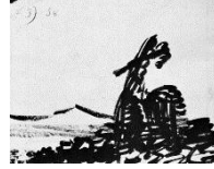
Tablo 5 Sol LeWitt, Wall Drawing #1081: Planes of Color. Kunstsammlungen, Chemnitz, Germany, March 2003.