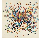
Tablo 2 Ellsworth Kelly Spectrum Colors Arranged by Chance II, 1951 – Collage on paper

https://plus.maths.org/content/teacher-package-maths-and-art