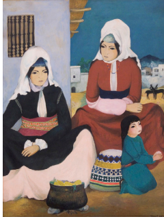
Resim 4:TurgutZaim,“Yemişiçi”,T.ü.y.b.,Kaynak: http://www.artnet.com/artists/

den ilham alarak eserlerini üreten mahalli bir ressamdır. Eserlerinde ışık - gölge ve ton değerlerine pek önem vermeyen ve şekilleri stilize ederek sathları minyatürde olduğu gibi muayyen lokal bir rengin açıklık ve koyuluklarıyla renklendiren değerli bir ressamdır. Yörük ve Avşar kadınlarını, orta oyunlarını tasvir eden resimleri vardır. Eski adet ve kıyafetleri kendine özgü bir üslupla anlatır. Turgut Zaim'i ilgilendiren konular genellikle Türk folkloruna aittir. Bu sebeple milli bir ressam olarak anılır (Şerbetçi, 2008: 68) .