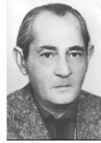
Resim 1: Turgut Zaim' in fotoğrafı