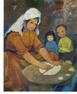
Resim 7: Turgut Zaim, “Hamur Açan Kadın”, T.ü.y, 71 x 90cm., A.D.R.H. Müzesi

Turgut Zaim’in minyatürden aldığı düzlemleme özellikleri ile dışardaki gündelik hayatın ironik ve kimi zaman dramatik yanlarını çocuksu bir dille anlatması ona özgün bir alan yaratır (Gümüşay, 2008: 142). Sanatçı resimlerinde genellikle kadının üretkenliğini simgeleyen analığın yanı sıra yöreye özgü geleneksel üretimler, hayvan bakımı ve bağ bahçe işleri ile kadının köy yaşamındaki yerini belgelemiştir (Batur, 2016: 195). “Hamur Açan Kadın” çalışmasında, yer sofrasının başında yöresel kıyafetleriyle oturmuş, maharetli elleriyle hamur açan kadın ve çocuk figürlerini görürüz. Turgut Zaim’ in kadın figürleri genellikle “Ana”dır,