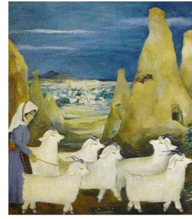
Resim 3: Turgut Zaim, "Ürgüplü Yörükler", T.ü.y.b.

Turgut Zaim, folklorik konulara yönelerek, göçerler ve köylülerin mutlu yaşam kesitlerini öznel bir yorumla tuvalere aktarmıştır. Ayrıntılardan arındırılmış biçimsel aktarımları ile belirlenen mutlu yüzlü, yuvarlatılmış hacimli ve anıtsal köylü kızları, toraman köylü çocukları, bebeleri, beşikler, koyunlar ve bunlara sahip olmanın mutluluğunu yansıtan köy erkekleri Turgut Zaim' in resimlerinde, hemen ön planda yalın bir anlatım ve geniş yüzeylere dağılan renksel bir tarzla aktarılırlar. Arka planda, ak lekeler oluşturan minik evler, yumuşak toprak dokusunun izlerini yansıtan tepeler yer alır. Ortaoyunları, Göreme önünde keçi sürüleri, Avşarlar, Yörükler , Turgut Zaim' in yorumundan geçerek tuvalerde yeniden yaşamsallık kazanırlar (Giray, 2000: 414).