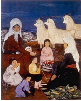
Resim 10 : Turgut Zaim, "Yaylada Yörükler", T.ü.y., 175x135 cm

"Yaylada Yörükler" isimli çalışmasında, yaylada çocuklarıyla beraber oturmuş kadınlar vardır. Resmin alt sağ köşesinde yeni toplanmış mısırlar, solda mısır yiyen küçük kız, annesinin kucağında küçük bir bebek, elinde keçi güttüğü sopayla oturan oğlan betimlenmiştir.