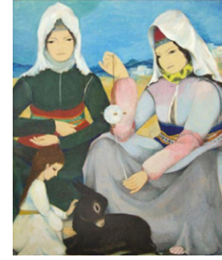
Resim 11: Turgut Zaim, "Yün Eğirten Kadın" , Kaynak: http://www.sanatteorisi.com

Turgut Zaim, Yörük ve Avcularını hayvan figürlerini kullanarak zenginleştirdiği resimlerinde, güler yüzlü, mutlu, masalsi betimlemeler yapmıştır. Türk minyatür sanatından izlenimlerle kendine ait bir üslup yakalayan ve hayatının sonuna kadar edindiği üsluptan başka bir yola sapmadan, olumsuz eleştirilere kulak asmadan Anadolu insanını en iyi şekilde tuvaline aktaran, bu anlatımlar içinde ele aldığı anlayışında, geniş bir hayvan figürü yelpazesinde sevgi dolu, sakin, durağan, mistik bir anlatış şekliyle yüzyıllar boyu unutulmayacak, kendinden sonraki birçok toplumsal gerçekçi sanatçıya öncü olacak şiirsel çalışmalar yapmıştır.