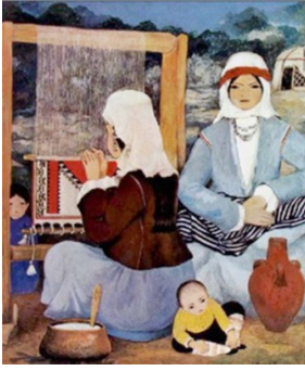
Resim 9: Turgut Zaim, "Halı Dokuyanlar I", T.ü.y. , 40 x 34 cm, 1906

"Yaylada Yörükler" isimli çalışmasında, yaylada çocuklarıyla beraber oturmuş kadınlar vardır. Resmin alt sağ köşesinde yeni toplanmış mısırlar, solda mısır yiyen küçük kız, annesinin kucağında küçük bir bebek, elinde keçi güttüğü sopayla oturan oğlan betimlenmiştir.