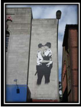
Resim 2. Banksy, "Kissing Coppers", Sprey boya, 2004, Brighton. ( https://www.theartstory.org/artist-banksy-artworks.htm ).

Resim 2’de ise İngiliz üniformalı iki (görünüşte erkek) polis memuru, sevgi dolu kucaklama gibi görünen bir şekilde öpüşmektedir. Eser birçok yönden okunabilir. Örneğin eserin bir yönü ile Banksy, eşcinsel simgeleri yerleştirerek cinsel kimliğe gönderme yapmaktadır. Sıradan vatandaşlardan ziyade, polislerin kullanımı ise ilgi çekicidir. Diğer bir yönü ise polis memurlarının, savunmasız ve samimi bir zamanda gösterdikleri insani bir tarafı vurgular. (Resim 2)