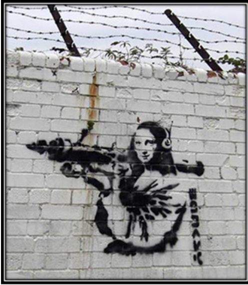
Resim 6. Banksy, "Mona Lisa Bazooka", Sprey boya, 2007-2008, Londra. ( https://www.theartstory.org/artist-banksy-artworks.htm ).

Banksy, diğer bir çalışmasında ise dünyanın en ünlü tablolarından biri olan Mona Lisa (1503-4) eserini kullanmaktadır. Mona Lisa'yı siyah-beyaz stencil tarzında bir roket fırlatıcı hedeflerken yorumlayan sanatçı aynı zamanda Lisa'ya bir kulaklık da takmıştır. İlk olarak Batı Londra'nın Soho bölgesinde ortaya çıkan bu eserde, Banksy'nin sanat tarihinin en ünlü kadınına güçlü bir modern silahla yan yana koyması kesinlikle düşündürücüdür. Vermek istediği mesajlar aslında Banksy'nin eserlerinde açıkça okunabilmektedir. Da Vinci'nin Mona Lisa'sı zarif ve estetikdir. Ancak Banksy ona güçlü, çatışmacı bir kişilik katar. Mona Lisa'nın meşhur yüz ifadesindeki o gülümsemesi, bu eserde tehditkâr olarak okunmaktadır. (Resim 6)