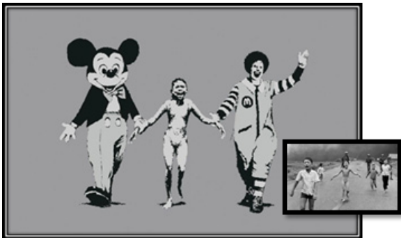
Resim 3. Banksy, "Napalm Girl", Kağıt üzerine baskı, 2004-05. ( https://www.theartstory.org/artist-banksy-artworks.htm ).

Resim 3’te ise Banksy önceden var olan imgeyi kullanmaktadır. Bu imge, 1972’de Vietnamlı bir kız çocuğu fotoğrafıdır. Orijinal fotoğraf Nick Ut tarafından çekilmiş olup Vietnam Savaşı’nın vahşetini yansıtmaktadır. Banksy, korkudan kaçan kızın görüntüsünü kullanarak Mickey Mouse ve Ronald McDonald ile birlikte yorumlamıştır. Bu iki tanınan ve gülümseyen pop kültürünün karakterleri, Napalm Girl imgesiyle yan yana geldiğinde tarifsiz bir his uyandırmaktadır. Bu eser aynı zamanda kapitalizmin bir eleştirisine dönüşmüştür. Kızın korkulu yüzü, aynı zamanda karakterlerin parlak gülümsemeleriyle de bir zıtlık oluşturmaktadır. Aslında renkli ve parlak olan pop kültürün bu iki imgesini Banksy tek renk ile kullanarak vermek istediği mesajdan uzaklaşmamıştır. (Resim 3)