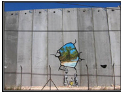
Resim 5. Banksy, "Unwelcome Intervention", Duvar boyama, 2005, Batı Şeria bariyer duvarı. ( https://www.theartstory.org/artist-banksy-artworks.htm ).

Banksy bir duvar resminde ise çocuklarla ilgili olarak bir mesaj vermektedir. Sahilde kumda oynayan çocukları kova ve kürekle tasvir ederken biri ayakta diğeri diz çökmüş olan bu çocuklar, Banksy’nin tipik siyah beyaz stencil estetiğindedir. Sanatçı, çocukların hemen üzerinde, duvarda kırık bir bölüm oluşturup, bu sahte delikten de tropik bir plaj cennetinin fotogerçekçi renkli görüntüsünü yansıtmaktadır. Banksy, bu çalışmayı Ağustos 2005’te İsrail-Filistin Batı Şeria bariyer duvarına yapmıştır. Bu duvarı İsraililer terörizme karşı bir koruma olarak değerlendirirken, Filistinliler amacının ırk ayrımcılığı olduğunu iddia etmektedirler. (Resim 5)