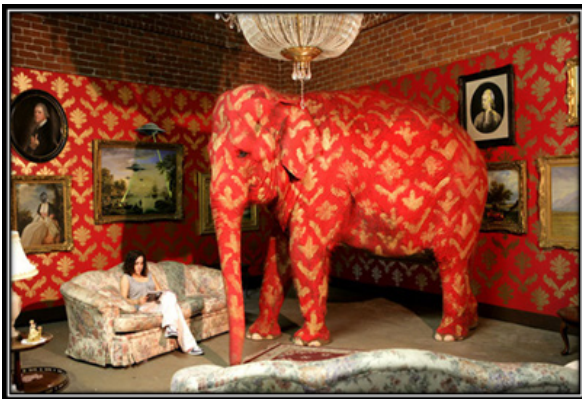
Resim 7. Banksy, "The Elephant Standing in the Room", 2006, Barely Legal adlı sergisi. ( http://www.steveaoki.com/lifestyle/10-really-controversial-and-super-awesome-banksy-pieces/ ).

Banksy, diğer bir çalışmasında ise dünyanın en ünlü tablolarından biri olan Mona Lisa (1503-4) eserini kullanmaktadır. Mona Lisa'yı siyah-beyaz stencil tarzında bir roket fırlatıcı hedeflerken yorumlayan sanatçı aynı zamanda Lisa'ya bir kulaklık da takmıştır. İlk olarak Batı Londra'nın Soho bölgesinde ortaya çıkan bu eserde, Banksy'nin sanat tarihinin en ünlü kadınına güçlü bir modern silahla yan yana koyması kesinlikle düşündürücüdür. Vermek istediği mesajlar aslında Banksy'nin eserlerinde açıkça okunabilmektedir. Da Vinci'nin Mona Lisa'sı zarif ve estetikdir. Ancak Banksy ona güçlü, çatışmacı bir kişilik katar. Mona Lisa'nın meşhur yüz ifadesindeki o gülümsemesi, bu eserde tehditkâr olarak okunmaktadır. (Resim 6)