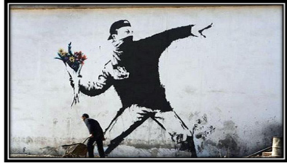
Resim 1. Banksy, "The Flower Thrower", şablon ve spreyle boyanmış, 2005, Bethleem.

zalandırılabilirsiniz. İnsanlar her zaman olayı yanlış anlayabilirler. Ölüm cezasına inanan herkes vurulmalıdır" (Banksy, 2005:93). Bu hikâyede ailesiyle ilgili bir ipucu vermekle birlikte, Banksy bir röportajda ailesi için bile gizemini koruduğunu ve onların kendisini bir ressam ve dekoratör sandığını söylemektedir (Mutlu, 2008). Dolayısıyla Banksy'nin dünya çapında tanınan bir sokak sanatçısı olduğunu ailesi bile bilmemektedir. Bununla birlikte tanınmak istememesini onun Andy Warhol'un on beş dakikalık şöhretini umursamamasına ve şöhretin ardından gelecekleri istememesine bağlayanlar da vardır. Banksy ise tam tersini iddia etmektedir: Ortaya çıkmaya meraklı değilim. Çirkin küçük suratlarını burnunuza sokan yeterince sabit fikirli pislik var etrafta. (...) Bugün çocuklara büyüyünce ne olmak istediğini sorduğumuzda, ünlü olmak istiyorum, diye cevap veriyor pek çoğu. Peki, ne için ünlü olmak istediklerini soruyorsunuz, bunun cevabını bilmiyorlar ya da umursamıyorlar. Bence Andy Warhol konuyu yanlış anlamış: Gelecekte pek çok insan ünlü olacak ve bir gün herkes on beş dakikalığına anonim kalacak (Jones, 2015:103).