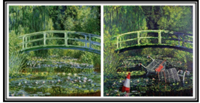
Resim 4. Banksy, "Show Me the Monet", Tuval üzerine yağlıboya, 2005. ( https://www.theartstory.org/artist-banksy-artworks.htm ).

Banksy’nin (Res. 4) bu çalışması, Claude Monet tarafından yapılan Bridge Over a Pond of Water Lillies (1899) empresyonist resmin yeniden üretimidir. Monet’in eseri bahçeyi sakın ve zengin bitki örtüsü ile yansıtırken Banksy, havuza iki adet alışveriş arabası ve bir trafik konisi eklemiştir. Bu bağlamda tüketici topluma gönderme yaparak gerekli olan dan daha fazlasını satın alan çağdaş toplumu eleştirmektedir. Düzene karşı bir başkaldırı niteliği taşıyan eserleriyle Banksy, insan yapımı nesnelere, doğal ortama atılmış olarak temsil ederek, çağdaş toplumun aşırı atık üretimini eleştirip doğaya olan saygısını göstermektedir. (Resim 4)