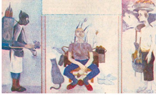
Görsel 4. Neşe Erdok, "Üçlü Yağlıboya", 1979