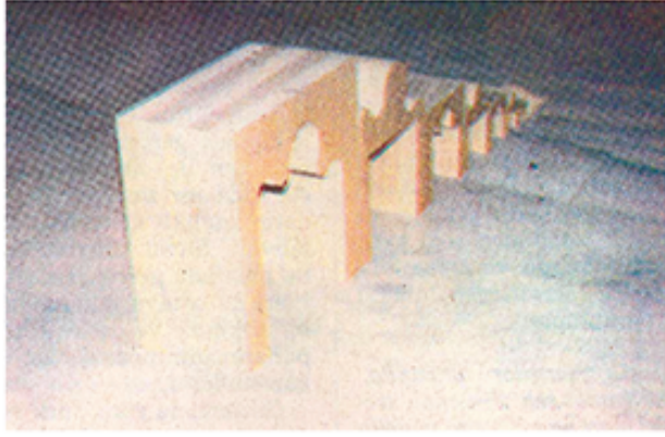
Görsel 2. Ayşe Erkmen, 1979