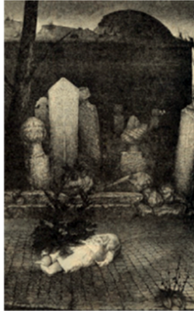
Görsel 7. Aydın Ayan, “Bir Memleketin Simgesel Potresi”, 1980

Aydın Ayan’ın “Bir Memleketin Simgesi Portresi”nde tuvali boydan boya kesen mezar taşlarında, Ercan Süelden’in “Oyun Başlıyor” adlı yağlıboyasındaki gözünü seyirciye diken Şahmaran’da, Ahmet Öner Gezgin’in bireyin kendini tanımada çektiği zorluğu, fotoğraf serisinde etkin plastik öge olarak ortaya çıkmıştır (Görsel 7).