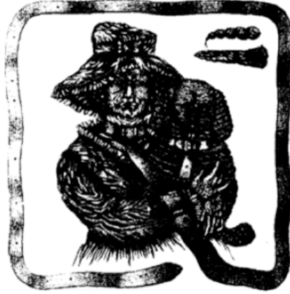
Görsel 6. Balkan Naci İslimyeli, “Köpekli Yaşlı Kadın”, 1977

Aydın Ayan’ın “Bir Memleketin Simgesi Portresi”nde tuvali boydan boya kesen mezar taşlarında, Ercan Süelden’in “Oyun Başlıyor” adlı yağlıboyasındaki gözünü seyirciye diken Şahmaran’da, Ahmet Öner Gezgin’in bireyin kendini tanımada çektiği zorluğu, fotoğraf serisinde etkin plastik öge olarak ortaya çıkmıştır (Görsel 7).