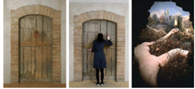
Resim 3. Raol Hausman Kolaj Fotomontaj

Duchamp’ın “Gelin” adlı çalışmasında da kompozisyonda ki kadın bedeni (imgesi) sembolik olarak değerlendirilebilir haldedir. Yapıtındaki kadın bedeni birçok sanat dalında karşılaştığımız estetik beden dışında daha çok geleneksel kalıpları yıkmış ve toplumsal cinsiyet rollerini oluşturan bir kimlikten uzaklaşmış bir eserdir.