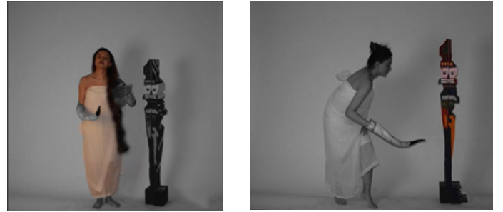
Resim 7. “Kadın İmgesi ve Mask”, Kavramsal Fotoğraf Büşra Şendal Resim 8. “Kadın İmgesi ve Mask”, Kavramsal Fotoğraf (Kesit) Büşra Şendal

İnsanın psikolojik temellerinde beğenme ve beğenilme arzuları vardır. Bu duygular somutlaştırıldığında sanat yapıtları ortaya çıkar. Sanat, insanın iç dünyasının ve ihtiyaçlarının dışavurumudur. Sanat, uygarlığın bir olgusudur. Sanatçılar ise kendi uluslarını temsil eder. Dolayısıyla sanat; din, dil, ırk ayrımı yapmadan her topluma hitap eder. Masklar bir kadın vücudunda Dada’yı simgelemek için kullanılmıştır. Kadın vücudu sanatta kullanılan bir obje olarak değil, estetik olguları Dada hareketi ile birleştirmek için tasarlanmıştır. Böylelikle her sanat akımı iç içe birleştirildiğinde estetik unsur taşıdığı gösterilmeye çalışılmıştır.