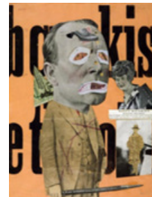
Resim 1. Raol Hausman Kolaj Fotomontaj

"Savaşın yırtıcı ve saldırgan kuvvetini, keskin hatlı formlardan oluşan kolaj, montaj ve hazır malzemelerle aktarabileceklerini düşünen Dadaistlerin resmin yapısına getirdikleri yeni soluk, yükselen fotoğraf teknolojisinin de yardımıyla, resimde gerçeklik arayışındansa; gerçeklikte biçim bozmalara yönelmiş ve yazınlarla desteklenmiş anti-sanat ana fikrini, ifadelerle geliştirmeye olanak sağlamıştır. Yazılı kolaj parçalarıyla desteklenen fikir, hedefini bulmuş ve Hausmann'ın "Sanat Eleştirme" adlı eserinde de (resim 1) görüldüğü gibi izleyiciye yeni bir estetik anlayış ile birlikte sunulmuştur" (Umay, 2017:13).