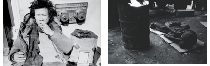
Resim 5. Tehching Hsieh, 'Bir Yıl Performansı', 1981-1982, 'Dış Mekan Parçası', performansı, New York.

Hsieh'in bir yıllık performans kapsamında yaptığı performanslarından üçüncüsü olan 1981- 1982 de yaptığı "Dış Mekan Performansı"dır. Bir yıl boyunca sırtında sadece uyku tulumu ve sırt çantasıyla, en soğuk günlerde bile hiç bir mekana girmeden ve araca binmeden, New York'ta evsizler gibi sokaklarda yaşadı. Çoğu zaman yıkanamadığı için evsizler ve sokak hayvanları gibi çok pis koktuğunu, insanların kendisinden nasıl kaçıp uzaklaştığını gözlemlemiştir. Normalde temiz bir insan olduğunu fakat bu şartlar altında kirliliğini rahatlık olarak algıladığını ifade etmiştir. Dış mekânın katı koşulları içerisinde gerçekten savunmasız ve zayıf bir insan olarak, her şartla baş edebilecek belirli pratikleri zamanla kazanmak zorunda kalmıştır.