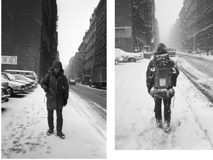
Resim 6. Tehching Hsieh, 'Bir Yıl Performans', 1981-1982, 'Dış Mekan Parçası', performansı, New York.