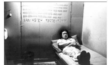
Resim 2. Tehching Hsieh, 'Bir Yıl Performans', 1978-1979, 'Kafes parçası', New York.

Sanatçının performansı, insanların içine kapatıldığı dünyanın kültürel kodlarına maruz kalmaları çerçevesinde, eylemlerinin biricik belirleyicisi olmadıklarını adeta yüzlerine çarpmaktadır. Sanatçının çalışmaları, özgürlük kavramının sınırlarının sorgulanmasına ve bu kavramın açılımlarına neden olmaktadır. Sanatçının Amerika'ya ilk geldiğinde yaşadıklarının, sanatına bakış açısını, duygularını ve düşüncelerini nasıl şekillendirdiği üzerinden yorumlanabilir. 1974'de bir petrol tankerinde denizci olarak çalışırken, Amerika'da tanker limana demir attığında gemiden kaçarak ve yasa dışı bir göçmen olarak New York'a gitmiştir. Bu yeni kültür ortamında elindeki Süper 8 bir kamerası tek sanat yapma aletidir. Bu şehre geldiğinde sanatın nerede ve nasıl yapıldığına dair hiç bir fikri yokken yaşadığı kültür şoku ile 24 yaşından 28 yaşına kadar sanat adına hiç bir şey yapmamıştır. Bu süreç, Tayvan'da geleneksel bir sanat eğitimi aldığından sanata bakış açısını da değiştirmiştir. Karamsarlık ve hayal kırıklığı düşüncelerini yeniden yapılandırmasına neden olmuştur. Artık yeni bir