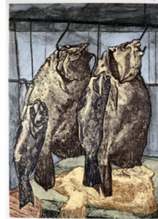
Resim 5. Kalkanlar, 2004, Şekerle vernik - Aquatint, 98.5x69 cm.

Balıkçı tezgahında kalkan balıklarını çengele asılı betimlediği kompozisyonlarında dingin bir dışavurum duyumsanır. Balıkçı tezgahının ıslak ortamını ve kalkan balığının dokusunu, şekerli mürekkep karışımı fırçasıyla plaka üzerine yayarak araştırmıştır. Yatay ve dikey doğru çizgilerle bölümlendiği, asimetrik kompozisyon ilkelerini uyguladığı fonun üzerine, kalkan balıklarının; çoğu zaman lekeye varan, kabaca eliptik olarak niteleyebileceğim formunu kaynaştırarak karışıklık oluşturmuştur. Burada "kaynaştırma" sözcüğünü bilinçli olarak seçiyoruz, çünkü kompozisyonlarında iyi gözetilmiş bir bütünlük söz konusudur. (Resim 5)