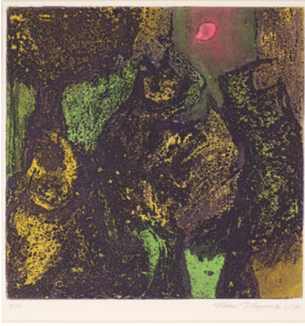
Resim 3. "Kalkanlar", 1971, Şekerle vernik - Aquatint, 25x24 cm.

miştir. Laborant Kani Aksoy'un da eğitim kadrosundaki varlığıyla bu yeni dönemde araştırma, deney ve bulgu açısından yeni bir süreç başlamıştır. Atölyeye öğrenci ilgisinin arttığı ve öğrencinin çağdaş estetik duyarlılık ve teknik bilgiyle donandığı; üretim açısından da verimli yıllara girilmiştir. Gravür atölyesinin arşivi incelendiğinde 70'li yıllarda teknik çeşitlilik ve yetkinlik gösteren yoğun bir üretimin yapıldığı görülmektedir. Renkli baskı tekniklerine ilginin arttığını, ifade arayışlarına yönelik deneyselliğin önem kazandığı anlaşılmaktadır. Fethi Kayaalp'in "Kalkan Balıkları, 1971" gibi, "şekerli çini" ve "aquatint" teknikleriyle yaptığı renkli baskılar Türk gravür tarihinde yerini almıştır. (Resim 3)