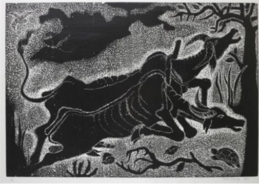
Resim 6. "Ha gayret" 1967, Ahşap Baskı, 69x96.5 cm.

Ha Gayret" adlı ahşap baskısında boyunduruğa koşmuş bir çift manda öküzünün belirsiz olan yüklerinin ağırlığıyla dizlerinin üzerine çöktükleri görülmektedir. Sanatçı, manda figürleriyle kadraji çaprazına bölmüştür. Karşı dengeleyici hareketi tam köşeye yerleştirdiği bir kaplumbağa, öndeki manda figürünün dizden bükülmüş bacakları ve ikinci mandanın kuyruğuyla oluşturmuştur. (Resim 6)