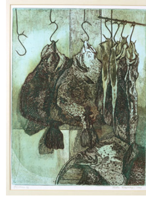
Resim 4. "Çeşitleme", 1979, Şekerle vernik - Aquatint, 59x44 cm.

"Ben adalıyım. Orada kalkan balığı yok. Envai çeşit balık var orada, çok güzel balıklar ama kalkan balığı yok. Kalkan balığını ben İstanbul'da tanıdım. Kalkan balığının yapısı çok güzel, güzel bir dokusu var onun, o beni biraz çekti. Tamam dedim, aradığım form. Onun için de kalkan çalıştım. Bir de askıda oluşları beni etkiliyor çok. Çarmığa geniş. O form, o biçim çok etkili. İster kenarları paralel olsun ister paralel eğilimli olsun beni çok çekiyor." (Sevinç; 2012: 97)