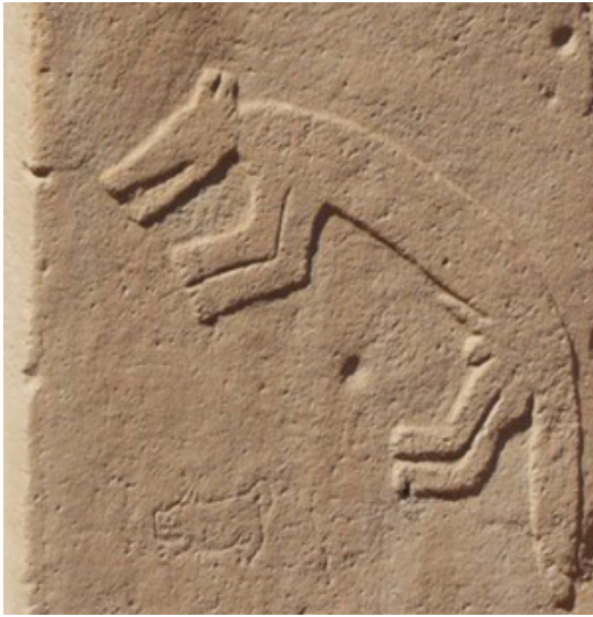
Resim 1. Göbeklitepe’de taş üzerine kazınmış hayvan figürleri.

Coğrafyamızda yer alan, 11600 yıl öncesine dayandığı ileri sürülen ve kült merkezi olarak tanımlanan Göbeklitepe’de bulunan, taşlar üzerinde işlenmiş çeşitli hayvan ve insan figürleri, insanın kazıyarak çizme – yazma eylemine en eski örnek olarak verilebilir. (Resim 1)