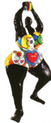
Görsel 10. Niki de Saint Phalle, Siyah Venüs

Botero'nun "Broadgate Venüs" heykeli, diğer Venüs çalışmalarının aksine şehvetsiz bedene sahip olarak tasvir edilmiştir. Heykelde, cazibeye ya da tutkuya davetiye çıkaran bir ibare yoktur. Bunun yerine, cinsel bölgesini saran örtü sayesinde iffetli, saygın, utangaç bir Venüs olarak betimlenmiştir. Dahası Willendorf Venüs'ü gibi anaç bir karakter olarak da betimlenmiştir. " (Hanstein, 2003).