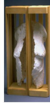
Görsel 13. Susan Grabel, Venüs, Kağıt döküm, Ahşap, 7,5x7,5x16,5cm, New York, 1999

Pistoletto tarafından sıradanlığı vurgulanan Venüs, sanatçı Jeff Koons tarafında tekrar anaç ve bereket tanrısı olarak yorumlanmıştır. Popüler kültür söylemleriyle sanatçı tarafından yeniden yorumlanmış olan “Balon Venüs” adlı eser, “Willendorf Venüs” referans alınarak yapılmıştır. Sanatçı herkesin anlayıp zevk alabileceği çalışmalar üretmek istiyorum söylemi ile ürettiği Balon Venüs, 259.1 x 121.9 x 127 cm ölçülerinde gerçekleştirmiştir. (Görsel 12) ( https://www.artspace.com/jeff_koons/balloon-venus ).