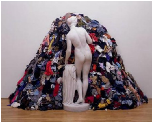
Görsel 11. Michelangelo Pistoletto, Paçavra içinde Venüs, Mermer Reproduksiyon, 212 x 340 x 110cm Tate Modern, Londra, 1967

Sanatçı yapmış olduğu Siyah Venüs çalışmasını; bereket ve doğurganlığı önemli hale getirerek, ideal güzelliğin savunduğu oranların aksine abartılı oranlarda siyah bir tene sahip kadın olarak gerçekleştirmiştir.