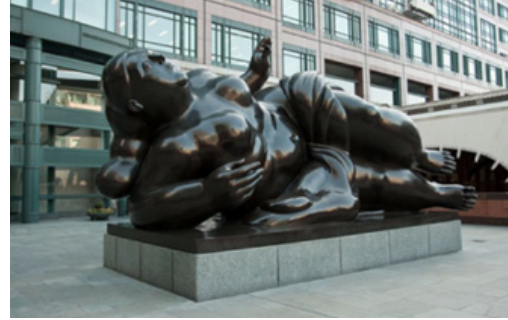
Görsel 9. Fernando Botero, Broadgate Venüs, Londra

Güzellik kavramını yerlebir eden bir diğer sanatçı da kuşkusuz ki Fernando Botero olmuştur. Sanatçı ideal güzele bir başkaldırı olarak "Broadgate Venüs" isimli eserini üretmiştir.