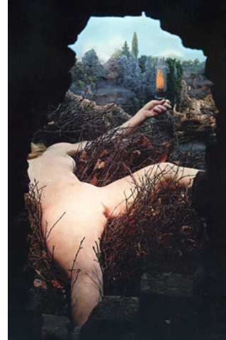
Görsel 6. Marcel Duchamp, Veriler: 1-Şelale 2- Gaz Aydınlatma, 1966

Venüs imgesi, geçmişteki Venüs çalışmalarına göndermeler yapsa da artık farklı anlamlar taşımaya başlamıştır. Sanatçılar, Venüs'ü sadece aşk ve güzelliğin temsili olarak görmeyip sorgulama yapmaya başlamışlardır. Aşağıda nesnesi Venüs olan çalışmalardan örnekler verilmiştir.