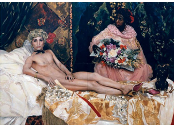
Görsel 8. Yasumasa Morimura, Portre (Futago), 1988

Klasik güzellik kurallarına karşı çıkan bir diğer sanatçı da Joel-Peter Witkin olmuştur. Sanatçı özellikle kurguladığı ve izleyiciyi rahatsız edecek figüratif düzenlemeler üzerinden çalışmalar gerçekleştirmiştir. Bu bakış açısı ile yeniden yorumlayıp ürettiği çalışmalar arasında "Venüsün Doğuşu" (Görsel 7) adlı eserindeki Venüs'ü hermafrodit bir insan olarak yansıtmıştır. Sanatçı, kalıplaşmış güzellik anlayışına bu yapıt ile kadın güzelliğine eleştirel bir bakış açısı kazandırmıştır. Venüs'ü çift cinsiyetli bir insan olarak tasvir etmiş olup, toplumun görmezden geldiği sorunları irdeleyerek bu yöndeki yasakları ve ön yargıları yıkmaya çalışmıştır (Göktaş, 2008: 235-244).