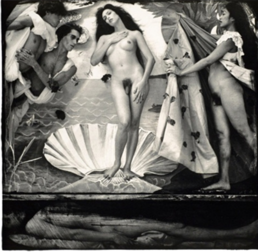
Görsel 7. Joel-Peter Witkin, Venüs'ün Doğuşu, 37.5x38cm, 1988

lamıyla kendisini dikizleyenlere ışık tutmaktadır. Sanatçının bu çalışması ile kadının seyirlik bir nesne olarak sunulmasına yönelik tepkisini ortaya koyduğu düşünülmektedir (Açan, Aygenç, 2016: 239-253).