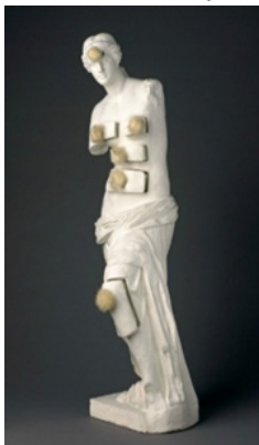
Görsel 5. Salvador Dali, Venüs de Milo, 1936

Hegemonik bir sanat anlayışına dayanan modern sanattan açıkça ayrılarak herhangi bir üst-anlatıyı takip etmeyecek başlı başına böyle bir model olma iddiasını reddetmiştir. Güzelliği tanımlayan bildiğimiz klasik formlar yerine sanatçı artık kişisel anlatımına hizmet eden formlar ortaya koymaya başlamış ve böylelikle ideal güzelliğin temsili Venüs artık farklı görüntülerde karşımıza çıkmaya başlamıştır.