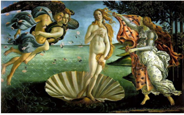
Görsel 3. Sandro Botticelli, Venüsün Doğuşu, 175 x 278 cm, Tuval Üzerine Yağlıboya, Floransa, 1486

Birebir insan ölçülerinde, erotik, zarif, doğallık ve anıtsallık arasında ilk çıplak kadın, klasik döneme damgasını vuran bu muhteşem vücut, denizin içinden çıkan bu güzellik Antik Çağ'ın küllerinden yeniden doğuşu'nu simgeler niteliktedir (Kınay, 1993: 33). Bu eserin anlamı, ancak ona bir düşüncenin şekil bulmuş hali gözüyle bakıldığında anlaşılabilir. Bir resmin veya heykelin sahip olduğu mitolojik anlatı, birden güncel siyasete ait söylemler içeren bir hale gelebilmektedir (Krausse, 2005).