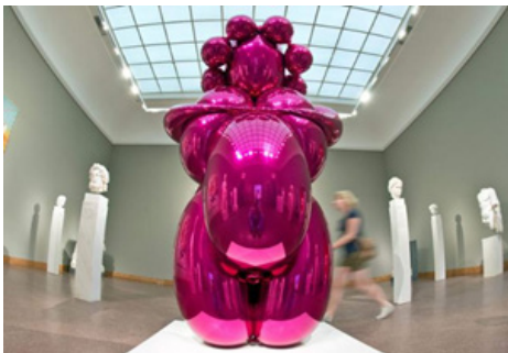
Görsel 12. Jeff Koons, Balon Venüs, 259.1 x 121.9 x 127 cm, Gagosian Galerisi, 2012

Yüzyıllardır aşk ve güzellik tanrıçası olan Venüs bu çalışmada artık güzellik kavramının sıradanlığına ve önemsizliğine vurgu yapan bir yorumlamayla izleyicinin karşısına çıkmıştır (Keats, 2013).