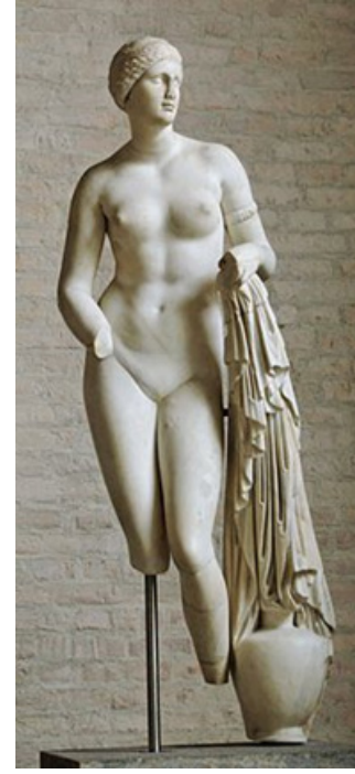
Görsel 2. Praksityeles, Knidos Afrodit, MÖ. 1yy

Batı sanatı tarihine baktığımızda estetik bir obje olarak ortaya konan Afrodit, genellikle çıplak olarak betimlenmiştir. İlk çıplak kadın betimlemesi ise heykeltıraş Praksiteles tarafından Antik Yunan döneminde yapılmıştır. İdeal güzelliği ve cinsel çekiciliği ile ele alınan ve sanat tarihinde önemli bir yere sahip olan bu heykel ‘Knidos Afrodit’ (Görsel 2) olarak bilinmektedir. (Caner, 2004:80).