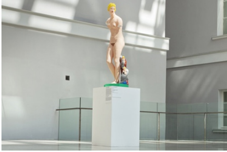
Görsel Resim 15. Hans-Peter Feldmann, Medici Venüs, 2014