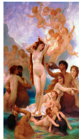
Görsel 4. William-Adolphe Bouguereau, Venüsün Doğuşu, 1879

Bir başka Rönesans ressamı Tiziano Vecelli ise tıpkı ustası Giorgione gibi yatan kadın formunu kullandığı "Urbino Venüsü" isimli eserinde, Venüs'ü cinsel çekicilikle ele almıştır. (Freedberg,1989: 13-17). Resimde Venüs'ün duruşu Giorgione'nin 'Uyuyan Venüs' isimli çalışmasında olduğu gibidir. Venüs'e, resimde şehvetli bir duruş verilmiştir. Bir tanrının sahip olduğu özellik ve belirtilerin hiç biri izleyiciye yansıtılmamıştır. Venüs, bu resimde çıplaklığına aldırış etmeden doğrudan izleyiciye bakmakta olarak resmedilmiştir. Venüs'ün bu duruşuyla birlikte resimde yer alan ve sadakati simgeleyen köpeğin uyuyor olması Venüs'ün sadakatsizliğini yansıtmaktadır. Sanatçının Venüs'ü bu şekilde yansıtmayı, oldukça dikkati çekmiş ve aynı zamanda tepki almasına yol açmıştır. Amerikalı bir yazar olan Mark Twain, bu eseri dünyanın sahip olduğu en aşağılık ve müstehcen resmi olarak değerlendirmiştir. Ancak bu resim Edouard Manet'in Olympia adlı eserine ilham olmuştur. ( wikipedia.org/wiki/Urbino_Venusu?veaction=edit&section=1 ).