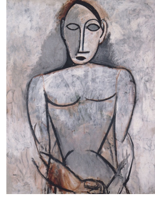
Resim 2. Picasso, Elleri kavuşturmuş kadın, 1907

Bu dönemde sanatçılar arasında bu değişik kaynaklı sanatı tanıma isteği kök salmıştır. Fovizmin ve Kübizmin temelleri Afrika sanatının örnekleriyle bu sergi etkisiyle atılmış, sergideki bu etnik ve mistik objeler sanatçıların "ilkel sanat" keşfine yol açmış ve sanat anlayışlarını anlatımcılıktan kavramsallığa taşımışlardır. Picasso'nun ünlü eseri Avignonlu Kızlar, Elleri Kavuşturmuş Kadın gibi eserlerinde Afrika etkisi görülmektedir.