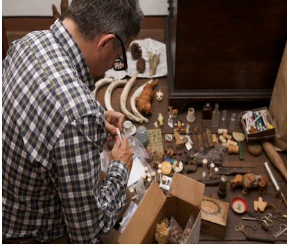
Resim 5. Mark Dion, Amerikalı sanatçı

tüm bitki alemini hiyerarşik bir yapıda sınıflandırmıştır. Bu sınıflandırma ve hiyerarşik yapı tarihte ilk kez yapılmış ve hala kullanılmaktadır. Sanatçılar da bu yöntemi benimsemiş, istifleme ve kategorize etme, sanatçıların da yöntemi haline gelmiş ve yerleştirme mantığıyla bir arada ilerlemiştir.