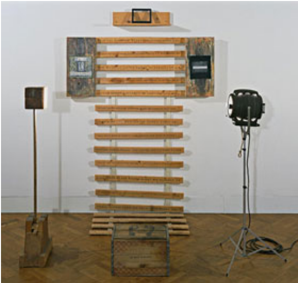
Resim 9. Renee Green, Sa Main Charmante, 1989

seren Kızılderili asıllı Jimmie Durham da bu konuda işler üretmiştir. Siyahi bir kadın sanatçı olan Renee Green ise zengin metin ve fotoğrafları da dahil ettiği enstelasyonlarında etnik ve cinsel kimlik üzerine siyasi ve sosyal içerikli eserler üretmiştir. Özellikle de siyahi kadın kimliği üzerinden yürütülen politikaları, tanınmış siyahi kadın figürleri kullanarak eleştiren sanatçı, 1800’lerde burjuva kesimin eğlencesi haline gelen ve ucube sirklerinde şov malzemesine dönüştürülen “Hottentot Venüsü” yerleştirmesiyle tanınmıştır. Cinsel organların büyüklüğü nedeniyle siyahi ırkın, cinsel organı büyük ama beyni küçük vahşi ırka ve hayvana en yakın canlı olduğu düşüncesinin bilim adamlarınca ortaya atıldığı dönemde, Sarah Bartman adlı genç kadının uğradığı süistimal ve işkenceler “Sa Main Charmante” isimli işinin çıkış noktası olmuştur.