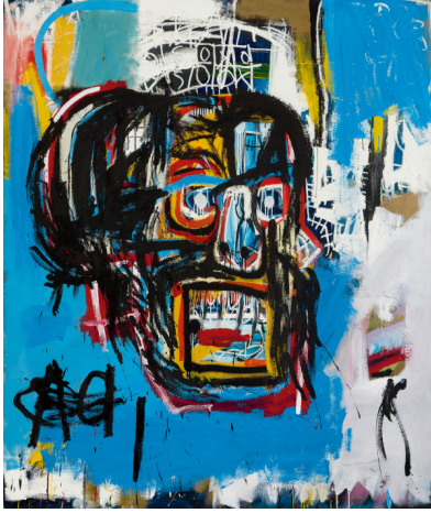
Resim 4. Jean Michel Basquiat, isimsiz, 1982