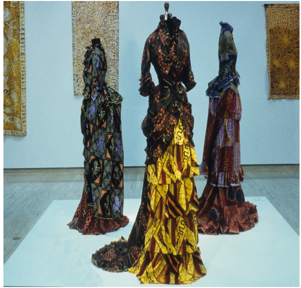
Resim 10. Yinka Shonibare, Senin gibi bir kız nasıl senin gibi bir kız olabilir? 1997

1900’lerin pek çok genç sanatçısı, yeni kültürel melezleşme ve küresel etkileşim koşullarını yansıtıyordu. İngiltere’de doğan ancak Nijeryalı ebeveynlerinin Lagos’a getirdiği Britanyalı sanatçı Yinka Shonibare, 1980’li yılların kültürel açıdan yer değiştirmek zorunda kalmış pek çok sanatçısını meşgul olduğu “özgün” etnik köken fikriyle mücadele etmeye çalışıyordu. Afrika’yı ifade eden ama aslında ham halini İngiltere veya Hollanda da alarak dokunan desenli kumaşlarla çalışan sanatçı sömürgecilikten kaynaklanan kültürel melezliği ifade eden elbiseler üretti.