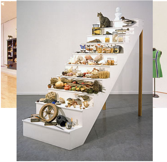
Resim 6. Mark Dion, yerleştirmeler

Amerikalı sanatçı Mark Dion' un sanatsal yöntemi bu duruma iyi bir örnektir. Sanatçı, incelemelerini bilimsel, sosyal ve kültürel sınıflandırma ve istifleme üzerine yoğunlaştırmış ve bir bilim adamı ya da arkeolog gibi çalışmıştır.