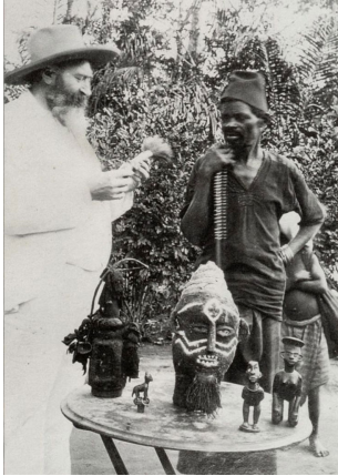
Resim 1. Henri Matisse, 1906

1906'da Musee d'Etnographie du Trocadero'da (Bugün Musee de L'Homme adı altında birleştirilen) yani 1878 yılında kurulan Fransa'nın ilk arkeoloji müzesinde Afrika ve Okyanus Ülkelerine ait masklar, heykeller ve çeşitli objelerden oluşan bir sergi açıldı. Fovist ressam Vlaminc Paris'te, Tracedora'da Etnografya ve Antropoloji müzelerine gitmiş, burada sergilenen ve sanat yapıtı olarak kendisini heyecanlandıran Afrika ve başka ülkelerden toplanmış ilkel el işlerini görmüştü. 1904 sıralarında iki üç Afrika heykeline sahip olan Vlaminc kısa süre sonra iki figürle bir de maske edinmişti (Lynton, 29). Dönemin başta Picasso, Matisse, Derain, gibi avangart sanatçıları da bu Afrika heykellerine ilgi duymuş hatta Matisse oldukça zengin bir ilkel yapıt koleksiyonu oluşturmuştu. O yıllarda sanatçıların kendi yüksek sanat miraslarının dışında bir şey aramaları pek enderdi; ayrıca Afrika oymalarının çoğu Avrupa sanat gelenekleriyle kesin bir karşıtlık içindeydi. Bu garip, bize uzak ve bir anlamda zaman dışı sanatın gücünü ilk gören ve sanatçı arkadaşlarına gösteren kim olursa olsun, yaratıcı sanatın altın madeninde, zamanla hepimize açılacak zengin bir damar bulmuş oluyordu (Lynton, 29).