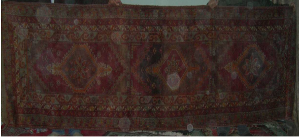
Resim 4. Halı Yolluk Örneği (Hülya Kaynar, 2007)

Yaşamın sonlanmasıyla ilgili anlamlar içeren kuş motifi, Anadolu sembolizminde ayrıcalıklı bir yeri vardır. Baykuş, karga gibi kuşlar uğursuz, güvercin, kumru, bülbül gibileri ise uğurlu sayılırlar. Kuş bazen mutluluk, sevinç, sevgi, bazen ölen kişinin ruhudur. Kadın ile özdeşleşmiştir. Kuş, kutsaldır, özlemdir, haber beklentisidir, kuvvet ve kudreti simgeler (Erbek, 2002: 190).