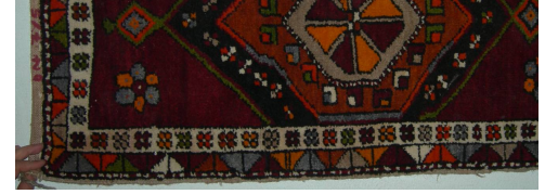
Resim 5. Halı Yastık Örneği (Hülya Kaynar, 2007)

"Ok, cesaret ve kahramanlık simgesi olup, bu motifi halısına dokuyan kadın, erkeğinin güçlü ve yiğit kişi olduğunu anlatmak ister" (Ateş, [t.y.]: 25).