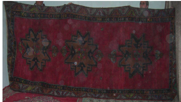
Resim 7. Halı Yaygı Örneği (Hülya Kaynar, 2007)

Zemin, baklava dilimi görünümündeki basamaklı madalyonların birbirine bağlı şekilde sonsuza uzanmasından oluşmuştur. Her bir madalyon, merkezine Türkmen gülü formunda haçvari ve çapraz yerleştirilen güllerle bezeli pıtraklardan meydana gelmiştir. Aşkî simgeleyen kırmızı gül, bolluk bereket ve aynı zamanda nazarlardan korunma anlamındaki pıtrak motifleriyle, dokumanın ana temasını ortaya koymaktadır.