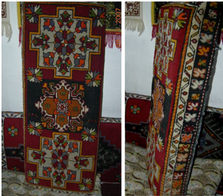
Resim 8. Halı Yastık Örneği Ön ve Yan Detayı (Hülya Kaynar, 2007)

Zemin, sekiz kollu yıldız formundaki madalyonlarla onların uzantısı olan stilize çiçeklerin ötelemeli yerleşiminden oluşmuştur. Yaşam çizgisinin ifade edildiği sekiz kollu yıldızlar, geometrik merkezine yerleştirilen ve iç dolgusunda bereket sembolü kullanılan sandık motifleri ile bezenmiştir.