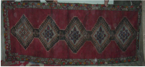
Resim 6. Halı Yolluk Örneği (Hülya Kaynar, 2007)

İç ve dış altıgen arasında kalan boşluk, farklı renklerdeki gonca güllerle, mihrap nişi içinde kalan boşluk da fiyonk şeklinde düzenlenmiş çiçeklerle bezenmiştir. Mihrap kemerinin dış kısmı ise güzelliklerle dolu bir ömrün ifadesi olarak, karşılıklı duran dört adet çiçeklerle doldurulmuştur.