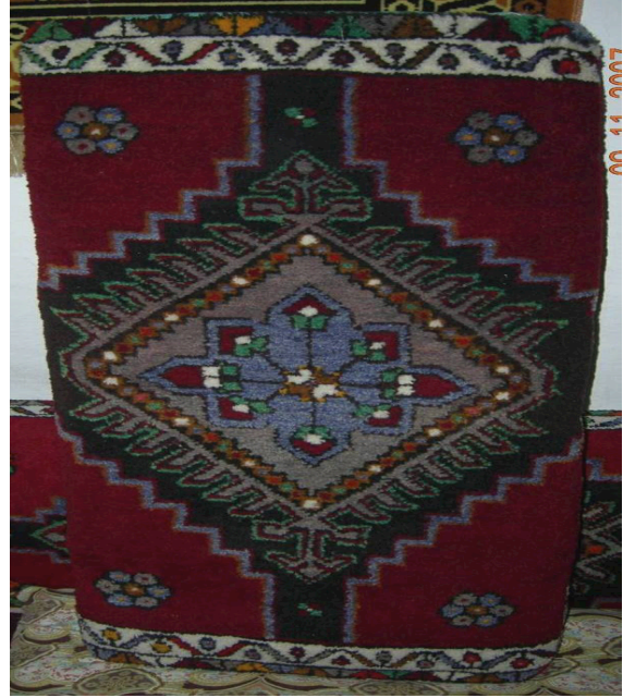
Resim 10. Halı Yastık Örneği Ön ve Yan Detayı