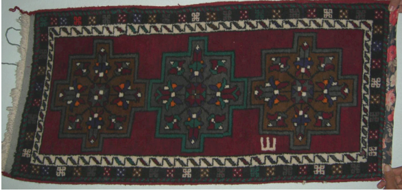
Resim 9. Halı Yastık Örneği (Hülya Kaynar, 2007)

olarak zemin boşluklarına serpiştirilmiştir.