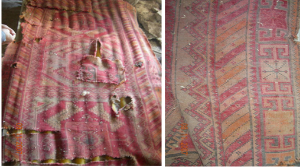
Resim 1. Halı Yaygı Örneği ve Halı Sırtı Detayı (Hülya Kaynar, 2007)