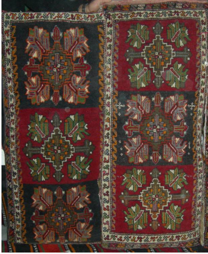
Resim 2. Halı Yastık Örnekleri (Hülya Kaynar, 2007)