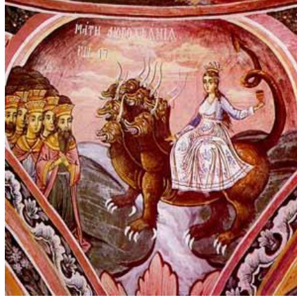
Resim 3. "Apocalypse(Kıyamet)", TroyanManastırıKilisesiGalerisi'ndenbirdetaybir detay,1848, https://michelangelo.pixel-online.org/artist_scheda432c.html?art_id=7

Ivan Mrkvicka (1856-1938), Parma Dükü Robert'in kızı prenses Maria Louisa'yı (Resim 4) (1870-1899), Bulgar Ortaçağ Kraliyet geleneklerine uygun olarak bir tahtta resmetmiştir. Resimde kullanılan semboller, resmin kurgulanışı, kompozisyonu açısından bakıldığında Bizans resim sanatından etkilenerek yapıldığı açıkça görülmektedir. Resmi çevreleyen çerçevenin ayrı bir önemi bulunmaktadır. Bulgar heykel sanatının kurucularından sayılan Boris Schatz tarafından yapılan çerçeve Bulgar dekoratif unsurlarını 20 kabartma ile birleştirerek kederli melekleri, prensesin koruyucu azizi Aziz Cecilia'yı ve Bulgaristan'ın farklı etnik kökenlerini betimlemektedir. Mesajı şudur: "Ben ölüyorum ama cennetten Bulgaristan'ı hep izleyeceğim." ( http://bnr.bg/en/post/100696132/national-gallery-of-arts-presents-ivan-mrkvicka-and-modern-bulgaria-painting ).