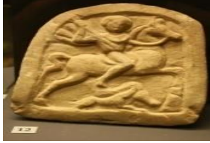
Resim 1. Süvari

Bulgar sanatına ait burada ele alınan ilk örnek (Resim 1) II. yüzyıldan kalma süvari kabartmalı küçük taş levhadır. Süvari at sırtında avlanır haldedir. Ona eşlik eden kopek ya da aslanın yardımıyla kovalanan ve domuz olduğu tahmin edilen bir hayvanı avlamaktadır. M.Ö. IV yüzyıla dayanan Trak mezarları da o dönemin artistic algısının önemli örnekleridir. Şimdiye kadar bu mezarlardan 14 adet, günyüzüne çıkartılmıştır. Kazanlıkta bulunan mezarlardan biri o dönemden günümüze kadar korunmuş olarak ulaşan tek freske sahip örnektir.