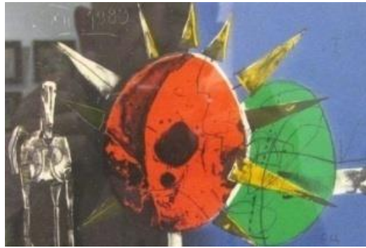
Resim 11. Stoian TzanevTzanev, Godinatana .... (... Senesi), 1989, https://cavalet.bg/collections/stoian-tzanev-kartini/grafika

Resmin adında yeralan 1989 senesi Bulgaristan'da yaşayan Türklerin ülkeden çıkmaya zorlandığı bir döneme işaret eder. Godinatana .... (... Senesi) (Resim 11) olarak aradaki boşluğa istediğiniz duyguyu yerleştirmeniz mümkündür. Sanatçının bu tarihte yaşanan kargaşa, ayırım, zulme ve haksızlıklarla ilgili kendine ait ironic yaklaşımın oldukça net bir şekilde görüldüğü düşünülmektedir (Huzur,2019).