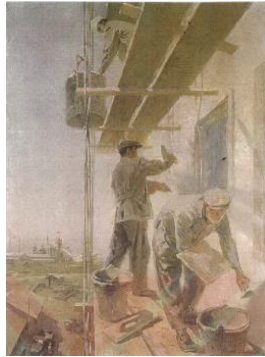
Resim 16. Nikola MİRÇEV, İnşaat İşçileri, 1959, (Çolakoğlu, 1998: 225-230)

Nikola Mirçev'in İnşaat İşçileri (Resim 16) adlı tablosu Bulgar aydınlanmasının temel taşlarından olan işçi sınıfı ve faaliyetleri ile emeğin yüceltilmesi temalı, dönemi, ülküyü anlatan resimlerden biridir.