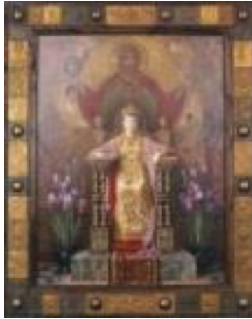
Resim 4. Maria Louisa

Ivan Mrkvicka (1856-1938), Parma Dükü Robert'in kızı prenses Maria Louisa'yı (Resim 4) (1870-1899), Bulgar Ortaçağ Kraliyet geleneklerine uygun olarak bir tahtta resmetmiştir. Resimde kullanılan semboller, resmin kurgulanışı, kompozisyonu açısından bakıldığında Bizans resim sanatından etkilenerek yapıldığı açıkça görülmektedir. Resmi çevreleyen çerçevenin ayrı bir önemi bulunmaktadır. Bulgar heykel sanatının kurucularından sayılan Boris Schatz tarafından yapılan çerçeve Bulgar dekoratif unsurlarını 20 kabartma ile birleştirerek kederli melekleri, prensesin koruyucu azizi Aziz Cecilia'yı ve Bulgaristan'ın farklı etnik kökenlerini betimlemektedir. Mesajı şudur: "Ben ölüyorum ama cennetten Bulgaristan'ı hep izleyeceğim." ( http://bnr.bg/en/post/100696132/national-gallery-of-arts-presents-ivan-mrkvicka-and-modern-bulgaria-painting ).