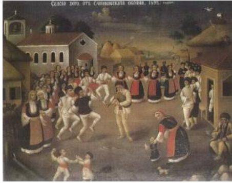
Resim 15. Smakov çevresinde halkoyunları, Nikola OBRAZANİSOV (Çolakoğlu, 1988:226)

Smakov çevresinde halkoyunları (Resim 15) konulu Nikola Obrazanisov'un çalışmasında Kilise ve sivil mimari arasındaki açık alanda yapılan köydüğünü, tamamen geleneksel folkloric öğelerin ve Bulgar köy yaşamının yaşatıldığını gösteren bir belge niteliğindedir.