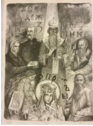
Resim 12. Stoimen Stoilov, 1150 Godini Kirilitsa (1150 Yıl Kiril Alfabesinin Yazılışı), 2013

Resimde (Resim 12) Rus Çarı II.Nikolay'ın kızı Prenses Olga, Kiril alfabesi yazarlarından Methodios, Rus yazar Puskin, Aziz Kiprian, Rus Çarı Nikolay II, Bulgar şair ve yazar İvan Vazov'dur, Kyrillos resmedilmiştir. Bu resimde Bulgar ve Rus tarihi için önemli ancak farklı tarihlerde yaşamış kişilerin bir arada ve birlik içinde resmedilmesi Rusların Bulgar kültürünü alt kültürleri gibi görmeleri, ham Bulgar kültürünü yok saymalarının yansıması olarak yorumlamak mümkündür. Rus tarih yazımı tarafından Bulgar olduğu kabul edilen Kiril ve Metodiy kardeşler, hem Ortodoks Hıristiyanlığı hem de Kiril alfabesini Ruslara kazandırmışlardır. Resimde arkada Rus ve Bulgar kiliseleri sembolize edilmektedir. Aşağıda Kiril'in hemen yanında duran kitabın üzerindeki mimari Kiril alfabesinin yazıldığı kilise ile ilişkilendirilmiştir. Çar Nikolay resmi üniforması içerisinde ve din adamı ve kilise ile yanyana, dayanışma içerisindedir. Prenses Olga başında halesi, elinde dinin sembolü haçı tutmakta ve din adamının etekleri dibinde yer almaktadır. Figürler konumları, yaşadıkları dönemin özelliklerini gösteren kostüm ve duruşları ile resmedilmişlerdir.