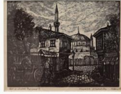
Resim 9. SidoniyallievaAtanasova , EskiRazgardKentinden Bir Görüntü I,1940, https://bg.wikipedia.org/wiki/%D0%A1%D0%B8%D0%B4%D0%BE%D0%BD%D0%B8%D1%8F_%D0%90%D1%82%D0%B0%D0%BD%D0%B0%D1%81%D0%BE%D0%B2%D0%B0

Elveda Arkadaşlar adlı resim (Resim 10) 1876 yılında Osmanlı İmparatorluğuna karşı başlatılan ayaklanmaya gönüllü asker olarak katılanları uğurlama törenini anlatmaktadır (Huzur,2019). Egemen "Rus" kültürü kendi çıkar ve planları doğrultusunda Bulgar halkını ikna etmiş ve ölümle sonuçlanabilecek bir savaşa gönüllü katılmalarını sağlamıştır.