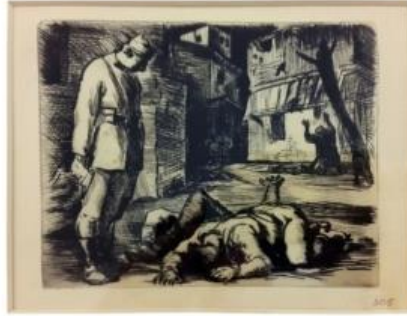
Resim 8. İliya Petrov, İspanya,1939 http://www.artprice.bg/autor_details.php?act=data&elem_id=32

İliya Petrov'a ait İspanya adlı resimde (Resim 8) İspanya'da (17 Temmuz 1936'da başlayıp, 1 Nisan 1939'a kadar süren) iç savaşta yaşananlar konu olarak ele alınmaktadır. Petrov, 1926 Sofia Güzel Sanatlar Akademisi mezunudur. Yüksek Lisansını Münih'te burslu olarak yapmış, Avrupa ve özellikle İspanyol sanatını iyi kavramış ve teknik / içerik açısından bu kültürü sanatıyla yansıtabilen bir sanatçıdır.