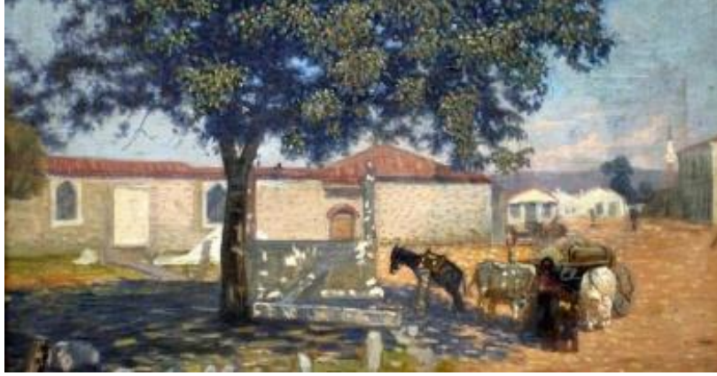
Resim 5. Anton Stefanov Mitov, (1862-1930), peyzaj

Peyzaj (Resim 5) adlı bu resimde de arkadaki cami ve minaret ile kaynaşmış, bir arada yaşayan Hıristiyan ve Müslümanların günlük yaşam izlerini bulmak mümkündür. 5.yüzyıla ait Bulgar minyatürü (Resim 6). Minyatürler karmaşık şekilli kompozisyonlardır. Peyzajlar, mimari motifler, şehirler, kiliseler, kadınlar, erkekler, yöneticiler, insane figürleri, denizciler, savaşlar, din gibi pek çok tema minyatürlerin konusu olabilirler. Perspektif ilkelerinin uygulanmadığı görülen bir iç mekân tasviri söz konusudur. Bulgar Çar'ı Krum'un Nicephorus yenilgisinin ardından verdiği davet tasvir edilmektedir. Bizans resim sanatının Başkent Üslubu'ndan etkilenildiği anlaşılmaktadır.