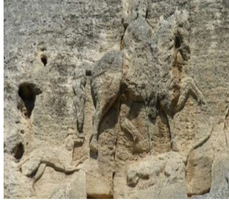
Resim 2. Trak Atlısı

Aynı şekilde günümüze kadar ulaşan pek çok rölyef ve bunların en ünlüsü Trak atlısı (Resim 2) yine bu döneme ait eserlerdir. Hıristiyanlığın kabulünden sonra (M.S. 864) üç boyutlu figurative heykelin yerini bezemeye dayalı (dekoratif) heykel sanatı alır ve gelişme gösterir. Preslav'da görülen üç boyutlu taş işçiliği de bu anlamda süsleme için kullanılmış olup mimari birer unsura olan kornişler, frizler, taşıyıcılar, sütun başlıklarından ve hayvan figürlerinden oluşmaktadır. Aynı şekilde burada Orta Çağ'a ait ilk hayvan figürlü sütun başlıkları görülmüştür. Bu sütun başlıklarının benzerlerine Roma İmparatorluğunda rastlanmaktadır.