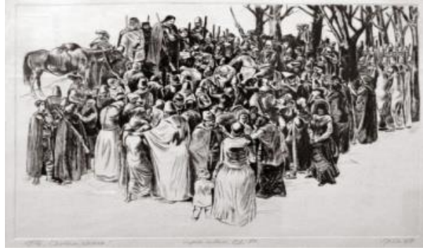
Resim 10. Grigor Spiridonov, ElvedaArkadaşlar, 1876, https://www.artprice.bg/autor_details.php?act=data&elem_id=388

Elveda Arkadaşlar adlı resim (Resim 10) 1876 yılında Osmanlı İmparatorluğuna karşı başlatılan ayaklanmaya gönüllü asker olarak katılanları uğurlama törenini anlatmaktadır (Huzur,2019). Egemen "Rus" kültürü kendi çıkar ve planları doğrultusunda Bulgar halkını ikna etmiş ve ölümle sonuçlanabilecek bir savaşa gönüllü katılmalarını sağlamıştır.