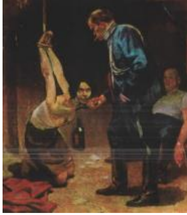
Resim 14. Kadın Rensis, 1964, Nikola Mireviç) (Çolakoğlu, 1998: 225-230)

Smakov çevresinde halkoyunları (Resim 15) konulu Nikola Obrazanisov'un çalışmasında Kilise ve sivil mimari arasındaki açık alanda yapılan köydüğünü, tamamen geleneksel folkloric öğelerin ve Bulgar köy yaşamının yaşatıldığını gösteren bir belge niteliğindedir.