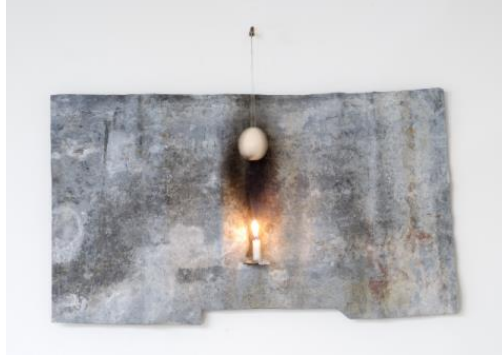
Resim 3. Pier Paolo Calzolari, 1979.

rahatsızlıktır. Özellikle yok olan gelip geçici malzemelerle ortaya çıkardıkları eserler, kalıcı olmadıkları için alınıp satılması olanaklı olmayacaktır.