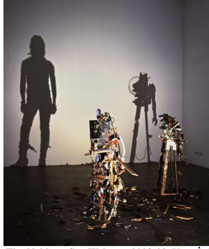
Resim 9. Tim Noble ve Sue Webster. 2008-09. Kötü İş Parçaları.

geliştirirler. Noble ve Webster bu sürece ve insanların soyut formları nasıl değerlendirdiklerine aşınadır. Kariyerleri boyunca insanların soyut imgeleri nasıl algıladıkları ve anlamlarıyla nasıl tanımladıkları fikrini incelediler. Sonuç olarak soyut formların nasıl figüratif formlara dönüşebileceğini yeniden tanımlamaları oldukça şaşırtıcıdır (Crazy Girl, 2011).