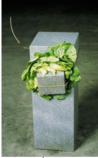
Resim 4. Giovanni Anselmo, İsimsiz (Sebze Yiyen Heykel). 1968.

Anselmo "Sebze yiyen heykel" ile yine ironik bir düşünceyi yansıtmıştır. Betonla, doğal bir ürünü bir arada sunan sanatçı, sanat yapıtını sebze çürüyene kadar var edecektir.