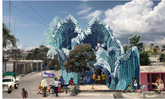
Resim 6. UMA. 2019. Yeni Dalga, Tulum Quintana Rio, Meksika.

Endüstriyel toplumun getirisi olarak her türlü tüketimin artması, çevre sorunlarını da beraberinde getirmiştir. Bu sorunların başlıca sebebi, tüketimin sonucu olarak, atık üretiminin de artmış olmasıdır. Dünya bu atıkların geri dönüşümüne yönelik bir çözüm arayışına girmezse, çevre kirliliği, atmosfer değişimi ve bununla beraber çeşitli hastalıkların artması gibi sorunlarla yüzleşmesi kaçınılmaz olacaktır.