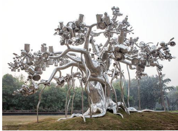
Resim 8. Subodh Gupta. 2014. DaDa National Gallery of Modern.

Subodh Gupta'nın dışında atık günümüzde atık malzemeyle çok daha farklı bir yöntemle çalışan iki sanatçı dikkat çeker. Tim Noble ve Sue Webster; tesadüfen ortaya çıkardıkları gölge heykellerini, atık malzemelerden ilham alarak ortaya çıkarmaya başlamışlardır. İlk başta kendi çöpleriyle çalışmalarına başlayan sanatçılar daha sonra atık malzeme arayışına girmişlerdir.