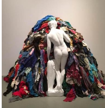
Resim 2. Michelangelo Pistoletto. 1967 Paçavralar İçinde Venüs.

1960'larda doğa ve yaşamın temellerini önemseyen bir grup İtalya'da ortaya çıktı (...) Celant, Arte Povera (Yoksul Sanat) adıyla kaleme aldığı tanıtım yazısında, bitki ve minerallerin yanı sıra sanat arenasında artık canlı hayvanların da yer aldığını belirtiyordu. Sanatçılar doğayı yansıtan imge yaratıcıları değil, doğanın birer parçası olmalıydılar. Sanatçı, gerek zihinsel gerekse ruhsal varlığını yeniden keşfetmek için tıpkı bir simyacı ve büyücü gibi doğal varlıkların kökenlerine inmeli, yeni düzenlemeler yapmalıydı (Yılmaz, 2006: 249).