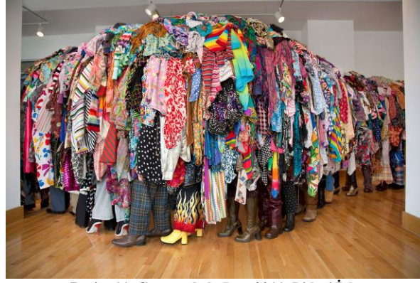
Resim 11. Guerra de la Paz, 2011. Lideri İzle