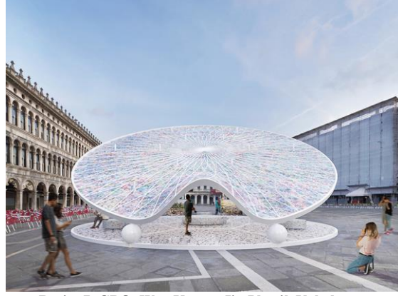
Resim 7. GBO. Woo Kwang Jin Plastik Yakalayıcı.