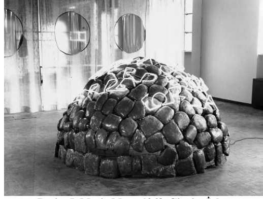
Resim 5. Mario Merz, 1968. Giap'ın İğlosu

Merz, İğlularını Ortaçağda yaşayan İtalyan matematikçisi Leonardo Fibonacci'den öğrendiği bir sayı dizisi ve bundan türeyen sarmaldan yola çıkarak oluşturmuştur. Fibonacci'nin de Araplardan öğrendiği bu sayı dizisi, basit bir toplama işlemine dayanır: 1,2,3,5,8,13,21,34,55,89... diye devam eden bir dizidir bu. Yapılan araştırmalara göre bir daldan çıkan yaprakların ya da daha başka canlıların gelişiminde de (bazen basit bazen de karmaşık olmak üzere) buna benzer matematik orantılar görülebilmektedir. Sarmal belli bir noktadan kıvrılarak çıkan ve sonsuza kadar büyümeye meyilli bir şekil olarak, hem sonsuzluğun hem de mekanın simgesidir. Etkilendiği sayı dizisi ve sarmal, asimetriktir. Bu ise doğanın kendi kendini üretmesinin, çoğaltmasının sırrıdır Merz'e göre (Yılmaz, 2006: 250).