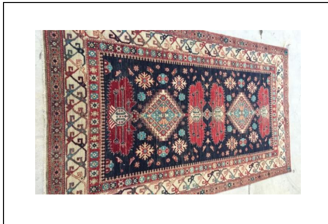
Resim 13. Şirvan Halısı (Kılıç Karatay, 2017)