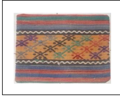
Resim 3. Heybe Dokuması Örneği (Kılıç Karatay, 2016)

İlçede yük taşıma amaçlı olarak heybe çuval dokumaları da vardır. Ancak günümüzde geçmişte yapılmış dokuma örneklerine rastlanmaktadır. Bu dokumalar genellikle tek parçalı olup veya şak denilen iki parçadan oluşan, zeminde motiften ziyade farklı renkten motifler veya şeritlerin yer aldığı görülmektedir.