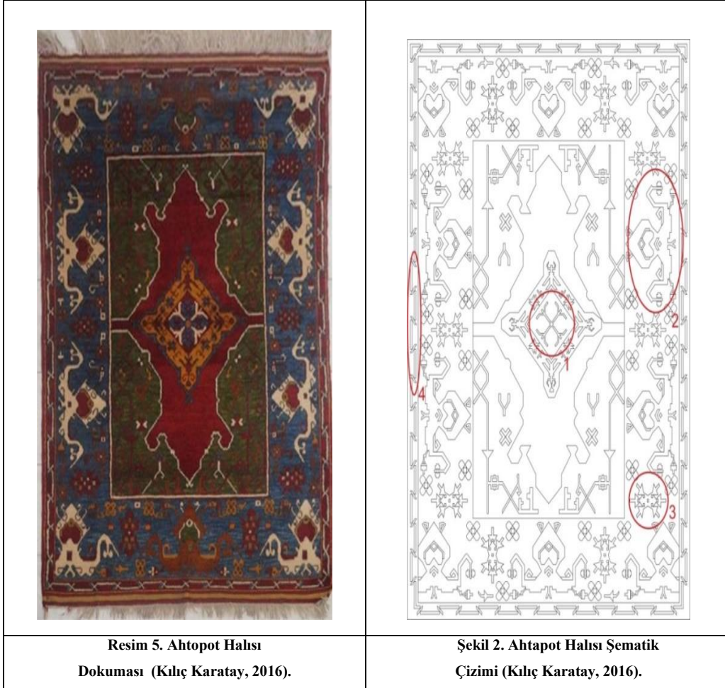
Resim 5. Ahtapot Halısı Dokuması (Kılıç Karatay, 2016).