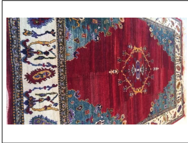
Resim 10. Uşak Halısı Halısı (Kılıç Karatay, 2017)