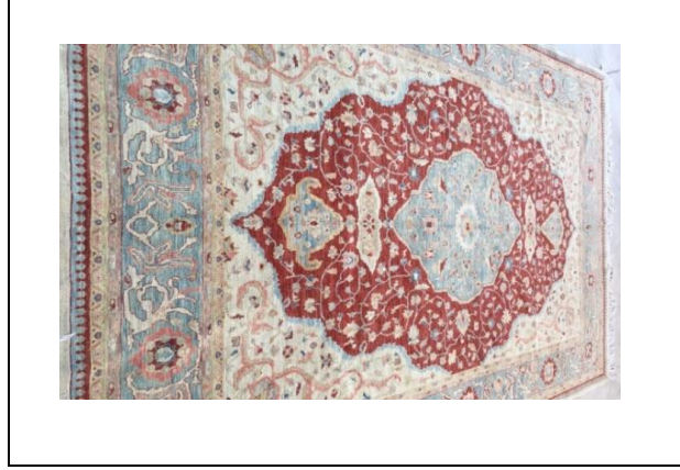
Resim 9. Hacı Celili Halısı (Kılıç Karatay, 2017)