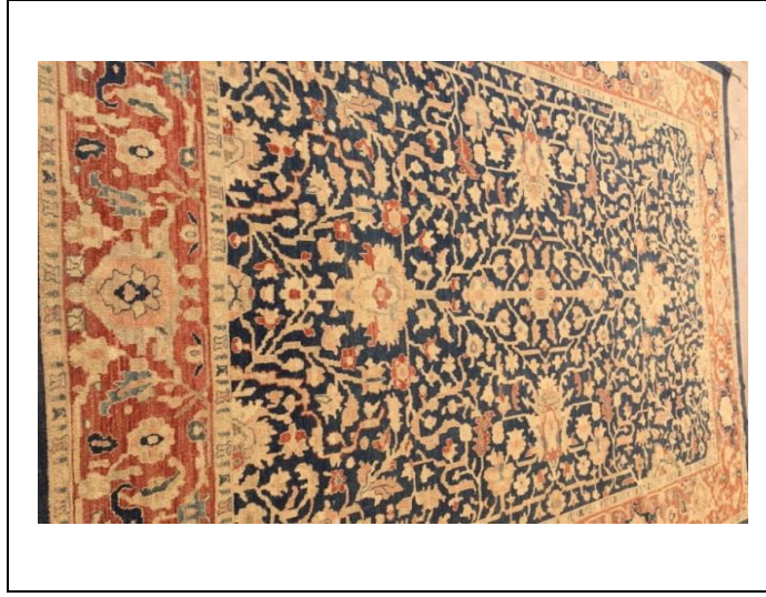
Resim 14. Mahal Halısı (Kılıç Karatay, 2017)