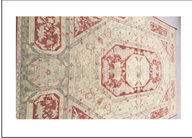
Resim 12. Feshane Halısı (Kılıç Karatay, 2017)