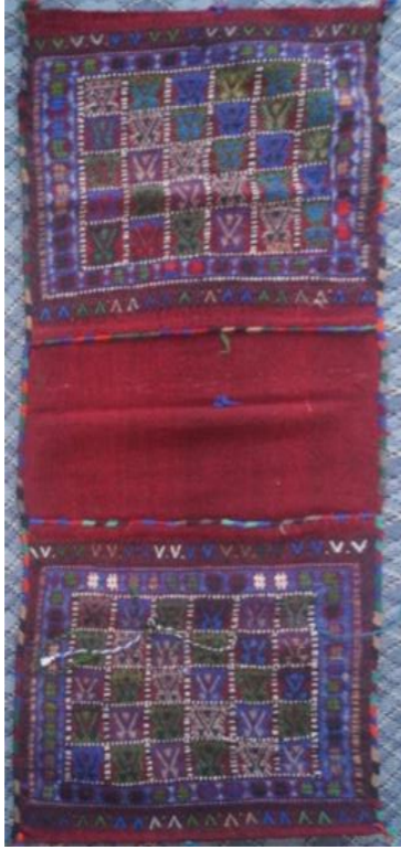
Resim 8. Heybe Dokuması (Kılıç Karatay, 2016).

Krem zemini bölen çerçeveler içinde pıtrak motifi kompozisyona hakim olmuş çerçeve kenarları suyolu motifi ile şeritler halinde bölümlere ayrılmıştır. Dokumanın desen kompozisyonuna hayat ağacı ve pıtrak motifi hakimdir. Şeritler içinde aralıksız olarak hayat ağacı motifi kullanılmıştır.