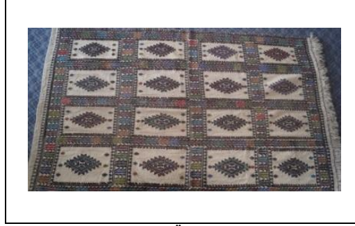
Resim 2. Cicim Dokuması Örneği (Kılıç Karatay, 2016)

İlçede yük taşıma amaçlı olarak heybe çuval dokumaları da vardır. Ancak günümüzde geçmişte yapılmış dokuma örneklerine rastlanmaktadır. Bu dokumalar genellikle tek parçalı olup veya şak denilen iki parçadan oluşan, zeminde motiften ziyade farklı renkten motifler veya şeritlerin yer aldığı görülmektedir.