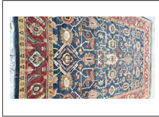
Resim 15. Baksais Halısı (Kılıç Karatay, 2017)