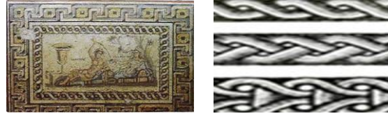
Görsel 2. Örgü Motifi (Anonim, 2011: 66)

Zeugma mozaiklerinin kenarlarını süsleyen çeşitli bordürler bulunmaktadır. Örgü motifi, meander motifi, dişli şerit, dalga motifi, kordela-ribbon motifi ve boncuk dizisi olmak üzere çeşitli isimler almaktadır. Bu çalışmaya esin kaynağı olan örgü motifi tekli ve ikili saç örgüsüdür (Görsel 2). Saç örgüsü motifinde iki şeridin birbiri üzerine sarılarak ilerlemesi üzerine oluşturulmaktadır. Yüzyıllar boyunca, mütevazı görünüşü ile pek çok kültürün sanat eserini çerçeveleyen bu desen, günümüzde de ara suyu olarak kullanılmaktadır (Pekel, 2009; Anonim, 2011).