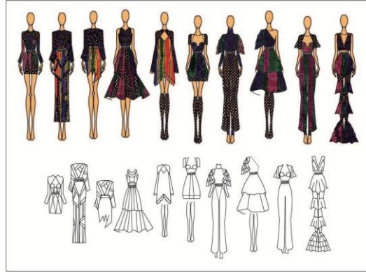
Grsel 3. Hikye Panosu

Tasarımcılar, eskiz alıřmalarını bitirdikten sonra tasarladıkları rnn ll ve detaylı bir izimini yaparak retilmesi iin gerekli her bilgiyi bu izimlerde gstererek retime yardımcı olurlar. Buna bađlı olarak kullanılacak ynteme gre, koleksiyon oluřtururken, kumař ve malzeme seimi ile ya da eskizler ile tasarıma bařlanabilir. Bunları desteklemek zere tasarımda kullanılacak olan konu veya hikyeyi yansıtacak renklerin, malzemelerin, kumařların, sslemelerin ve hedeflenen mřteri kitlesinin gsterildiđi bir hikye panosunun da oluřturulması gerekmektedir. Bu alıřma kapsamında 10 adet eskiz, artistik ve teknik izimi yapılmıştır (Grsel 3). Bu eskiz izimlerinden koleksiyonu en iyi yansıtan 1 adet model seilmiştir. Seilen modelin 4 farklı renk varyasyonu oluřturulmuřtur.