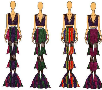
Görsel 4. Koleksiyon parçaları (4 model)

Çağımızda, özellikle son on yıl içerisindeki teknolojik gelişmeler, sanayinin her alanında olduğu gibi, hazır giyim sektöründe de bilgisayar sistemlerinin kullanılmasına geniş olanak sağlanmıştır. El emeğinin yoğun olduğu hazır giyim sektöründe, kişilerin performansına bağlı olarak verimlilik ve kalite faktörleri de değişkenlik gösterir. İş akışı içerisinde insan emeğinin katkısını azaltmak, dolayısıyla daha verimli ve kaliteli bir çalışma ortamı oluşturmak amacıyla, bilgisayar destekli sistemlerin kullanımı yaygınlaşmıştır. Bilgisayarda temel işlem süreci, kullanıcı girdilerinin, bilgisayar tarafından kendine tarif edilen şekilde işlenerek kullanıcıya tekrar sunulmasıdır. Hazır giyim sektöründe; model ve kalıp hazırlama, serileme işlemi, kesim planı hazırlama, kesim gibi dikim öncesi işlemlerle; taşıma, ütüleme ve ambalajlama gibi dikim sonrası işlemler bugün büyük ölçüde bilgisayar destekli tasarım (CAD) ile yapılabilmektedir. Ancak özellikle dikim öncesi işlemlerde sağlanan bu gelişmeler el emeğinden tasarruftan ziyade, sürelerin kısılması, firelerin azalması ve kalitenin artması konularında faydalı olmuştur. Bu çalışmada, AI (Adobe Illustrator) programı kullanılarak dikim öncesi eskiz çizimleri bilgisayar programı ile zenginleştirilerek sunulmuştur (Görsel 4).