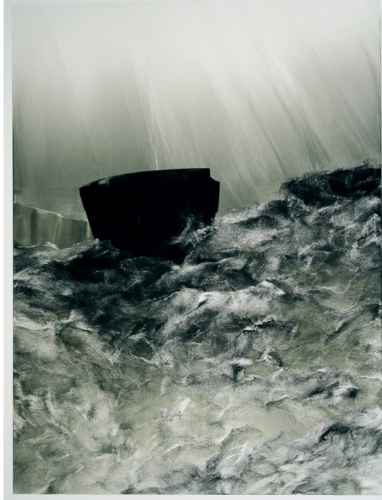
Resim 2 Koichi Yamamoto, Nami, Monobaskı, https://www.yamamotoprintmakin.com/depth

Koichi Yamamoto, monotipi serilerinde ne olduğu tam olarak tanımlanamayan ancak yerçekimi, karanlık ve ışık hissi içeriğiyle gerçeğe göndermeler yapan çalışmalar yapmıştır. Sanatçı monobaskılarında, Dünya'nın farklı