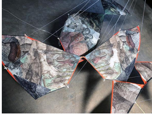
Resim 8 Koichi Yamamoto, Print Kite Projesi Kağıt Katlama, Gampi Kağıdı üzerine bakır plaka ile baskı ve China Colé https://aetherart.com/2019/01/29/koichi-yamamoto/

Koichi Yamamoto, Print Kite Projesi kapsamında dünyanın farklı yerlerindeki mimari ve hava şartlarından yararlanarak uçurtma görüntülerini kayıt altına almıştır. Sanatçı Print Kite Projesi'ndeki eserlerini, atmosferdeki su ve hava akışı ile ilişkilendirmiştir. İzleyicilerin uçurtmalara bakmaları, onları havada gözlemlemeleri, izleyicilerin verdikleri tepkiler ve anlık davranışları, sanatçı için hep merak konusu olmuştur. Yamamoto, uçurtmaların havalandıktan ve gökyüzünde yayıldıktan sonra kendi başlarına, bağımsız olarak değerlendirilmesi gerektiğini düşünmektedir (Kaya, 2020). Sanatçı, Tennessee Üniversitesinde kendisi ile ilgili yapılan bir haberde Print Kite Projesi için " Paylaşmak ve iletişim kurmak bir araç gerektirir. Benim iletişim dilim baskiresim ve araç olarak uçurtma kullanıyorum " (Newsletter, 2017) ifadelerini kullanmıştır.