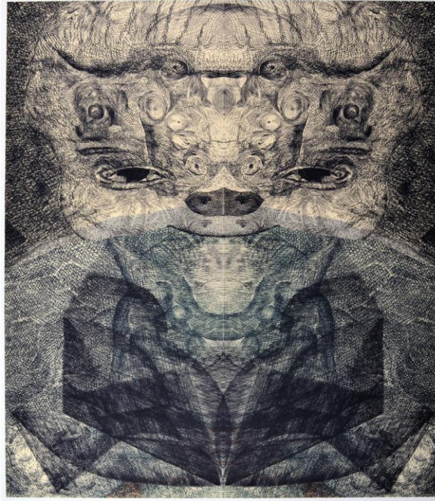
Resim 5 Koichi Yamamoto, Nekomizu Bakır Kalıpla Baskı ve Chine Colé, https://www.yamamotoprintmakin.com/sand-creek

“Bu eserlerin başlıkları Japonca’da yeni bir kelime yaratmak gibidir. Örneğin, Neko bir kedidir ve Mizu görülmez. Nekomizu “görünmeyen bir kedi” anlamına gelir. Önek ve sonek birleştirilerek, yeni bir sözcük oluşturur. Japonca’daki bu uygulama, dilini geliştirmekte çok yaygındır. Dil yaşayan bir şeydir ve kullanım farklılaştıkça sürekli değişmektedir” (Kaya, 2020).