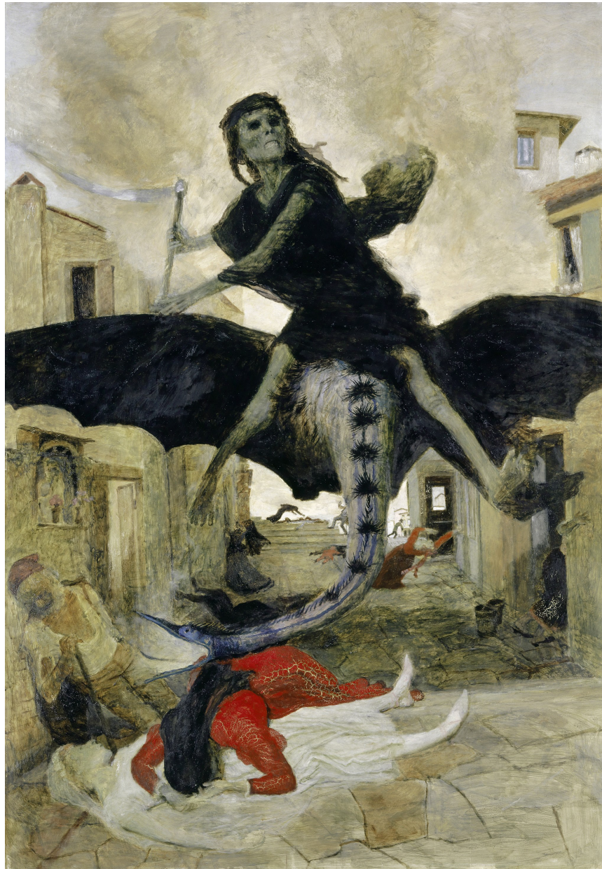
Arnold Böcklin, "Kara Veba", aü tempera, 149.5x104.5 cm, 1898 Basel Sanat Müzesi Koleksiyonu

Yıl 9 - Sayı 67 - 2020 - Volume 9 - Issue 67