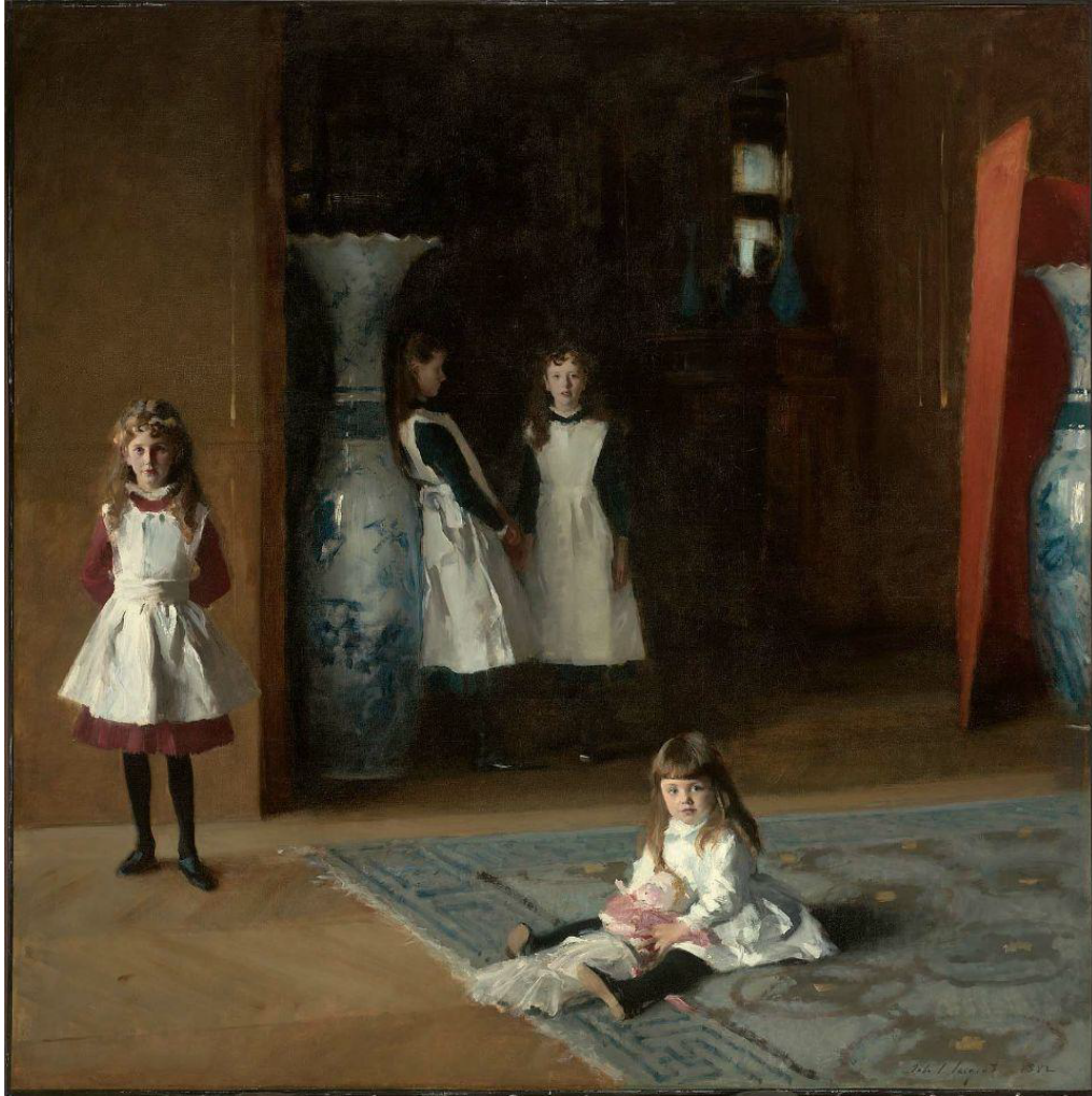
John Singer Sargent, "The Daughters of Edward Darley Boit", t ybu, 222.5 cm x 222.5 cm, 1882, Boston G zel Sanatlar M zesi

Yıl 9 - Sayı 73 - 2020 - Volume 9 - Issue 73