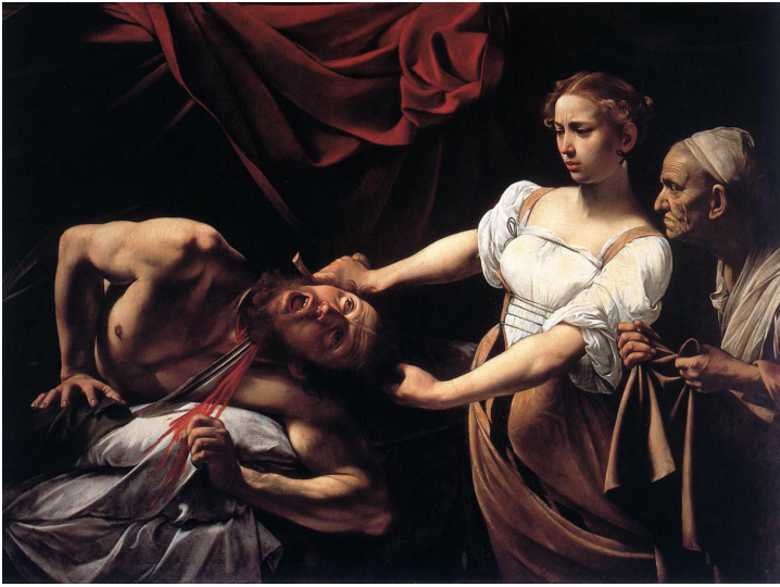
Resim 2. Caravaggio, Judith ve Holofernes,

1598, 144x195 cm, Ulusal Antik Sanat Galerisi, Roma