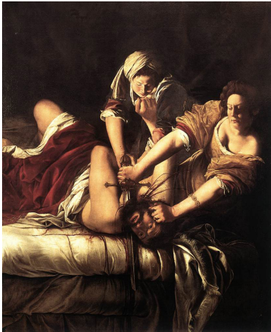
Resim 4. Artemisia Gentileschi, Judith ve Holofernes, 1614-20, 200 x 162,5 cm, Della Uffizi Müzesi, Floransa

Artemisia'nın güçlü bir kompozisyon kurgusuna içerisinde olayın geçtiği mekânı karanlıkta bırakarak derinlik ve gizem katmıştır. Caravaggio'nun üslubunu tıpkı babası gibi kendisi de kullanmış, figürleri resmin yüzeyini zorlarcasına yakından göstererek sahnenin doğallığına ve duygu yoğunluğuna yönelmiştir. Güçlerini birleştiren iki genç kadın sarhoşluktan uyuya kalmış Holofernes'in başını kesmek için saldırmaktadır (Resim 4). Dinsel veya kahramanlıkla ilgili hiçbir endişe taşımadan, nefret duygularıyla hareket eden kararlı iki kadının harcadığı fiziksel çabayı göstermiştir. Ancak kutsal kabul edilen bu öyküyü kendi yaşadığı acı ve nefretle birleştirerek kişiselleştirmesi, resmi apokrif bir konudan uzaklaştırmamıştır.