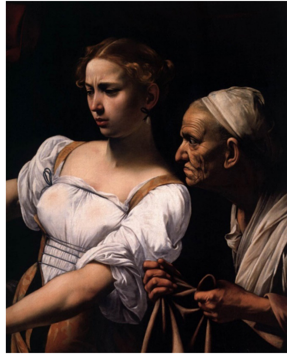
Resim 3. Resim 2 Detay

Böylece Caravaggio, gördüğü tüm Judith resimlerinden başka bir an'ı göstermiştir. Zaten öfkeli, vahşi yaradılışlı, şiddeti sevmesi, sürekli etrafındakilerle kav-