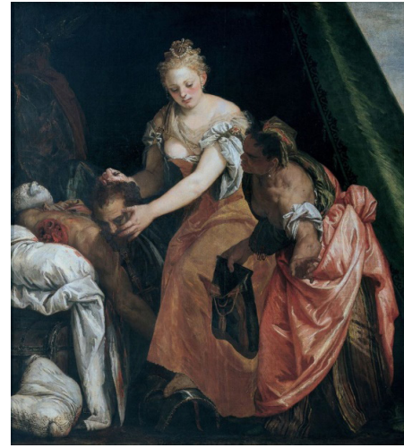
Resim 1. Paolo Veronese, Judith ve Holofernes, 1580, 195x176 cm, Strada Nuova Müzesi, Cenova.

Rönesans ve Yüksek Rönesans resimlerinde şiddet içeren görüntülere sıkça rastlanmadı. Savaş resimlerinde bile şiddet, kan ve zalimlik gibi görüntülere sanatçılar daima ölçülü yaklaşmıştır. Çünkü bu tür konular, Rönesans'ın güzellik anlayışına uygun görüntüler olarak kabul edilmedi. En önemlisi de izleyicide tiksindirici bir