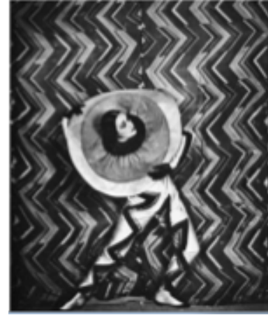
Le'P'tit parigot, Sonia Delaunay- costume designer, 1926

Sonia Delaunay geleneksel kırk pare (patch work) tekniğini modern yaşama kazandırarak yaratıcı çözüm getirmiştir. Bir kadın olarak geleneksel tekstil tekniklerini uygulama becerisi ile bir ressam olarak aldığı sanat eğitimini bir arada kullanması, tekstil tasarımının çağdaş sanatla buluşmasını sağlamıştır.