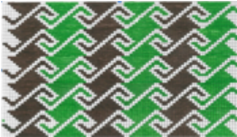
Kaynak:Yıldız,2015 Karacakılavuz Dokumalarının Günümüz Tekstil ve Modasına Uyarlanması,Yüksek Lisans Tezi

Kem göze karşı kullanılan motiftir. İnsanları tehlikelerden korunması inancını ifade eder. Sivri uçları ile kötü bakışları uzaklaştırmanın simgesidir. Nazarla inancı ile alakalı olduğu bilinen bir başka motif ise çengel olarak bilinen motiftir. Bazı yörelerde çakmak, eğri ala, balık, olarak adlandırılır.