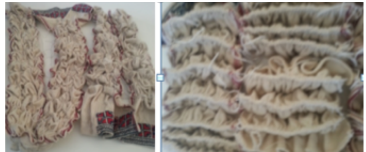
Kaynak : Yıldız,D,Teğelli Batik

Kumaşımızın çepeçevre kenarlarını avcumuzun içinde pili pili toplayıp bağlarız. Böylece kumaşımıza boydan boya bir kenar yapmış oluruz. Yumru halde bir tutam kumaş alıp, orta yerinden sıkıca boğarsak deseni- miz bir güle benzer. Kumaş üzerine attığımız düğümler de o düğüm içerisindeki kısmı boyadan korumaktadır.