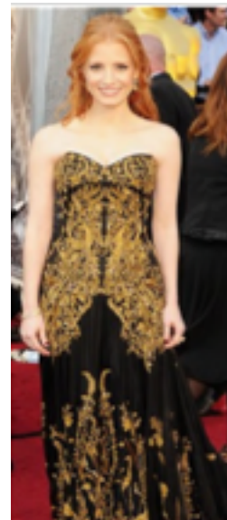
Alexander Mc Queen Tasarımı, Doğu Temalı Gece Elbisesi

Alexander Mc Queen tasarımı doğu temalı gece elbisesi geleneksel temalar ile modern tasarımı bir araya getirmesi tekstil tasarımına çok kültürlü etki yaratmaktadır.