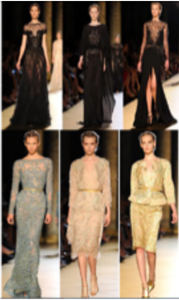
Elie Saab'ın, Osmanlı motiflerinden esinlenerek hazırladığı koleksiyon, Paris Moda Haftası, 2012,

Kaynak. http://www.canada.com/life/fashionshows/couture