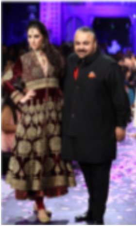
JJ Valaya'nın Hint Kültürü ile Osmanlı Kültürünü birleştirdiği, kumaşlarda Osmanlı motiflerine yer verdiği koleksiyonu, Hindistan Moda Haftası 2012

JJ Valaya Hint kültürü ile Osmanlı Kültürünü birleştirmiştir Kumaşlarda Osmanlı motiflerine yer vermiştir.