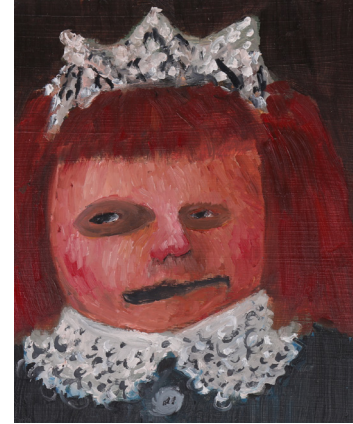
Resim 5. Serkan Çalışkan, “Sokaktaki Prenses”, MDF Üzerine Yağlıboya, 15x20 cm, 2017.

Bir kafede otururken gördüğüm bir çocuk. Ailesi ile okul çıkışı onlar da kafeye gelmişler. İlkokul önlüğü, kafasında bir taç ve inanılmaz huysuz bir çocuktu. Cinsiyet rollerinin ilkokul önlüğü ile tarafımıza dayatıldığı bir üniformadan bahsediyorum. Bir süri trans birey ait olmadığı bedene ait üniformaları giymek zorunda bırakılıyor. Zaten birçoğu da eğitimi yarıda bırakıyor. Bu kadar sembolik bir üniforma ile bizlere dayattığı beden ve cinsiyet algısı yetmez gibi, o kız çocuğu bir prenses tacı takmış. Prenses olmak ne demek? Prenseslik dışında bir yol yok mu kadın olabilir-