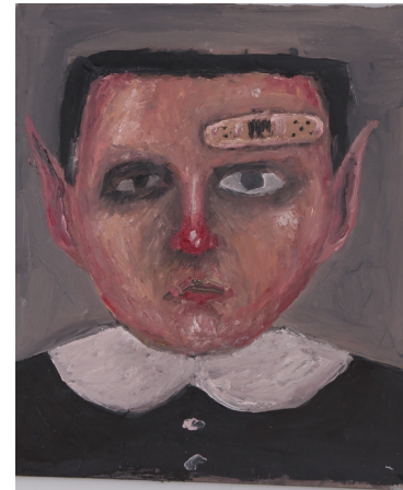
Resim 6. Serkan Çalışkan, “İlkokul Hatırası”, MDF Üzerine Yağlıboya, 15x10 cm, 2017.

mek için? Aslında basit bir andı, sokakta binlerce çocuk onun gibi. Beni de endişelendiren de tam o kısmı. Bedenlerimiz, kimliklerimiz gibi birçok şey başkaları tarafından kurgulanıyor ve sıkıcı olan kısmı da bu” (Çalışkan, 2017:1; Aktaran: Küpçüoğlu, 2017:1 )