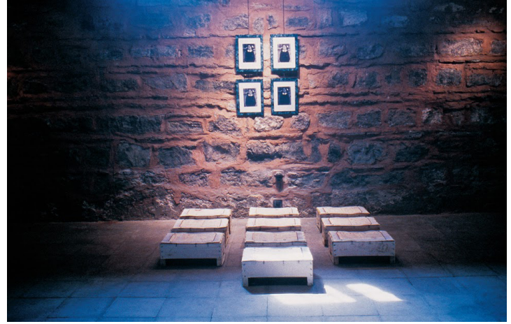
Resim 1. Gülsün Karamustafa, “Okul Defteri”, 4 parça, her biri 24x30cm, 10 parça, her biri 30x42 cm, Kadın Eserleri Kütüphanesi, İstanbul, 1993.

1990'lardan günümüze “Çizim, yazı, dikiş ve işleme gibi yöntemler aracılığıyla, çeşitli yüzeylerin örülmesi şeklinde yeni biçimler” (Antmen, 2014: 137) kazanan resim sanatında, Gülsün Karamustafa (1945) “İllüstratif anlatım ve hazır nesne kullanımı gibi alternatif yaklaşımlar” (Antmen, 2014:137) sergilemekte, bireysel ve toplumsal hafıza, gündelik yaşam gibi olgular üzerine çalışmaktadır. Karamustafa'nın “Okul Defteri” (1993) adlı çalışmasında, okul önlüğü üzerinden birey-