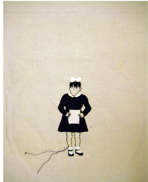
May My Being be a Gift to Myself! - 2009, Acrylic stitching on cloth, 44 x 27 cm

14 Ocak-27 Şubat 2010 tarihinde Artsümer Galerisi'nde gerçekleştirdiği "Lütfen Pisti Boşatınız!" adlı sergide yer alan "Varlığım kendime armağan olsun-I" (2009) adlı çalışmasında, beyaz kurdele, beyaz çoraplar ve beyaz bir kağıt ile bütünleşmiş beyaz yakasıyla birlikte siyah önlüklü bir kız çocuğu görülmektedir. Çocukluğa dair bir anı, bir fotoğraf "Varlığım kendime armağan olsun-I" adıyla karşımızdadır. Artık bir fotoğraf ve bir anı olmaktan çoktan çıkmış, çocukluğa dair bir kimlik sorgulamasına dönüşmüştür. İlkin bu çalışmasını, "Şiir okuyan öğrenci figürü; ulus, din, dil, cinsiyet, beden algısının deneyimlenen değil, ezberletilen birer bilgiye dönüştürüldüğü; öğrenilen bilginin yaşamsal olanla birlikte işlemediği bir eğitim sürecine referans verir. Var olma halinin öğrenilmiş olan kalıplara değil öncelikle