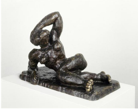
Görsel-11 "The Reclining Nude II"

https://tr.pinterest.com/pin/765682374119410141/?lp=true