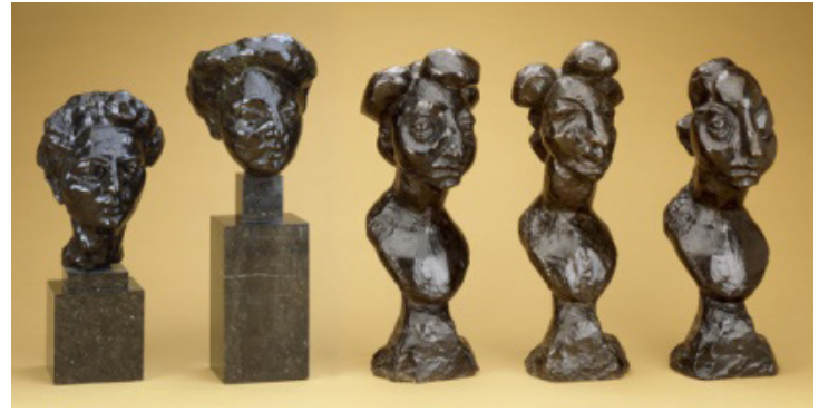
Görsel-9 "Jeannette Head"

Matisse'in rölyef olarak gerçekleştirmiş olduğu "Back" isimli çalışma, heykel ve resim arasındaki bağ kurmasında önemli bir noktada değerlendirilmektedir. Matisse, rölyefin etli ve kabarık tavrı ile resimdeki iki boyutluluk arasında ideal bir basamak olduğunu fark etmiştir. Sanatçı rölyef heykelinde, bedenin kütesel gerçekliğiyle uzamdaki görünümüne dair kazanımlarını ve aynı zamanda insan formunun tuval üzerine nasıl temsil edilebileceği konusunu sorgusunu, bu eserinde açıklığa kavuşturmuştur. Rölyefte temsil edilen kadının heykel ve resmin kendi dünyasına özgü, üç boyutlu gerçeklikle rengin temsilindeki bir noktada konumlandığı ifade edilebilir. Eser ayrıca sanatçının soyuta yöneliminin bariz bir örneği olarak da nitelendirilebilir.