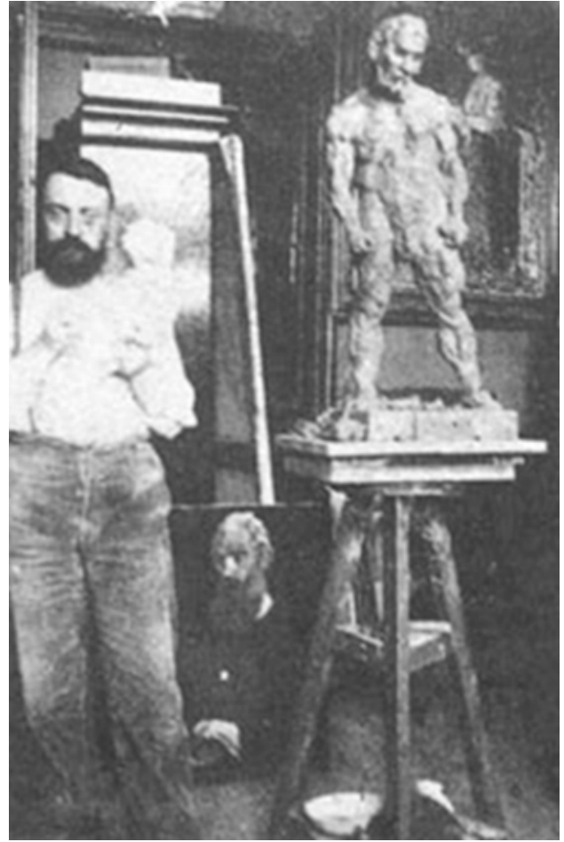
Görsel-4 "Matisse Heykelinin Önünde"

http://www.earthgrow.us/matisse-sculpture-for-really-encourage/henri-matisse