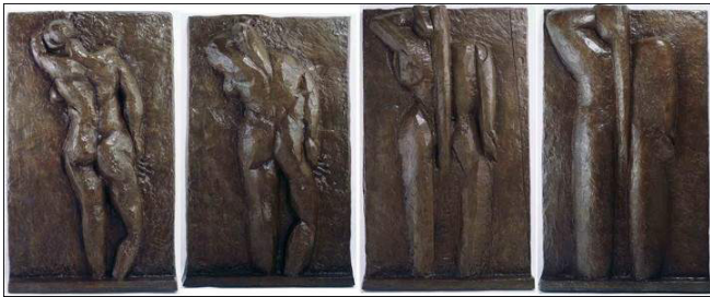
Görsel-8 The four-panel "Back" reliefs

Matisse'nin heykellerinin yarısından fazlası 1900 ve 1910 yılları arasında tamamlanmıştır. Genellikle seri olarak çalıştığı eserlerinde, formu manipüle etmiş ve yıllar içerisinde ifadeye basitleştirilmiş bir yaklaşım benimsemiştir. En tanınmış eserleri arasında, dört Sırt kabartması (1903-31) (Görsel,8), Beş Jeannettehead (1910-16) (Görsel,9) ve Büyük Oturmuş Çıplak (1925-29) (Görsel,6) serileri yer almaktadır.