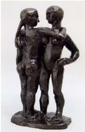
Henri Matisse "Deux Nègresses" 1907-08

20. yüzyılda heykel sanatçıları, tercih ettikleri malzemenin karakterini belirtmek figüratif karakteri olabildiğince değiştirme ve yapısal oluşumu ortaya koyma çabası göstermişlerdir. Figüratif heykel anlayışının sahip olduğu sabitlenmiş duruş, 20. yüzyıl heykelinde zamanın ruhuna uymayan bir tahrik unsuru olarak sanatçıların yaklaşımlarında belirginleşmiştir. Matisse de bu kaygının bir göstergesi olarak, geleneksel anlayıştaki heykel sanatının figüratif eğilimine, yeni ve sıra dışı bir tavır getirmiştir. Matisse, kendi söylemlerinde de ifade ettiği şekliyle, heykele dair uygulamalarında, bir heykel sanatçısının kaygı ve problematiğini tavır olarak ortaya koymasa da, gerçekleştirdiği heykellerinde, sanatı adına sorguladığı nitelikleri anlamlı kılma noktasında büyük bir başarı elde etmiştir.