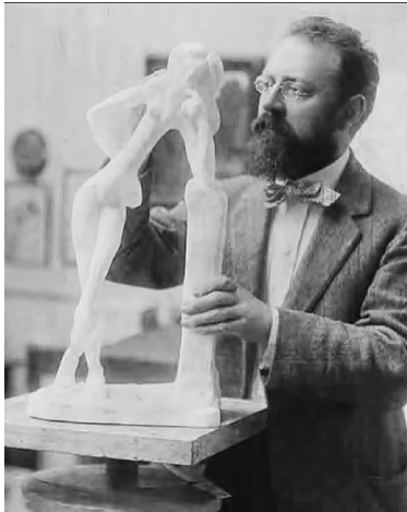
Görsel-3 "Henri Matisse"

Matisse, resimleri, çizimleri ve kâğıt üzerine yaptığı sayısız çalışmaları ile tanınan, aynı zamanda da sıradışı üslubu ile modern sanat tarihine damgasını vurmuş başarılı bir heykeltıraştı. İlk yıllarından itibaren bağımsız bir ifade biçimi olarak heykele ilgisi olan Matisse, resim sanatının problemlerine dair çözümler bulmak için sık sık heykelin üç boyutlu yapısından ilham almıştır (Görsel 3-4).