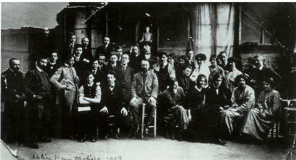
Görsel-12 "Matisse ve Öğrencileri" 1909

Read'e (2001) göre Matisse'in, heykelin temel ilkelerini ne kadar titiz ve duyarlı bir şekilde kavradığı, Paris'te 1908-1911 yılları arasında, bizzat kendisi tarafından yönetilen bir okul olan "Academie Matisse" de (Görsel,12) verdiği derslerde öğrencilerine aktardığı bilgilerden anlaşılmaktadır. Dört temel ilke, Matisse'in sanat anlayışının ifadesini ortaya koymaktadır.