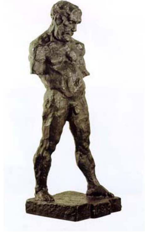
Henri Matisse "Le Serf" 1900-03

https://collections.artsmia.org/art/1890/reclining-nude-ii-henri-matisse