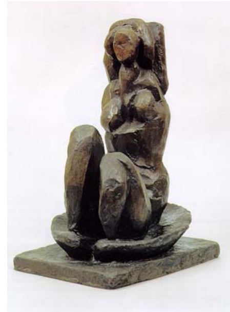
Henri Matisse "Vénus à la coquille II" 1932

http://www.artnet.com/magazine_pre2000/reviews/mcbreen/mcbreen11-19-4.asp