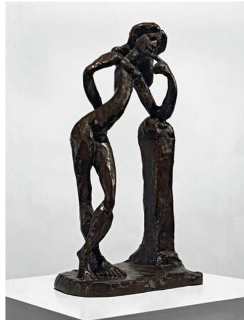
Görsel-7 "La serpentine 1909"

Matisse'nin Avrupa dışı kültürlere olan ilgisi bilinmektedir. 1906 yılından itibaren Afrika kültürüne ait oymaları toplamaya başlamıştır. Afrika heykellerinde gözlemlediği natüralist anlayışla, insan bedeninin daha temel ve fiziksel bir yönüne doğru hareket eden dramatik bir sadeleştirme sürecini benimsemiştir. Afrika sanatının, anatomik açıdan doğru olarak nitelendirilemeyecek heykellerinde, duygunun aktarımına dönük izlenimleri keşfeden Matisse, ilkelcilikten ilham aldığı eserlerinde, sadeleştirme eğiliminde bir tavır benimsemiştir (Görsel,7).