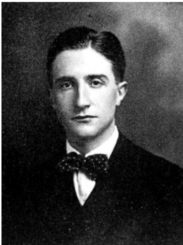
Görsel, 1 "Louis Vauxcelles"