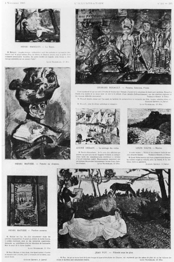
Görsel, 2 "Les Fauves: Exhibition at the Salon d'Automne 1905" http://www.wikiwand.com/en/Salon_d%27Automne

https://lisaaubryblog.wordpress.com/2016/08/02/grande-discussion/louis-vauxcelles/