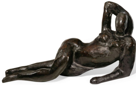
Henri Matisse "Reclining Nude II"

http://www.artnet.com/magazine_pre2000/reviews/mcbreen/mcbreen11-19-3.asp