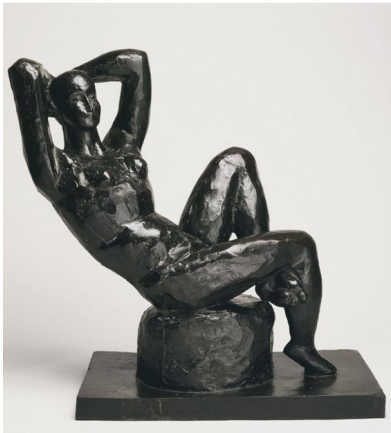
Görsel-6 "Large Seated Nude 1922-29" https://tr.pinterest.com/pin/107242034853631406/

Matisse'in resimleri, rengin kromatik güçleri açısından zarif bir oluşuma yönelmiş olsa da heykelleri açısından durum böyle gözükmemektedir. Gerilim ve mücadele hissi Matisse'nin heykellerinde genel bir karakter olarak belirginleşir. Üç boyutlu form araştırmalarında Matisse'in figüre dair çözümlenmeleri, resimlerindeki devinimin daha ileri bir noktada hareket açısından anlam kazanmasına olanak sağlamıştır.