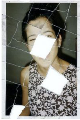
Fotoğraf 2: Joachim Schmid, "Sokaktan Fotoğraflar: No.629", Berlin, Kasım 1999

Örneğin, 1982–2012 tarihleri arasında gerçekleştirdiği "Bilder von der Straße" (Sokaktan Fotoğraflar) isimli projesinde, kamusal alanda bulduğu her türlü fotoğrafı ya da fotoğraftan bir parçayı, nerede ve ne zaman bulduğunu belirten notlarıyla birlikte kronolojik bir sırada yeniden düzenleyerek sergilemiştir (Fot: 1-2). Sanatçının 1986 tarihli "FixFoto" (FotoOnar) isimli çalışması ise, Berlin'de fotoğrafların yapıldığı ve işlendiği bir laboratuvarın önünde bulduğu negatif bir şeritten üretilmiştir (Lumpenfotografie, 2016a).