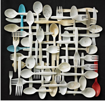
Fotoğraf 7: Barry Rosenthal, "Doğada Bulunan: Çatal Bıçak Kaşık", 2007

çevre kirliliğine dikkat çekmeye çalışmıştır. Rosenthal kendi ifadesiyle zamanının çoğunu diz üstü botları ve eldivenleriyle kumsallarda çöp toplayarak geçirmektedir (Rosenthal, 2015). Bir koleksiyoner duyarlılığında bulduğu çöpleri biriktirmekte ve onları renk, tip ve / veya temaya göre yeniden sınıflandırarak ve düzenleyerek fotoğraflarını çekmektedir.