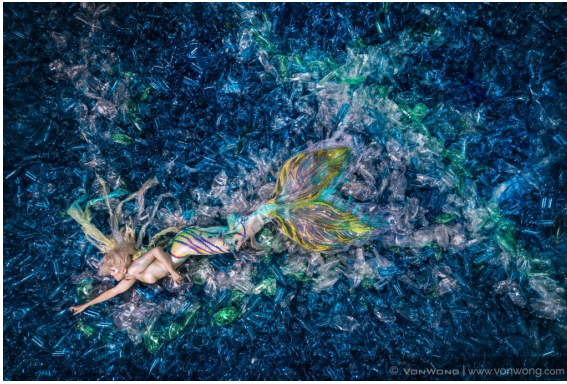
Fotoğraf 11-12: Benjamin Von Wong, "Deniz kızları Plastikten Nefret Eder", 2016

"Ama bunu değiştirebiliriz." diyen Wong, projesi kapsamında "change.org" internet sitesi üzerinden bir kampanya başlatmıştır. Sitede belirtildiği üzere kampanyaya bu güne kadar 16.397 destekçi ulaşmıştır. Wong, sitesi üzerinden izleyici ve destekçilerine şu çağrılarda bulunmuştur: