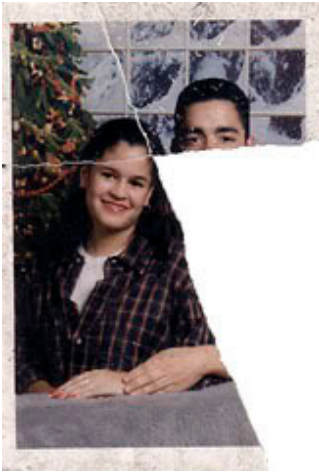
Fotoğraf 1: Joachim Schmid, "Sokaktan Fotoğraflar: No.37", Berlin, Ağustos 1987