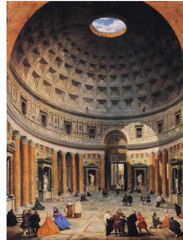
Resim 4. Giovanni Paolo Pannini, "Pantheon'un İçi", 1734, Roma Ulusal Galerisi

Yunanlı sanatçılar dikkatlerini insana, akla ve doğaya çevirmişlerdi, bu ilgileri sanatlarında da açıkça görülmektedir. İnsana ve çevrelerindeki doğaya duydukları hayranlık dolu merak kendini gerçekliğin detaylı incelenmesinde göstermektedir. Öte yandan güzelliğe de tutkuyla bağlıydılar. Bu yüzden gördüklerini idealize ettiler. Klasik Yunan sanatını şekillendiren, doğalcılığın ve idealizmin bu karışımı olmuştur (Hodge 2014: 12).