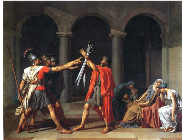
Resim 1. Jacques Louis David "Horace Kardeşlerin Yemini", 1784, t.ü.y., 330x425 cm, Paris, Louvre Müzesi

Baba figürü; kendinden emin, ciddi bir ifadeyle yemin sözcüklerini söylemektedir. Cesur ve atik bir şekilde kollarını kılıçlara uzatan erkek figürleri ise ciddi bir şekilde kılıçlara bakmaktadırlar. Sağ tarafta yer alan kadınların yüzlerinde çaresizlik ve yorgunluk gözlenmektedir. Sağ arka planda yer alan kadın figürünün önündeki çocuklardan yüzü bize dönük olanı şaşkınlık ve korku ile olayı izlemektedir (Resim 1).