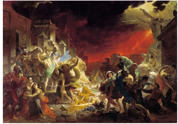
Resim 6. Karl Briullov, "Pompei'nin Son Günü", 1830-1833, Tuval Üzerine Yağlıboya, 465.5x651 cm, Rus Devlet Müzesi, St. Petersburg