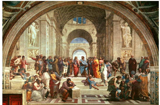
Resim 7. Raffaello Sanzio, "Atina Okulu", 1509-1511, Fresko, Apostolik Sarayı, Vatikan

Raffaello Sanzio'nun "Atina Okulu" (Resim 7) adlı resmindeki mekan anlayışı, Jacques Louis David'in "Horace Kardeşlerin Yemini" adlı resminde kullandığı sütunlu ve kemerli fon görüntüsüne benzemektedir.