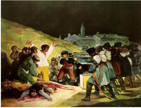
Resim 3: Francisco de Goya "3 Mayıs Katliamı", 1814, t.ü.y., 266x345 cm, Prado Müzesi, Madrid

Fransız İhtilalinin başlangıcından hemen sonra, içinde David'in de rol oynadığı kültür ve sanat mücadeleleri başlar. David'in öncülüğünde toplanan ilerici sanatçılar tarafından sadece Akademi üyelerine tanınan Salon'da sergi açma imtiyazına karşı bir muhalefet hareketi başlatılır. Bunun sonucunda 1791'de Akademi'nin ayrıcalıkları kaldırılır. Bu süreçte müzelerin kurulması ve genişletilmesi faaliyetleri de sanat eğitiminin demokratikleşmesine önemli katkılar sağlamaktadır. Rönesans sanatçılarından Antik Çağ'a öykünerek yeni bir bilgi biçimini ve düşünsel tutumu dışa vurmaları gibi, Neo-Klasik ressamlar da Fransız Devrimi'nin arifesinde yeni bir çağın yolunu hazırlamaktaydılar. Ama bu sanatçılar, Antik Çağ'ı Rönesans sanatçıları gibi taklit etmemiş; onun biçimlerini ve içeriklerini kullanarak o günün yeni, güncel dünya görüşünü ifade etmenin yollarını aramışlardır. David'den iki yaş büyük olan İspanyol ressam Francisco de Goya, Neo-Klasisizm anlayışına hiç prim vermemekte ve bu anlayışın özelliklerini yansıtmamaktadır. Sanatçının "3 Mayıs Katliamı" (Resim 3) adlı eseri en ünlü eseridir.