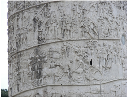
Resim 5. Traianus Sütunu, İ.S. 114, Roma

Yunanlıların sakin ve dinlendirici bir kusursuzluk aramalarına karşın Romalılar zengin ve gösterişli bir etki yaratmak istemişlerdir. Sanat alanında gerçekte kendi yaratıcılıkları olmamıştır. Yunan anlayışını temel alarak kendi gösterişli zevklerini buna eklemişlerdir. Fakat sanat yapıtları için zengin bir pazar ve sanatçılar için geniş bir iş ortamı sağlamışlardır. Ayrıca, sanatın gelişmesini destekleyen kurallar üzerine oturtulmuş bir imparatorluk kurmuşlardır. Romalılar, Yunan mimarisinden işlerine yarayanı almışlar ve aldıklarını değişik gereksinimlere uydurmuşlardır (Gombrich 1986: 82).