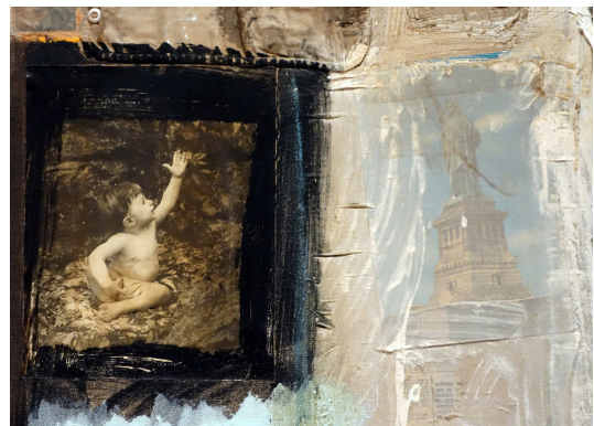
Görsel 3. Robert Rauschenberg, Canyon (detail), 1959