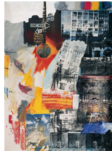
Görsel 5. Robert Rauschenberg, One Way , 1963

Aynı yaklaşımı benimsediği çalışmalardan bir diğeri 1963 tarihinde yapılan One Way (Görsel 5) isimli çalışmadır. Benzer bir yapı söz konusudur, ancak bu