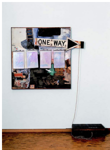
Görsel 4. Robert Rauschenberg, Black Market , 1961

Rauschenberg çalışmalarında yaşam ve ölüm diyalektiğinin anlam kurgusu, açık-koyu karşıtlığı üzerine temellenmiş, ruhsal açıdan karmaşık bir izlenim yaratırken, detaylar incelendiğinde karmaşık kompozisyon sisteminden çıkış yolunun da kendi içinde verilmiş olduğu gözlemlenmiştir. Bunun yanında Rauschenberg çalışmalarında ölüm ve yabancılaşma kavramlarının yorumsal olarak çıkartılabileceği diğer bir biçimsel kurgu, 1960'lı yıllarda ortaya koyduğu sokak tabelaları ve kolaj tekniğinden yararlandığı bir dizi çalışmadır.