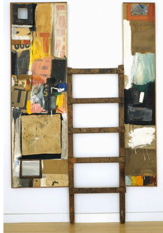
Görsel 6. Robert Rauschenberg, Pilgrim, 1960 / Görsel 7. Robert Rauschenberg, Winter Pool, 1959

Rauschenberg aynı yıllarda resimlerin önüne ve yanına yerleştirdiği/monte ettiği nesnelere üç boyutlu kompozisyonlar da oluşturmuştur. Pilgrim isimli çalışması (Görsel 6) tıpkı Black Market (Görsel 4)’te olduğu gibi mekansal bir yerleştirmeyi de kendi kurgusal gerçekliği içine yerleştirmiştir. Resmin sağ yüzeyinde yer alan kırmızı leke bu kez kan olgusuna gönderme yaparak ölümü temsil ederken, sandalye