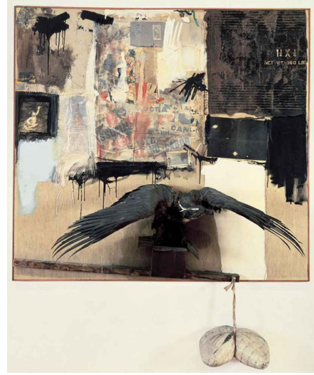
Görsel 1. Robert Rauschenberg, Canyon, 1959, 207.6 x 177.8 x 61 cm (The Museum of Modern Art)

ve soyut gibi tanımlamalar içerisinde sürekli değişen bir yapıya dönüşmüştür. Bu nedenle; "Rauschenberg'in çalışmalarındaki görüntüler belli anlamlara gönderme yaparlar. Ama sistematik bir ikonografi oluşturmazlar. Rauschenberg'in çalışmalarındaki her bir görüntünün olası çağrışımlarının çokluğu, kişinin tek tek unsurları aynı anda çok farklı şekillerde okumasına olanak tanır" (2014: 168). Bu araştırma da bu farklı okumalardan birinin peşinden ilerleyerek Rauschenberg'in çalışmalarına yeni bir bakış açısı sunmayı amaçlamaktadır.