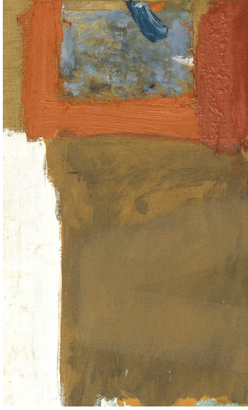
Görsel 9-10. Robert Rauschenberg, Winter Pool (detail), 1959

Ayrıntılar incelendiğinde de görülebildiği gibi (Görsel 8-9-10), resim bütünsel olarak iki parçadan oluşsa da rastgele seçilen ayrıntılar içerisinde aslında onlarca parçalanma ve geometrik yüzey yapılanması vardır. Bunlar yaşam karşısında bireyin seçim yapması gereken seçenekler olarak düşünebildiği gibi, ölüm ve yaşam arasında sıkışmış bir bireyin ruhsal dünyasının da göstergeleri olabilir. Kimi parçalanmalar olabildiğince renk değerleri azaltılarak resim düzlemine yerleştirilmiş olsa da, kimi bölüntülerin de olabildiğince renkli ve canlı bir sürece gönderme yaptığı anlaşılmaktadır (Görsel 11-12). Bu yönüyle de aslında yaşamın iki karşıt kutbuna ve başkalaşım ve ötekileşme kavramlarına gönderme yaptığı varsayımsal olarak ulaşılmaktadır.