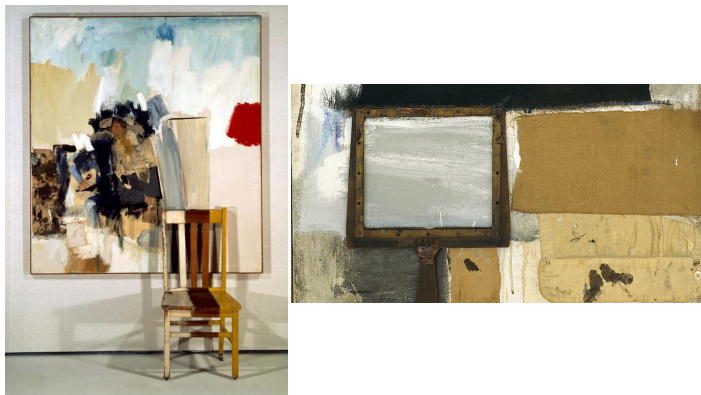
Görsel 11-12. Robert Rauschenberg, Winter Pool (detail), 1959

Ayrıntılar incelendiğinde de görülebildiği gibi (Görsel 8-9-10), resim bütünsel olarak iki parçadan oluşsa da rastgele seçilen ayrıntılar içerisinde aslında onlarca parçalanma ve geometrik yüzey yapılanması vardır. Bunlar yaşam karşısında bireyin seçim yapması gereken seçenekler olarak düşünebildiği gibi, ölüm ve yaşam arasında sıkışmış bir bireyin ruhsal dünyasının da göstergeleri olabilir. Kimi parçalanmalar olabildiğince renk değerleri azaltılarak resim düzlemine yerleştirilmiş olsa da, kimi bölüntülerin de olabildiğince renkli ve canlı bir sürece gönderme yaptığı anlaşılmaktadır (Görsel 11-12). Bu yönüyle de aslında yaşamın iki karşıt kutbuna ve başkalaşım ve ötekileşme kavramlarına gönderme yaptığı varsayımsal olarak ulaşılmaktadır.