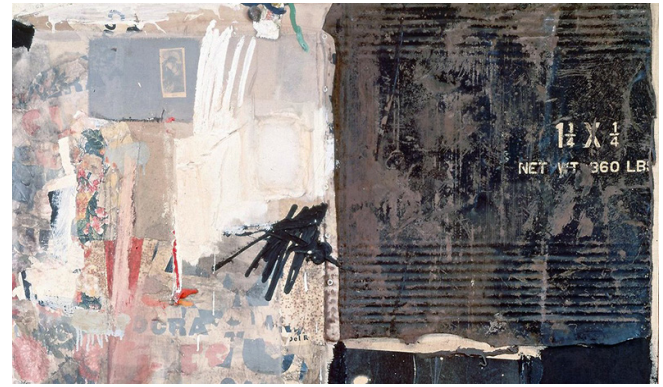
Görsel 2. Robert Rauschenberg, Canyon (detail), 1959