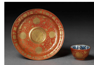
Resim 6. Japonya, Eiraku atölyesi yapımı kinrande porselenler, 1827-1850, Metropolitan Müzesi.

Eiraku ailesi de, geçmişte kinrande yapımı konusunda ustalaşmış olan Japon ailelerinden biri olmuştur.