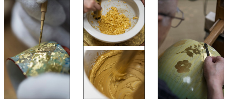
Resim 5. Japonya, Kinzangama fırını, farklı yöntemlerle altın hazırlama.

Kinrandeler arasında, çok hassas kırmızı sırüstü üzerine altın süsleme uygulanan eserler "akae-kinrande" olarak adlandırılır. Kutani-yaki ustası Kutani Shoza, Meiji döneminin başında batılı boyaları geleneksel sıraltı uyarlamayı başardı. Batı boyaları, altın süsleme ve sırüstü boyamalardan oluşan kombine bir tarza "Saishoku Kinrande" veya çok renkli altın boyama deniyordu ve bu, Meiji döneminden beri Kutani ürünlerinin ana tekniklerinden biri haline geldi. Kinrandelerin; altın boya ile çizgisel dekorlar için 'kin-kaki', altın tozu püskürtmek için 'kin-furi' ve altın yaprak yapıştırmak için 'kin-hari' gibi bazı varyasyonları vardır ( kinzangama.com ).