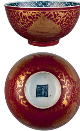
Resim 2. Ming Hanedanlığı döneminde üretilmiş kinrande stilinde porselen kase, 16. yüzyıl, British Museum.

Çin’de, Ming Hanedanlığı’nın ortalarına tarihlenen kinrande porselenler, özellikle Jiaping dönemi boyunca (1522-1566) yoğun olarak üretilmiştir. Japon pazarının hedef alındığı üretimlerde, kinran kumaşların renkleri taklit edilmiş, porselenlerin renkli yüzeylerine altın ışıkları eklenmiştir.