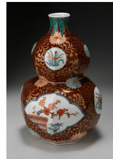
Resim 9. Japonya, Akaji kinrande stilinde İmari porseleni, 1868-1880, Museums Victoria.

Kinrande stili dekor tekniği, Japonya'da İmari, Arita, Nabeshima ve Kutani seramikleri üzerinde görülmekte, bu seramiklerin özgün renk ve dekor özelliklerine ek olarak uygulanmış kinrande dekorlar da parçalar üzerinde bir arada kullanılabilir.