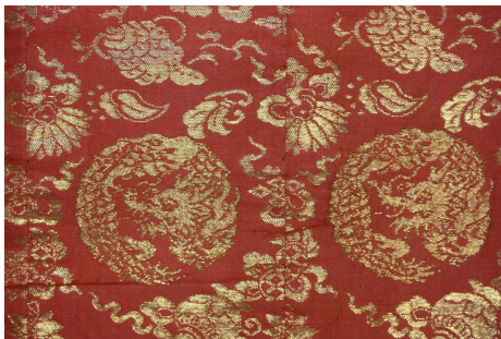
Resim 1. Japon Edo Dönemi, kinran dokuma kumaş.

Kinran, ‘parlak altın’ veya ‘altın brokar’ anlamına gelmektedir (www.metmuseum.org).