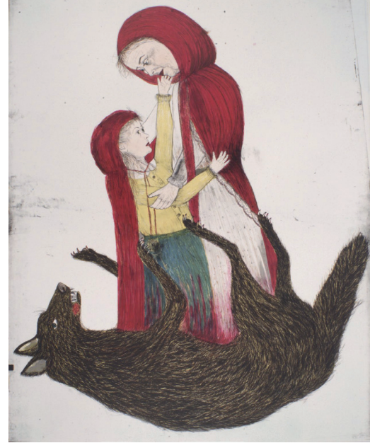
Resim 6: Kiki Smith, Doğum, 2002, Renkli Litografi Baskı, 172,7 x 142,2 cm

aynı kıyafeti giymesi, küçük kızın yaşlı kadınla benzerlik kurmasını sağlarken, çocukluktan kadınlığa dönüşümü, bedeninin geçirdiği değişim sembolize edilir. Birbirine bakarken ve dokunurken görülen iki kadını ve aradaki zaman kavramı da vurgulanır. Burada doğum; olgunluğa erişmek, dönüşmek, yeniden canlanmak anlamında yorumlanmalıdır.