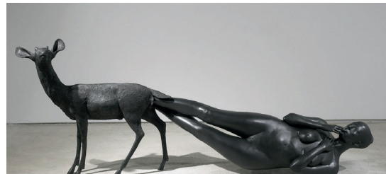
Resim 7: Kiki Smith, Doğum, 2002, bronz heykel