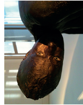
Resim 2: Lilith (detay), bronz ve cam

Yapıt duvarda çömelmiş olarak baş aşağı yerleştirilmiş, korkutucu bakışlarını izleyiciye yöneltmiştir. İzleyiciye yukardan bakan Lilith adeta onu gözetler, bakışlarıyla bir yandan irkiltirken bir yandan da cesaretlendirir. Öyküde erkeğe karşı gelen kadın cezalandırılır ve ardından kötü kadın olarak adlandırılıp yok sayılır. Smith'in yapıtında ise yok sayılan bu kadın imgesi vü-