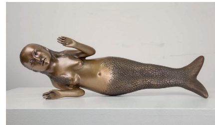
Resim 4: Anne, 2013, Bronz 15,2 x 50,8 x 7,6 cm

Anne heykelinde (Resim 4) tüm dünya kültürlerinde yer edinmiş mitolojik kadın figürü olan Denizkızı görülür. Anne kavramının temsil eden belden aşağısı balık olan bu kadın figür fedakârlığın, teslimiyetin, kurban olmanın sembolüdür. Fedakârlık kavramıyla ilişkilendirilen denizkızı, ayrıca denizcileri aldatan, onların boğulmasını sağlayan baştan çıkarıcı bir canavar olarak da tasvir edilir. Bu sembolün çok anlamlılığı durumuna işaret eder. "Aynı olayın değişik insanlarda değişik duygulara yol açması gibi, aynı sembolün de yerine göre değişik anlamlara gelmesi kaçınılmazdır." (Fromm, 1992: 33) Sanatçının bu çalışmasıyla fedakârlık, teslimiyet gibi duygu ve düşünceleri çağrıştırdığı düşünülür. Yapıtın adı, figürün yüz ifadesi ve özellikle iki elin teslim olma işareti yapar gibi havaya kalkması bu hissiyatı güçlendirir. Ayrıca sanatçının bu yapıtta bronz gibi ağır bir malzemeyi seçmesi, altın varak rengi, olgunluk ve kutsallık gibi çağrışımlar yaratarak yapıtın sembolize ettiği 'anne' kavramını güçlendirmiştir.