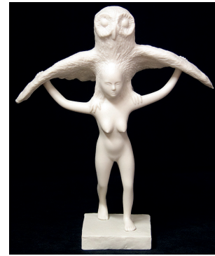
Resim 9: Kiki Smith, Kuşlu Kız, 2004, porselen

Baykuşlu Kız (Resim 9) heykelinde ise kuş başlı tanrıça tasvir geleneğini yeniden yorumlandığı görülür. Tarih öncesi çağlara bakıldığında kuş başlı ya da kuş bedenli ve kadın başlı tanrıça motiflerine sıklıkla rastlanır. Kadın tanrıçalar kutsallığı, bilgeliği; tanrısal korkuyu sembolize eden baykuşla, büyük kanatlı kuşlarla bir arada betimlenmiştir. Baykuş birçok mitolojide ölümü simgeler. Amerikan mitolojisinde de ölümü simgeleyen baykuş, aynı zamanda ölüm sonrası dönüşümü imgeler. Geceleri yaşayan, karanlıkla ve ölümle ilişkilendirilen bu kuş, karanlığın içinden yeniden doğumun yeniden canlanmanın ve hayatın sembolü olarak görülür. "Tanrıların hayat vermesi doğurması gibi, O ayrıca devamlı hayatı yok eder ve hayatın yenilemesine sebep olur." (Ronnberg ve Francesca 2010: 254)