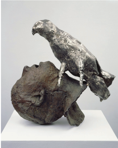
Resim 8: Kiki Smith, Kuşlu Kafa, 1994, bronz

Bana göre, doğumla ilgili şeyler yapmak, birinin doğurma yeteneğine sahip olmaktan ziyade kendini doğurması gerçeğiyle ilgilidir. Bu tamamen farklı bir şeydir aslında. Herkes doğdu. Bu dünyaya bu şekilde ulaştı ve bu aynı zamanda hayatımızı canlı kılmak için tekrar tekrar ve tekrar devam etmeniz gereken bir şeydir - bir Anka kuşu gibi olmak, yeni bir şey yaratmak ya da yaşamımızın varlığını yenilemek (McCormick, Jca-on-line).