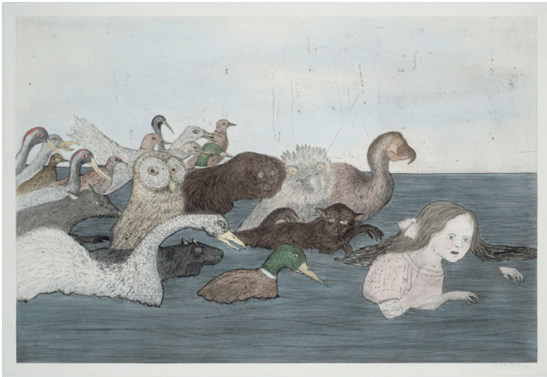
Resim 5: Kiki Smith, Gözyaşı Havuzu II (Lewis Carroll'dan sonra), 2000 renkli litografi baskı