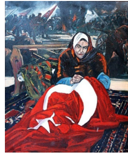
Resim 5. Mehmet Başbuğ: Şehidin Son Örtüsü

Kurtuluş Savaşı resimleri deyince ilk akla gelen ressamın başında şüphesiz Mehmet Başbuğ gelmektedir. Başbuğ'un yaptığı savaş resimlerinin içinde kadınların öne çıktığı resimler Türk kadınının alp yönünü göstermesi açısından önemlidir. "Şehidin Son Örtüsü" bu resimlerden biridir. Resmin tamamına koyu renkler hâkimken ön tarafta bulunan bayrak ve üzerindeki ay-yıldız bu koyuluğu dengelemektedir. Ön tarafta geleneksel kıyafetleriyle bir kadın Türk bayrağı dikmektedir. Bu, geleneklere göre şehitlerin son örtüsü olan bayraktır. Kadın, altındaki kilim ve arkasındaki beşik ile arkadaki cephe görüntüsü farklı mekânlardır. Bu kurgusal anlatım savaş, bayrak ve şehadet arasındaki ilişkiyi kuvvetlendirmekte oldukça başarılıdır. Kadın kocasını cepheye göndermiş, derin bir metanetle şehide son örtüsünü hazırlamaktadır. Arkada savaşın en çetin zamanını gösteren bir sahne resmedilmiştir.