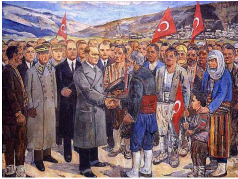
Resim 9. Ruhi Arel: (1930) Atatürk Köylülerle.

Yine Şeref Akdik'in "Halk Mektebi" adlı çalışması da eğitim alanında mücadele eden alp kadının resmedildiği bir çalışmadır. İlginç bir ayrıntı ise kadının kucağındaki küçük çocuktur. Alp Türk kadını cephede düşmanla savaşırken de okulda cehaletle savaşırken de çocuğunu yanından ayırmamıştır. Bu durum Türk destanlarındaki "ideal eş ideal anne" tipiyle paralellik göstermektedir.