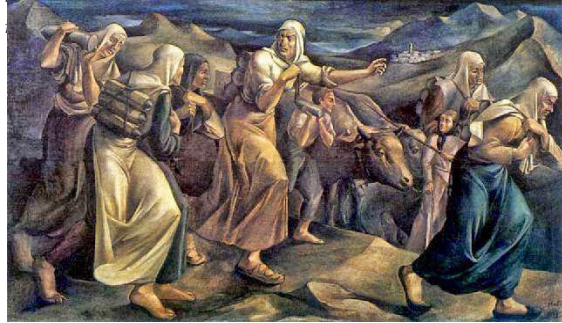
Resim 1. Halil Dikmen: (1933) Cephane Taşıyan Köylü Kadınlar.

Uzamanın göstergeleri tepeler, koyu gri gökyüzü, çorak arazidir... Arka planda tepelerin arasında bir köy görünmektedir. Köyde dikkat çeken betilerden biri,