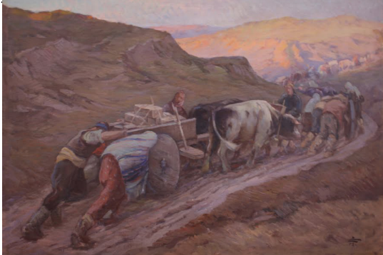
Resim 2. Sami Yetik: (1917) Cephane Taşıyan Köylüler.

Savaş ortamında olması iffetinden bir şey eksiltmez ya da koşulların imkânsızlığı yıldırılmaz onu. Dede Korkut’un Burla Hatunu’dur Yetik’in resmettiği Alp Kadın: Yiğit, iffetli ve fedakâr. Kan Turalı’ya: “Big yiğit baş esen olsa börk bulunmaz mı olur, bu gelen kâfir çok kafirdür, şavaşalum, döğişelüm, ölenümüz ölsün, diri kalanumuz odaya gelsün” (Ergin 1989: 194) diyen Selcen Hatun’u görürüz Yetik’in resminde. Hem kağnyının arkasındadır savaşçı kadın hem önünde, hem erkeğinin yanındadır hem ondan bağımsız. Uzayıp giden ve sonra dağların arasında kaybolan kalabalığın her yerindedir. Göçebe step kültürü Alp Kadın’ı nasıl kavurur ve hayata hazırlarsa işgale uğramış bir Anadolu’da Şerife Bacı’yı, Kara Fatma’yı, Nezahat Onbası’yı Alp Kadın’lığa hazırlar.