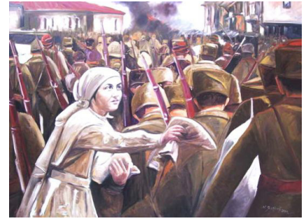
Resim 6. Mehmet Başbuğ: (2004)

Bu sahnedeki dehşet ve hareketliliğe karşın ön taraftaki durgunluk ve huzur tezat gibi görünse de bu durum alp kadınının metanetini en güzel şekilde yansıtmaktadır. Ön taraftaki sahne Manas'ın ölümünden sonra dul kalan Kanıkey ve oğlu Semetey'i hatırlatırken, arkadaki sahne Manas'ın türbesinin üzerindeki savaş sahnesi resimlerini akla getirmektedir. Bu resimler Semetey'in, babası Manas'ın kahramanlıklarını öğrenmesi için Kanıkey tarafından yaptırılmıştı. Bir başka Başbuğ resminde Alp kadını, şehre giren askerlere bir şeyler uzatırken görüyoruz. Resmin en ön kısmında yer alan kadın, elbisesinden anlaşıldığı kadarıyla Hilal-i Ahmer'de görevli bir kadındır. Elinde azık benzeri bir bezi askerlere uzatmaktadır. Resmin en uzak noktasında yükselen alevler bir mücadele sonucu şehrin düşman elinden alındığını gösterir gibidir. Resmedilen askerlerin büyük bir çoğunluğunun çetin bir mücadeleden çıktığı, askerlerin yorgun hallerinden anlaşılıyor. Başbuğ'un resmindeki bu Alp kadını, Manas Destanında Madıkan ile yapılan korkunç savaşta yorgun düşen manas ve askerlerine yardım eden Kanıkey misalidir.