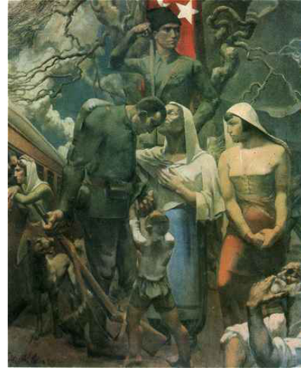
Resim 3. Abidin Elderoğlu: (1935) Ayrılış.

Ayrıca Talas’a gitmek isteyen oğlu Semetey’e Kanıkey, yolda karşılaştığı çölleri, tepeleri, ırmakları, babasının silahlarını anlatmak kaydıyla tavsiyelerde bulunmuş ve Semetey’in Talas’a kısa yoldan ve güvenli bir şekilde ulaşmasını sağlamıştır. Talas’a ulaşan Semetey için, onu öldürmek isteyen Cakıp Han, Abeke’ye: “Anası Kanıkey onu hazırlamış, ona çok şeyler öğretmiş... (İnan, 1992, s. 144’ten aktaran Akyüz, 2010: 175) demiştir.