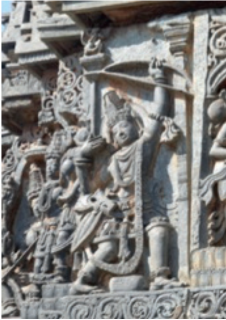
Resim 24. Rama, Halebidu Tapınağı M.S 1121, Karnataka