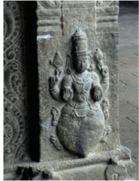
Resim 12. Kurma Rölyefi, Srirangam Temple, Tamil Nadu, M.Ö.3.yy

Vişnu'nun ikinci Avatarıdır. İblislerin ölümsüzlük nektarını elde etmek için okyanustaki Mandara Dağını çalkalaması nedeniyle dağ okyanusun dibine doğru gömülmeye başlamıştır. Dağı tekrar yüzeye çıkararak canlıları kurtarmak için Vişnu, Kaplumbağa Avatarı şeklini alarak dünyaya gelmiştir. Okyanusa gömülen dağı sırtında yüzeye çıkararak insanları kurtarır. Vişnu'nun bu formda gelmesinin büyük selden sonra kaybolan bazı varlıkları kurtarmak amacıyla olduğu da belirtilmektedir. En önemli rol aldığı hikayesi, tanrıların, ilk selden sonra denizden ambrisa (ölümsüzlük suyu) yapmasıdır. Kurma, erkek torsosu ve alt beden kaplumbağa olarak tasvir edilir. Sembolleri; kabuk, çark, lotus ve asadır. Ayrıca, çeşitli tanrılar için araçtır. Kurma'nın hem suda hem havada nefes alma becerisi geliştiren bir canlı olması, yaşamın gelişiminde ki aşamayı gösterir. Kaplumbağanın kabuğuna çekilmesi, meditasyonu işaret eder; insanın kendi iç dünyasında yaşaması soyutlanmasını ifade eder (Chandra, 2001:194). Kurma heykelinin örneği, Resim 12'de Tamil Nadu bölgesinde yer alan Srirangam Tapınağındandır.