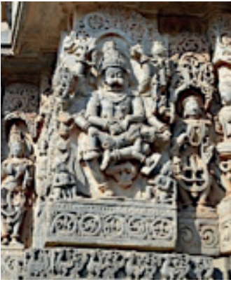
Resim 19. Narasimha Heykeli, Chennakeshava Tapınağı, M.S. 1108-1152 Karnataka