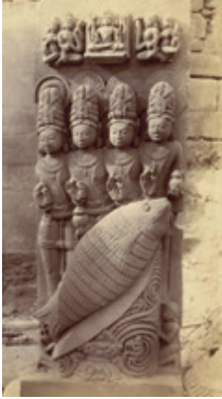
Resim 10. Vişnu'nun Balık enkarnasyonu ,Allahabad, Fotoğraf Joseph David Beglar 1875

Matsya, genellikle erkek torsu ve balık bedeni ile tasvir edilir. Ellerinde çark, silindir taşır. Yarı insan yarı balık hibrit bir formla tasvir edilir. Resim 10'da balık formunda tasvir edilmiş olan Matsya, Resim'11 de, hibrit formda tasvir edilmiştir.