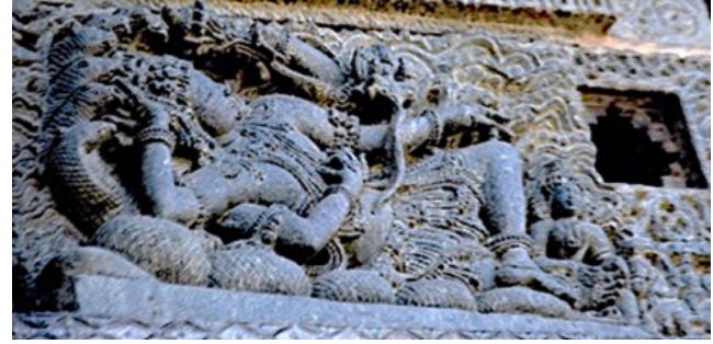
Resim 1. Vişnu, Sesanın kıvrımları üzerinde uyurken, Chennakeshava Tapınağı, M.S. 1108-1152 Karnataka