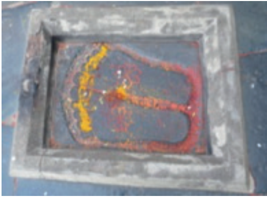
Resim 8. Vişnu Ayak izleri, Chennakeshava Tapınağı, M.S. 1108-1152 Karnataka

Tapınaklarda şematik olarak, Vişnu'nun ayak izleri de çizilip ona da çiçekler ve hediyeler sunulmaktadır (Resim 8).