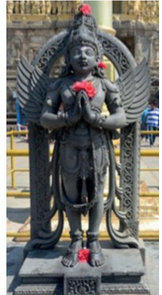
Resim 6. Garuda Heykeli, Chennakeshava Tapınağı, M.S. 1108-1152 Karnataka

Vişnu'nun tapınaklarda yer alan heykelleri, tapınak ana binası dışında daha küçük bir yapı içerisinde özel bir alanda ayakta sembollerini tutarken yer alır. Resim 7'de görülen örnek, bu anlamda yapılmış en tanınabilen örnektir.