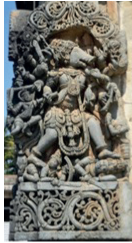
Resim 14. Vişnu, Garuda, Lakşimi, Halebidu Tapınağı M.S 1121, Karnataka