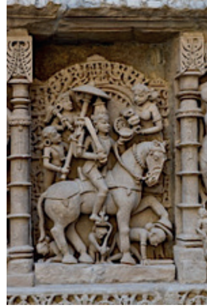
Resim 29. Kalki, 11. yy Queen Stepwell, Patan, Gujarat