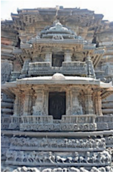
Resim 7. Vişnu Heykeli, Chennakeshava Tapınağı, M.S. 1108-1152 Karnataka

Tapınaklarda şematik olarak, Vişnu'nun ayak izleri de çizilip ona da çiçekler ve hediyeler sunulmaktadır (Resim 8).