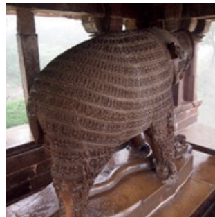
Resim 16, 17. Varaha, Khajuraho, Lakshmana Tapınağı, M.S. 1 yy Madta Paradesh Eyaleti