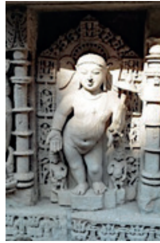
Resim 21. Vamana 11. Yy Queen Stepwell, Patan, Gujarat