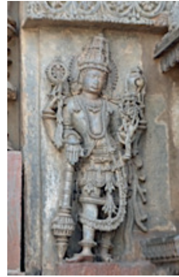
Resim 2. Vişnu, Chennakeshava Tapınağı, M.S. 1108-1152 Karnataka