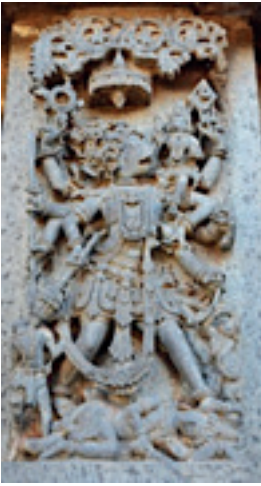
Resim 13. Chennakeshava Tapınağı, M.S. 1108-1152 Karnataka