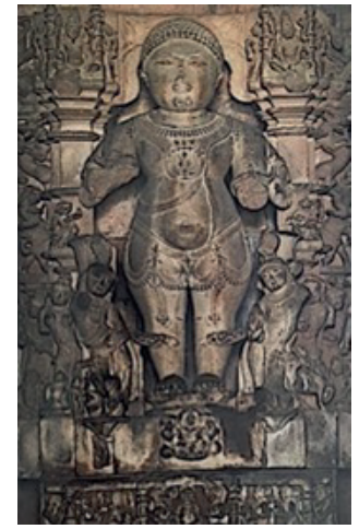
Resim 22. Vamana, Khajuraho, Lakshmana Tapınağı, M.S. 11yy Madta Pradesh Eyalet