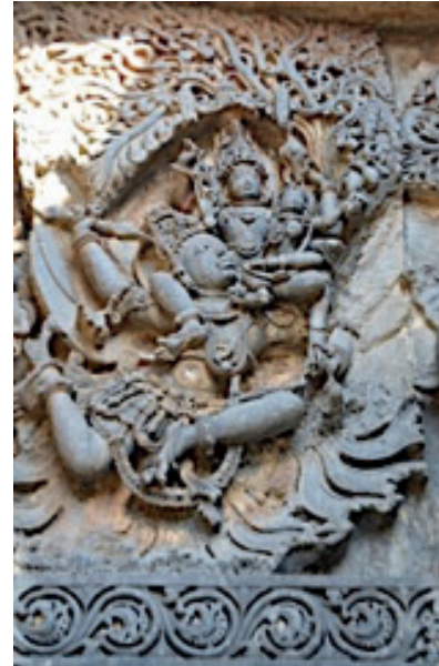
Resim 5. Vişnu, Garuda, Lakşimi, Halebidu Tapınağı M.S 1121, Karnataka

Vişnu, Hint kıtasının orta ve güney bölümlerinde yer alan en önemli tapınakların merkezinde yer almaktadır. Sanatsal referansları bronz, taş, rölyeflerdir. Vişnu, ahlakın ve medeniyetin korucusudur. Mahabharata destanının bir kısmında, Krişna olarak tanınır. Puranik efsanevi kaynaklarda, Vişnu, ezeli yaratıcının sol kısmından yaratılmıştır. Puranalar, ayrıca, Vişnu'nun görünüşü ile ilgili oldukça karmaşık ve çeşitli tanımlamalar sağlamaktadır (Chandra, 2001.361) Gökyüzüne üç dev adımda yükselen ve onu oluşturan Tanrı'dır. Fakat, hiçbir zaman güneş tanrısı olmamıştır. Kısaca, gökyüzü ve güneş hareketleriyle ilişkilendirilmekteydi. Resim 4'te yer alan heykelde Vişnu'nun gökyüzüne doğru uzanan kozmik adımı tasvir edilmiştir.