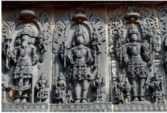
Resim 3. Trimurti, Halebidu Tapınağı M.S 1121, Karnataka