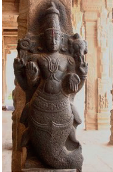
Resim 11: Matsya Heykeli, Srirangam Temple, Tamil Nadu, M.Ö.3.yy.