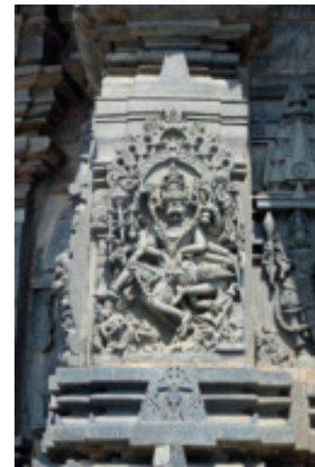
Resim 18. Narasimha Heykeli, Chennakeshava Tapınağı, M.S. 1108-1152 Karnataka