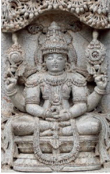
Resim 28. Buda, Chennakeshava Tapınağı, M.S. 1108-1152, Karnataka