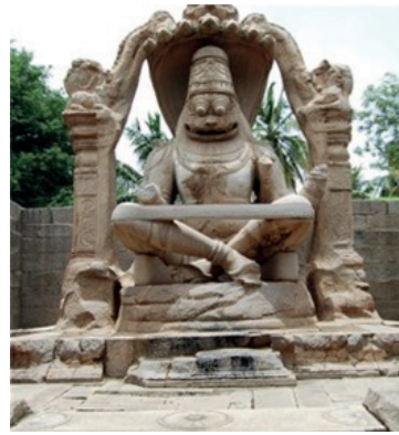
Resim 20. Narasimha Yoga pozunda, Hampi Anıtı, M.S 15-16 yy, Karnataka