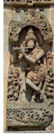
Resim 25. Vişnu, Garuda, Lakşimi, Halebidu Tapınağı M.S 1121, Karnataka

olayların anlatıldığı bir kompozisyonun merkezinde yer almıştır.