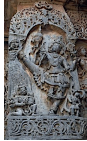
Resim 4. Vişnu'nun kozmik adımı, Halebidu Tapınağı M.S 1121, Karnataka

ne yakın kişi ve varlıklarla betimlenir. Bu kişiler, üç büyük tanrı üçlemesi ile Trimurti olarak, karısı Lakşimi ile eşlikçi ve koruyucu hayvanı Garuda ile olan heykelleri ve yalnız, ayakta, otururken ya da daha önce bahsedildiği gibi kutsal yılan sesanın kıvrımları üzerinde uyurken betimlenmiş heykelleridir. Güney Hindistan'da yer alan, Halebidu Tapınağında bulunan Resim 3'te, üç büyük tanrının yan yana yer aldığı heykeller görülmektedir. Solda, Brahma sakallı olarak cepheden tasvir edilirken, tek bedende üç baş yer almakta, Şiva ve Vişnu'nun başları, profilden Brahma'nın sağ ve sol tarafında tasvir edilmiştir. Tek bedende yer alan bu üç tanrıyı dört elle ve ellerinde sembollerini taşıırken görmek mümkündür. Diğer figürler ise ortada Şiva ve sağda Vişnu heykelleridir. Bu heykelleri, Vişnu ve Şiva'yı ellerinde taşıdığı sembollerden ayırt etmek mümkündür.