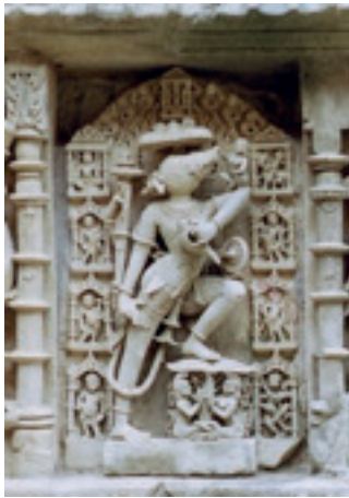
Resim 15. Varaha 11. yy Queen Stepwell, Patan, Gujarat

Tapınaklarda Varaha'nın yaban domuzu biçiminde olan heykelleri de yer alır. Önemli örnekleri Madya Paradesh Eyaletinde Khajuraho, Lakshmana Tapınağındadır. Resim 16 ve 17 de farklı açılarda görülen heykelde; tek parça, kumtaşından yontulmuş, yaklaşık 3 m uzunluğunda, heykelin tüm yüzeyinde, küçük ve son derece detaylı rölyefler yer almaktadır. Bu rölyeflerde; tanrılar, bilgeler, sayısız varlıklar ve efsanelerden sahneler yer almaktadır.