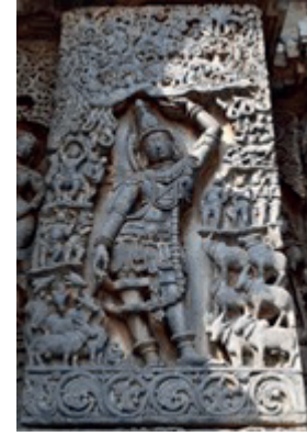
Resim 26. Krişna, Chennakeshava Tapınağı, M.S. 1108-1152 Karnataka