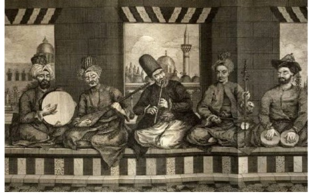
Resim 1: Halep'teki Osmanlı paşasının saz takımı. Soldan sağa: Def ve hanende, "tanbur", ney, Arap kemençesi, nakkare. Russell, 1794

meşkhanelerdir. Bu yerler müsikînin halk tarafından tanınmasına, sevilmesine ve yaygınlaşmasına vesile olmuştur (Tanrıkorur, 2003).