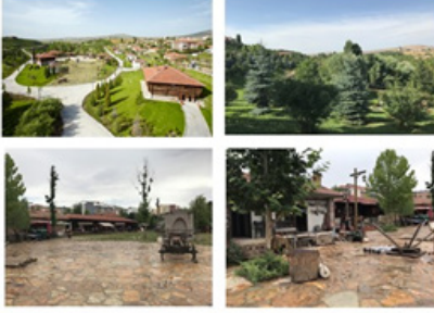
Şekil 1. Müzeden Genel Bir Görünüm ( http://www.altinkoy.tc ; Silav, 2018)