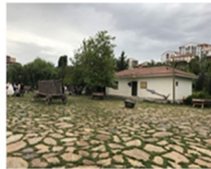
Şekil 9. Köy Okulu (Silav, 2018)

Köy okulu: Köy şartlarında eğitim ve öğretimin nasıl olduğunu ziyaretçilere gösterebilmeyi amaçlayan okul; küçük tahta sıralar, köşede duran bir soba, kara tahta, duvarda asılı dünya haritası ile geçmişin detaylarını içermektedir (Şekil 9).