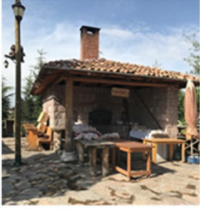
Şekil 10. Köy Fırını (Silav, 2018)

Köy Fırını: Altıncöyde ekilen buğdayın yine buradaki değirmenlerde öğütülerek un haline getirilmesi, taş fırınlarda pişirilerek ekmeğin ziyaretçilere sunulması amaçlanmaktadır. Fırınlara köylerde sadece ekmeğin pişirildiği yer değil aynı zamanda halkın sosyalleştiği mekan olma özelliğini taşıması nedeniyle de köy yaşamının önemli bir parçası olarak da görülmektedir (Şekil 10).