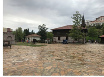
Şekil 7. Köy Meydanı ve Camiden bir görünüm (Silav, 2018)

Ova Cami: Kırsal alanda önemli yeri olan camilerden, 1900 yılların başında, Karabük Yortan Pazarı Ova Köyü'nde inşa edilen Ova Cami, sökülerek müzede yeniden kurulmuştur. Altıncöy'ün önemli simgelerinden olan caminin sökülmesi, nakliyesi, montajı ve restorasyonu 4 ay sürmüştür ve 2014 yılında hizmete açılmıştır (Şekil 7).