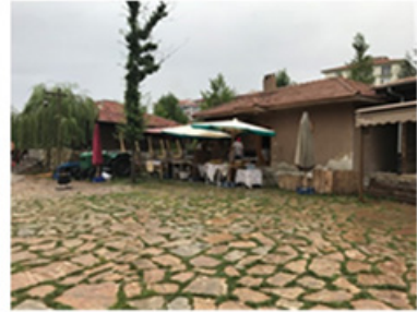
Şekil 8. Bakkaldan bir görünüm (Silav, 2018)

Bakkal: Köyün meydanında konumlanan bakkal, 1970li yılların ürünlerinin sergilendiği, bugün aynı zamanda köyde üretilen; sebze, meyve, bakliyat, un, ekmek, süt ve süt ürünleri ile yumurtanın satıldığı bir ticari birim olarak kullanılmaktadır. Bazı ürünlerin mizansen olarak sergilendiği bakkalda, alışveriş yapmak da mümkündür (Şekil 8).