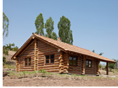
Şekil 12. Yayla Evleri ve Üretim

Yayla: Sebze üretiminin yapıldığı bostanlar ile hayvanların yer aldığı bölümü içermektedir. Altıncöy Açık Hava Müzesinde yine zirai üretimin yapılma aşamalarına göre; ekim, biçim ve hasat zamanlarında ziyaretçiler tarımsal üretimi de deneyimleme şansını yakalayabilmektedir (Şekil 12).