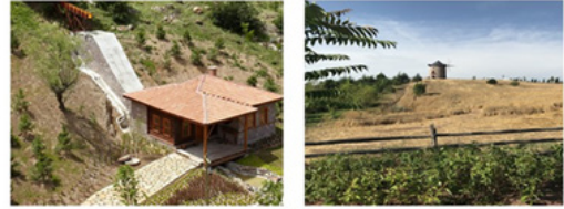
Şekil 3. Su ve Yel Değirmeni ( http://www.altinkoy.tc , Silav, 2018)

Değirmenler: Yaşamın önemli besin kaynaklarından biri olan ekmeğın hammaddesi olan unun geçmişte nasıl işlendiğini göstermektedir. Altıncöy’de su ve yel değirmenleri ile arpa ve buğdaydan un üretiminin yapımı ziyaretçilere aktarılmaktadır (Şekil 3).