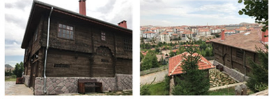
Şekil 2. Konaklardan Bir Görünüm (Silav, 2018)

lerin neredeyse adını ve işlevini bilmediği eşyalar ziyaretçilerin gösterimine sunulmaktadır (Şekil 2).