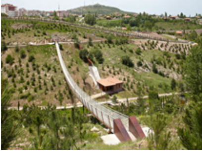
Şekil 5. Asma Köprü

Asma Köprü: Geçmişte köylerin kent merkezi ile ulaşımını sağlayan asma köprüler önemliydi. Geçmişten günümüze korunamayan ve sayıları gittikçe azalan asma köprüünün bir örneğini de açık hava müzesinde yer almaktadır (Şekil 5).