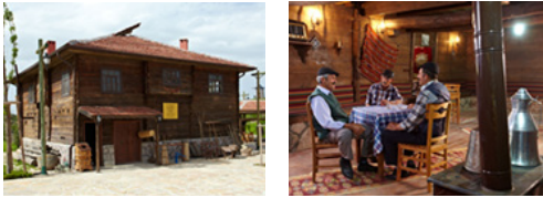
Şekil 6. Köy Kahvesi

Köy Kahvesi: Köylerin önemli kamusal mekanı olan kahvehaneler, erkeklerin toplanma ve sosyalleşme mekanı olarak görülmektedir. Altıncöy'deki kahvehane ile bu mekanların işlevi ziyaretçilere anlatılmaktadır (Şekil 6).