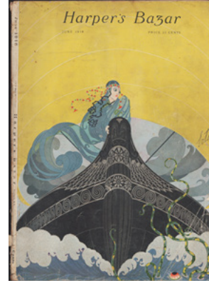
Resim 3. Erté'nin Harper's Bazaar Dergisinin Haziran 1918 sayısı kapağı, http://www.blissfrombygonedays.com/home/2017/6/20/ert-the-father-of-the-art-deco-style adresinden erişilmiştir.

Antik Yunan vazolarını andıran teknenin gövdesindeki siyah zemin üzerine beyaz renkle yapılmış Yunan süsleme motifleri, arka planda, fon olarak seçilen, altın sarısı renk, Art Deco akımının tipik görsel elementleridir.