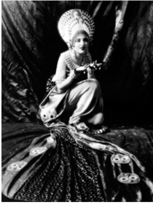
Resim 8: Erté'nin 1925 yılında, Ben Hur filminde oynayan Carmel Myers için tasarladığı kostüm, http://www.bliss-frombygonedays.com/home/2017/6/20/ert-the-father-of-the-art-deco-style adresinden erişilmiştir.

Erté'nin Hollywood'da set ve kostüm tasarımcısı olarak çalıştığı yıllarda yaptığı tasarımlar ile, kendi üslubunu ABD'ye tanıtmış ve kostüm tasarımlarında, da Oryantalizm ile Art Deco üslubunu birleştirmiştir. Resim 8'de, Erté'nin 1925 yılında, Ben Hur filminde oynayan Carmel Myers için tasarladığı kostüm yer almaktadır. İsa Peygamber'in yaşamıyla bağlantılı bir öyküyü konu alan filmde, sanatçının tasarladığı kostüm, tarihsel dönemden çok Art Deco üslubunun Oryantalizmi'ni yansıtmaktadır.