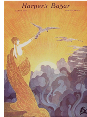
Resim 4. Erté'nin Harper's Bazaar Dergisinin Mart 1919 sayısı kapağı, http://www.blissfrombygonedays.com/home/2017/6/20/ert-the-father-of-the-art-deco-style adresinden erişilmiştir.

Resim 4'teki kadın figürü, doğayı yöneten bir Yunan tanrıçası olarak yorumlanabilir. İleriye doğru uzattığı sağ kolu ile kuşları ve güneşin doğuşunu yönetmektedir. Bu figür, uzun, güçlü ancak zarif gövdesi, kısa saçları ve elbisesi ile Art Deco döneminin kadın imgesini yansıtmaktadır. Kadın figürünün elbisesinin altın, turuncu renkleri ve akıcı çizgileri, güneşin altın rengi ve turuncu ışınları ile