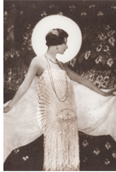
Resim 10: Chanel, beyaz muslin elbise, 1925, https://www.harpersbazaar.com/fashion/designers/g3098/history-of-chanel-1213/?slide=2 adresinden erişilmiştir.

1920 sonrası Chanel'in tasarımlarında, Rus etkisi ortaya çıkar. Chanel'in haute couture gece elbiselerinin sade çizgisi, Rus tarzı işlemler ve aksesuarlarla hareketlendirilir. Bu işlemler, Rus devrimi sonrası Paris'e göç eden Rus aristokrat ailelerinin kızları tarafından yapılır. Chanel takı ve mücevher tasarımlarında Rus çarlık mücevherlerinden esinlenir.