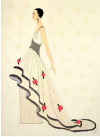
Resim 5. Erté, mendil etekli elbise, 1915 tarihli illüstrasyon https://tr.pinterest.co/pin/294000681895264266/ adresinden erişilmiştir.