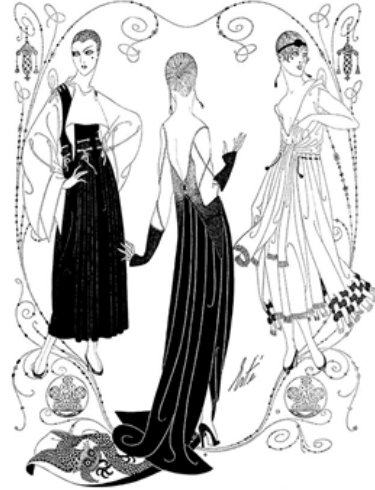
Resim 7: Erté'nin 1917 yılında Harper's Bazaar için yaptığı yaptığı elbise illüstrasyonları, http://www.victoriana.com/erte-haute-couture-15-stunning-designs/ adresinden erişilmiştir.

Savaş sırasında Avrupa'da yüksek moda dergilerinin yayını durduğu için, Harper's Bazaar dergisinin varlığı, moda dünyası için çok önemlidir. Erté'nin savaş yıllarında yaptığı moda illüstrasyonları, dönemin modası için belirleyici olur. Sanatçı, illüstrasyonlarının yanında, açıklayıcı ifadelerle yaptığı elbiselerin, lüks kürkler, kadifeler ve altın ve gümüş işlemlerle nasıl süsleneceğini de belirtmektedir. Dönemin baskı teknolojisi nedeniyle bu illüstrasyonlar, siyah beyaz basılmakta, Erté, elbiselerinin renklerini yazıyla, detaylı olarak açıklamaktadır. Resim 7'de, Erté'nin Harper's Bazaar Dergisi için 1917 yılında yaptığı bir illüstrasyon ve açıklamalarının Türkçe'ye çevirisi yer almaktadır.