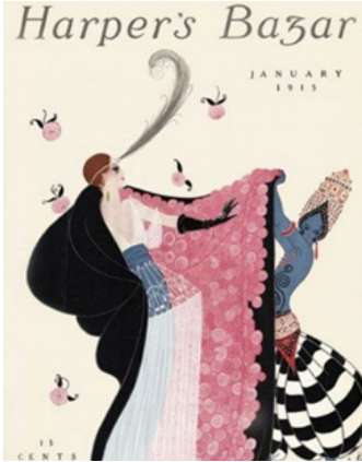
Resim 2. Erté'nin Harper's Bazaar Dergisinin Ocak 1915 sayısı kapağı, http://www.blissfrombygonedays.com/home/2017/6/20/ert-the-father-of-the-art-deco-style adresinden erişilmiştir.

Erté'nin Harper's Bazaar dergisinin 1915 yılı Ocak ayı, 1918 yılı Haziran ayı ve 1919 yılı Mart ayı sayılarının kapak illüstrasyonları, (Resim 2, Resim 6 ve Resim 7) sanatçının Art Deco akımının öncüsü olduğunu göstermektedir.