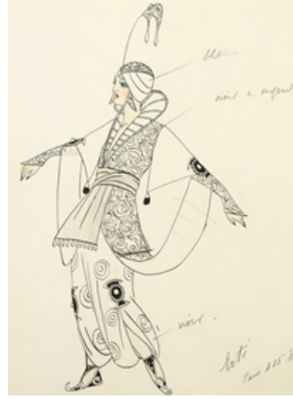
Resim 1. Erté'nin Le Minaret oyununda Mata Hari'nin kostümü için yaptığı illüstrasyon (1913), mürekkepli kalem ve suluboya, 27x20 cm. özel koleksiyon.

Moda tasarımcısı Paul Poiret, Rus Oryantalizminden çok etkilenmiş ve giysi tasarımlarında olduğu gibi, sahne için yaptığı tasarımlarda Erté ile birlikte çalışmıştır. Erté', Poiret'nin 1913 yılında prodüksiyonunu yaptığı "Le Minaret" adlı oryantalist temalı oyunun kostümlerinin hazırlanmasında görev almıştır. Resim 4'te, Erté'nin, bu gösteride rol alan oyuncu Mata Hari için yaptığı tasarım yer almaktadır.