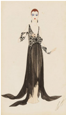
Resim 6. Erté, "L'Inoubliable Nuit, No.45", 1917

Erté'nin, daha sonraları "spagetti askılar" olarak adlandırılacak olan, omuzlardan ince kordonlarla askılı tasarladığı gece elbiselerini, ilk olarak 1915 yılında yaptığı illüstrasyonlarında sunmuş, bu gece elbiseleri, savaş sonrası Fransız modacıları tarafından takit edilmiştir. (Behling, 1977:70)