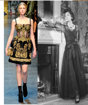
Şekil 3: 1.Görsel: Alexander McQueen, 2010 Kış Koleksiyonu- Paris,

2. Görsel: Balmain, 2010 Sonbahar Koleksiyonu-Paris,