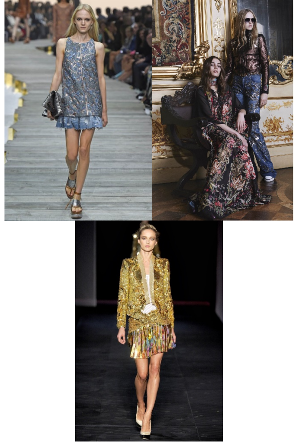
Şekil 10: Cavalli' nin tasarladığı Barok etkili Jean ve kıyafet tasarımları (Bağlantı 15) Bağlantı 16, Erişim Tarihi: 10.03.2019)