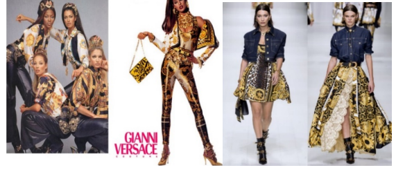
Şekil 7: 1.Görsel: 1990 yılında Versace markasına ait fotoğraf çekimi (Bağlantı 10, Erişim Tarihi: 12.05.2019)

Moda sektörünün başarılı modacıları arasında yer alan isimlerden 1970 yılında kurulan Versace markası; gösterişli, zengin görünümlü, rahat ve modern tasarımları ile dikkat çekmektedir. Güncel olanın modernliği ile geçmiş yıllara ait spor, bedeni saran ya da oldukça geniş biçimsel özellik taşıyan giyim özellikleri ve geçmiş sanat akımlarından barok sanatın yoğun işleme, desen ve renk görüntüsünü birleştirerek kullanıcı kesim arasında dikkat çekmiştir. (Blackman, 2013, s. 323)