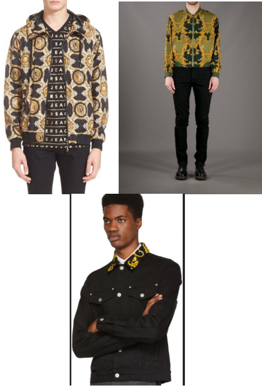
Şekil 9: 1990' ılı yılların rahat görünümlü spor ceket modelinin günümüze barok desen etkisi ile uyarlandığı Versace ceket modelleri (Bağlantı 13, Erişim Kadrosu: 11.04.2019) (Bağlantı 14, 11.04.2019)