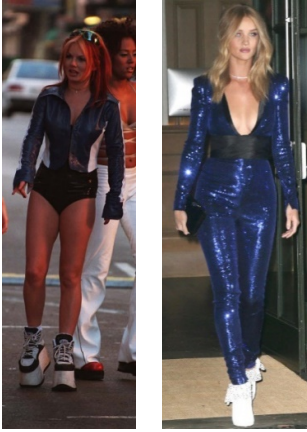
Şekil 6: 1990'lı yıllarda deri ve apartman topuk modasının günümüzdeki görünümü (Bağlantı 9, Erişim Tarihi: 22.04.2019)

1990'lı yıllara ait moda anlayışında maksimalizm ve Barok sanatının yanısıra minimalizm sanat akımının düşünce ve tarz yapısı da yer almaktadır. Yetmişli yıllara ait avangart bir sanat terimi olan minimalizm etkisi, doksanlarda tekrar moda trendleri arasında yer alarak etkili olmuştur. 1980'lerin güçlü kadın imajına ait göstergelerden farklı boyutta seyretmiştir.