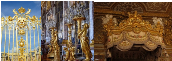
Şekil 2: Versay Sarayı' ndan Barok Sanat etkisinde detay görüntüler Bağlantı 2 (Erişim Tarihi: 12.04.2019)

Barok dönem, sadece sanat, mimari ya da heykel için verimli bir ortam oluşturmakla kalmamış; birçok dönemde moda alanı için de verimli bir ortam oluşturmuştur. İhtişam, güç, gösteriş döneminin anahtar kelimeleri arasında yer almaktadır.