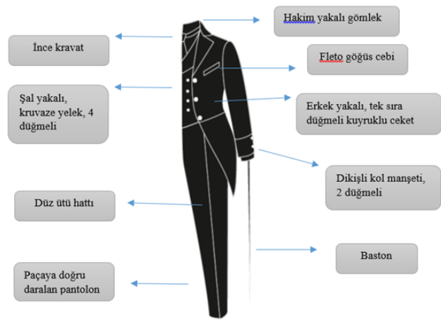
Tablo 1: 1900'lu yıllarda erkek takımı stil, form ve model özellikleri Analiz Tablosu

papyon ve kravatların hâkim çizgiler olarak tanımlamıştır. Yüzyılın başlarında, batı tarzların değişmesine rağmen, üç parçadan oluşan takım elbiselerde çok büyük değişiklikler olmadığı ifade eden Fischel vd. (2013:224) erkeklerin takım elbiseleri ile birlikte baston, şemsiye, şapka, kravat, papyon, saat zinciri ve kravat iğnesi gibi aksesuarlar kullandığını belirtmiştir. Benzer bir ifade ile Mendes ve Hays (1999: 44) de bu dönemde erkeğin takım elbisenin kombinini ince bir bastonla veya sıkı bir şekilde sarılmış şemsiye ile tamamladığını vurgulamıştır.