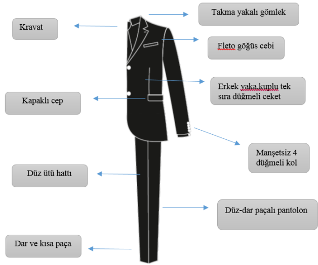
Tablo 11: 2000'li Yıllarda Erkek Takımı Stil, Form ve Model Özellikleri Analizi Tablosu

etmiş ve kullanmıştır. Özellikle 2000'li yılların getirdiği teknolojik gelişmeler giyim endüstrisini de etkilemiştir. Erkek takımları geçmişe oranla çok daha hafif olan kumaşlara üretilmeye başlanmış (Roetzel, 2004: 90) ve kullanıcıya sunulmuştur. Bu dönemde sporun günlük hayat sıklığının artması, kişisel bakım ve vücut şekillendirme popülaritesi yükselmiş, erkekler vücutlarının üçgen formunu, takım elbise içerisinde belirgin şekilde göstermeye başlamıştır. Bu yıllarda gittikçe daralan formda giysiler beden hatlarını daha fit göstermek amacıyla da kullanılmaktadır.