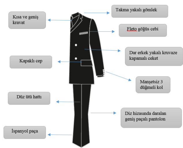
Tablo 7: 1960'lı Yıllarda Erkek Takımı Stil, Form ve Model Özellikleri Analizi Tablosu

Müziğin moda etkisi bu dönemde de gözlemlendi. Özellikle ünlü müzik gruplarının giydiği giysiler bu dönemde popüler oldu. Bu dönemde İngiliz grup The Beatles 'ın grup üyelerinin giydiği birbiri ile uyumlu takım elbiseden oluşan tarzları erkek giyiminin gelişmesini sağladı (Fischel vd., 2013:366). Altkültürlerin moda etkisi 60'lı yıllarda da görüldü. Düzgün kesimli İtalyan elbiselerini tercih eden, temiz ve kaliteli görünüm yansıtan, modernite sözcüğünden türetilen 'modlar ve 'Rockçılar' zıt giyimlere sahip iki ayrı karşıt kültürdü (Hopkins, 2016: 43). 1960'lar ilerledikçe modada bir kemer sıkma süreci başladığını ve üzerinde oynamalar yapıp aslı bozulan tarihi askeri uniformaların erkekler için bir nostaljik akımın parçası olduğunu ifade eden Fogg (2014:365)'a göre bu tarzın tercih edilmesi ile birlikte 'modlar'ın giyimindeki ince terziliğin yerini, hippilerin fantastik kostümleri almıştır.