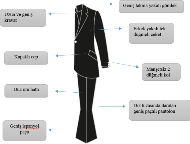
Tablo 8: 1970'li Yıllarda Erkek Takımı Stil, Form ve Model Özellikleri Analizi Tablosu

pantolonlar veya 'loon' pantolon olarak adlandırılan dizden aşağısı aşırı bol bir pantolon tercih etmişlerdir (Yapp, 2005: 7; Fischel vd., 2013: 372).