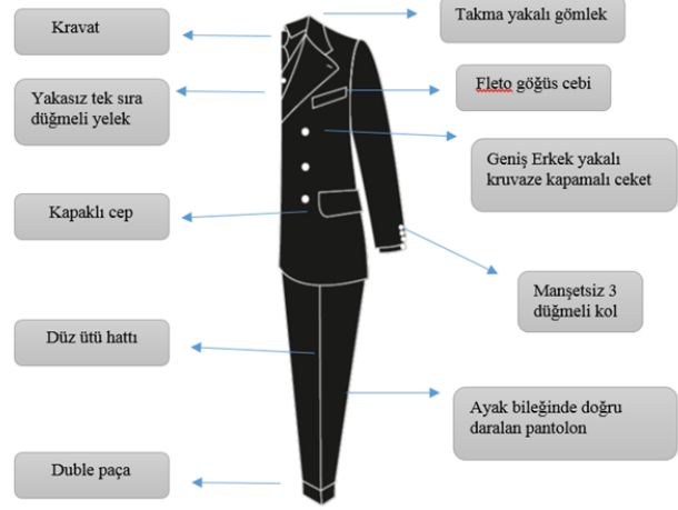
Tablo 4: 1930'lu Yıllarda Erkek Takımı Stil, Form ve Model Özellikleri Analiz Tablosu

1930 yılına doğru yüksek belli takımlar, yerini daha düz silüetlere bırakmıştır (Fischel vd. 2013:264). Dökümlü takım elbisenin erkek giyime rahat bir kesim getirdiğini vurgulayan Fogg (2014: 275) bu durumun erkek giyimi tasarımı üzerindeki son askeri etkiyi de kaldırdığını ifade etmiştir. Kravat için 'Windsor' düğümünün kullanılması dışında, ceketlerin modası çok değişmediğini belirten Yapp (2005: 224)'a göre gelir durumu iyi olanlar için bu dönemde silindirik şapka, beyaz kravat ve frak giderek önem kazanmıştır. Resmi ortamlarda erkekler genellikle koyu renklerde gömlek, kravat ile atletik stilde takım elbise giymişlerdir (Mendes ve Haye, 1999: 92). Hollywood'un ünlü aktörlerinin giydiği 'V' biçimli, dökümlü, geniş omuzlu ve dar kalçalı Amerikan takım elbisesi, atletik ve maskülen idealin tipik bir örneğini oluşturduğunu belirten (Fogg, 2014: 271) göğüs kısmında bol kesimli ve hafifçe genişlemeden önce belde darlaşan bu silüetin, sonraki 20 yılın stilini belirlediğini ifade etmiştir.