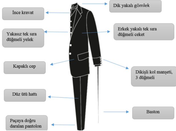
Tablo 2: 1910'lu Yıllarda Erkek Takımı Stil, Form ve Model Özellikleri Analiz Tablosu

elbise kesiminin iyi, yakası sert, kravatı sıkı bağlanmış olsa bile, özellikle giysi renginin oldukça önemli olduğunu belirten Yapp (2005: 293) sahip olunacak en iyi rengin, İngiliz teğmeninin haki rengi, Alman Hauptmann'ının toprak grisi ya da Fransız Teğmeninin toz mavisi olduğunu vurgulamıştır. Dönem boyunca erkek takımlarında pantolonlar dar kesimli ve duble paça olmadan kullanılmıştır (Mendes ve Haye 1999: 45).