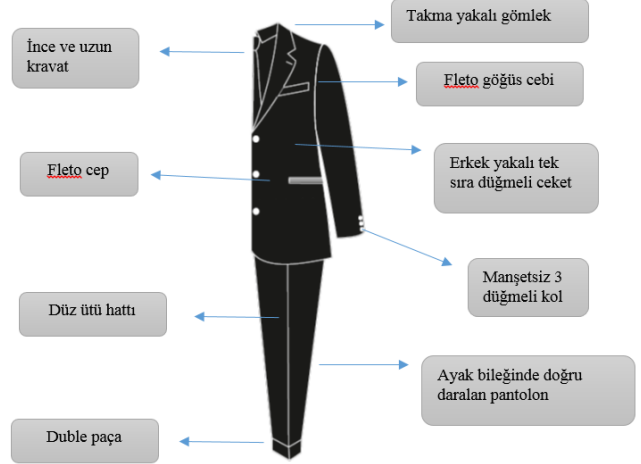
Tablo 6: 1950'li Yıllarda Erkek Takımı Stil, Form ve Model Özellikleri Analizi Tablosu

göre daha kısa ceketlerin popüler olduğunu, ayrıca özellikle ince çizgili olduğunu ve grinin her tonundan üretildiğini vurgulamıştır. Gottdiener (2005: 317) de birbirinin aynı olan Brooks Brothers ya da J. Press flanel kumaştan gri takım elbise, kemik rengi tüvit ceketin ve düğmeli yakalı gömleğin özellikle masa başı çalışan erkek modasının parçaları olduğunu belirtmiştir. Erkekler için takım elbise bu dönemde resmi giysi olmanın yanında gündelik giysi olarak da giyilmeye başlamıştır. Sorger ve Udale (2013:162)'e göre gençlik kültürünün evrimiyle gündelik giyim hız kazanmış, genç erkekler ise babaları gibi giyinmek, görünmek yerine, kendi tarzların doğrultusunda giyinmeyi tercih etmiştir. Fischel vd. (2013: 340) gençlerin Edward tarzı takımları kendi zevklerine uygun hale getirip giyindiklerini ve Edward tarzı ceketleri yeleklerle, kurdele şeklinde bağladıkları boyun bağlarıyla ve paçalara doğru daralan bol pantolonlarla stillerini oluşturduklarını belirtmiştir.