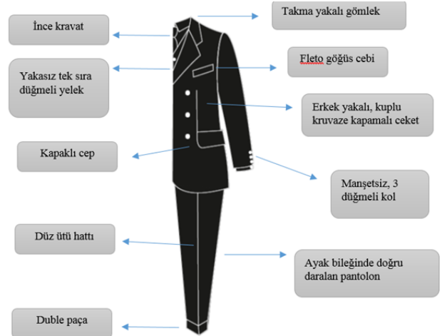
Tablo 3: 1920'li Yıllarda Erkek Takımı Stil, Form ve Model Özellikleri Analiz Tablosu

Bu yıllarda birçok erkeğin, kendi ölçülerine göre 'ısmarlama' takımları tercih ettiğini belirten Fischel vd. (2013:264) bazı erkeklerin vücut hatlarını kamufle eden daha Amerikan tarzı takımları ya da Fransız 'tailleur'ler tarafından büyük dikilen takım elbiseleri tercih ettiklerini ifade etmiştir. Bu yılların başında erkek giysilerinde önceki yıllara oranla daha renkli kumaşlar, tüvitler, boyalı iplikler ve farklı dokuma özellikleri olan kumaşlar kullanıldığını vurgulayan Dereboy (2004:119) tek sıra düğmeli, siyah renkte ceketler, gri yelekler ve açık renk kravatlarla çizgili pantolon kombinasyonu dönemin şık erkek giyim tarzını oluşturduğunu belirtmiştir. Bu özelliklerinin yanı sıra vurgulanmış omuzlar ve konik-sivri pantolonlar dönemde erkek giysilerinin stilini oluşturmuştur (Mendes ve Haye, 1999: 70).