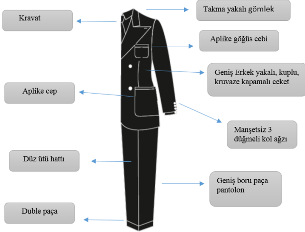
Tablo 5: 1940'lı Yıllarda Erkek Takımı Stil, Form ve Model Özellikleri Analizi Tablosu

örneklerinden biri 1930'ların sonuyla 1940'larda giyilen zoot takım elbiseler olmuştur. Üniformalara ve savaş zamanlarına karşı bir alternatif olan 'Zoot Süit' abartılı stile sahip olmuş: son derece uzun, belli ceketler ekstra geniş vatkalı omuzlara sahip ceketler, yüksek belli pantolonlar ile kombinlenerek kullanılmıştır (Mendes ve Haye, 1999: 123).