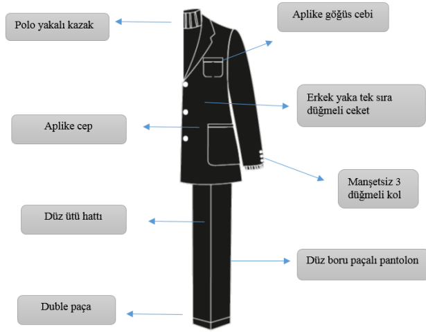
Tablo 10: 1990'lı Yıllarda Erkek Takımı Stil, Form ve Model Özellikleri Analizi Tablosu

1990'lı yıllarda özgünlük ve alt kültürel öğelerinin stil haline gelmiş ve etnik giyim geleneklerinin modayı önemli ölçüde etkilemiştir (Mendes ve Haye, 1999: 252). Yapp (2005:256)' a göre 1980'lerin modasında giysiler renk, malzeme ve biçim açısından acayip ve dikkat çekecek kadar garip hale gelmiştir. Ayrıca Sorger ve Udale, (2013: 43) 'e göre hem kadın hem de erkek modasında popüler olan abartılı vatkalar bu dönemde 'etkili giyimin' bir parçası olmuştur. 90'lı yılların erkek modası klasik temaların sessiz yorumları olarak tanımlayan (Feldman, 1992: 23) takım elbise modasının 80'lere benzer bağlara sahip olduğunu belirtmiş, geleneksel stillerin yanı sıra bazı erkeklerin ceketleri altına, parlak renkli yelekler, tişörtler veya sıra dışı giysileri kullanabildiklerini de vurgulamıştır.