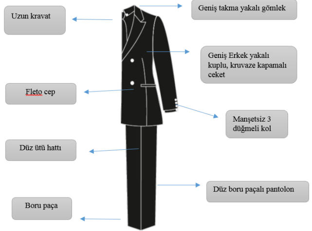
Tablo 9: 1980'li Yıllarda Erkek Takımı Stil, Form ve Model Özellikleri Analizi Tablosu

80'li yıllarda formda olma kavramının yaygınlaşması ile birlikte spor kıyafetler modanın belirleyicilerinden olmuştur (Fischel vd., 2013: 388). 1980'lerin sonunda, biraz da hip-hopçuların sayesinde öne çıkan spor giyim, günün modası ile neredeyse birleştiğini belirten Tungate (2006:203), bu akımın işyeri giyim kurallarında bir rahatlamaya yol açtığını, dahası takım elbisenin, bir daha geri gelmeyecekmişçesine yok olacağını düşünüldüğünü vurgulamıştır.