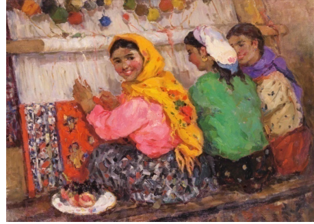
Resim 2. İdil Dergisi 28. Sayı kapağı Halı Örenler T.Ü.Y.B. 70x89. (Kacar, 2013, s.82).

1953 yılında Stalin'in ölümünden sonra baskıcı politikadaki yumuşama ülkede ulusal arayışların, geleneksel yaklaşım biçiminin ortaya çıkmasına zemin hazırlamıştır. 1957 yılında Kruşçev'in iktidara gelmesiyle yumuşama dönemine geçilmiş ve Azerbaycan resim sanatçıları, Sosyal Realizm anlayışından yola çıkarak milli geleneksel değerlere yönelik, farklı biçimde eserler ortaya koymuşlardır (Babayev, 1999).