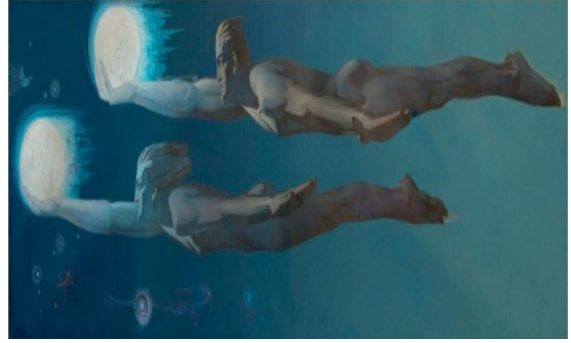
Resim 5. Senin için Beşeriyet, T.Ü.Y.B., 180x594, 1961. (Qacar, 2013, s.27)

erkek uzaya doğru hareket etmektedir. Bu uzay çağına ayak basıldığına işaret etmektedir (Mahmudova ve Nagiyeva, 2013).