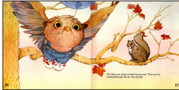
Resim 2. İllüstrasyon Örneđi 2

Deđişik resimlendirmeler, çocukların farklı bir dünyaya geçişini sağlamakta, hayal güçlerinin olanaklarını genişletmektedir. Sıradan, alışlagelmiş ya da kalıplaşmış, gerçeğe yakın ya da fotoğraf benzeri çizimlerden oluşan bir tarz çocuđun, meraklı, renkli ve hassas yapısına bir süre sonra yetersiz gelecektir. İllüstratörler, daha çok onlara hitap edecek, özgün ve yaratıcı çalışmalarla onların duyarlılığını yakalayabilecektir (Kara, 2012, s:230).