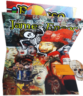
Resim 11. Pop-Up Demo Kitapçığı Görüntü 2