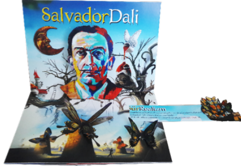
Resim 10. Pop-Up demo kitapçığı Görüntü 1

C sınıfına dağıtılan 3 adet modern sanat akımı ve 3 adet sanatçının ( Sürrealizm – Salvador Dali, Kübizm – Picasso, Expresyonizm – James Ensor) yer aldığı demo sanat akımı kitapçığının 10 dakika boyunca incelenmesinin ardından kendilerine soru metni ( Bkz.Resim9 ) dağıtılmış, süre gözetmeksizin öğrencilerin kağıtları teslim etmeleri beklenmiştir.