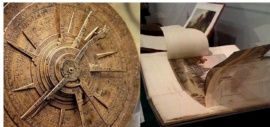
Resim 5. Eski Tarihlerde Kullanılan Volvelle ve Kanatçıklı Kitaplar

"Kanatçıklar" ise sayfa üzerine eklenmiş ve katlanmış parçacıklardır. Bu kanatçıklar kaldırıldığında altında gizlenen bilgi açığa çıkmaktadır. (Hendix'den aktaran Keş ve Sarıca, 2014, s:271)