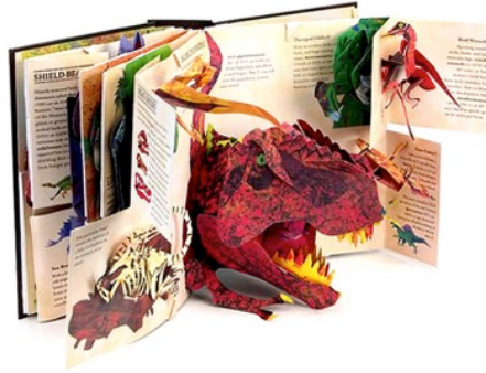
Resim 7. Hayvan İllüstrasyonları İle Hazırlanmış Açılır Kitap

Elle tutulup, gözle görülmeyen duygu kavramı, çocuk için hem anlatma hem de anlamaya yönelik olarak oldukça karmaşık bir yapıdır. Özellikle okul öncesi dönemi kitaplarında baş kahraman ise hayvanlardır. Kitabı açtığında kanatlan bir kuş, hareket eden bir bulut ya da evsiz bir çocuğun avuçlarını yalayan bir kedi, çocuğun kendi yaşam alanından kesitler vererek, karakterlerle ilişki kurmasını sağlayacak ve güzel duyguları bu kitaplar sayesinde keşfedecektir. Olayların hayvan kahramanlar üzerinden çocuğa sunulması, verilmek istenen mesajı başarılı bir şekilde yerine iletacaktır.