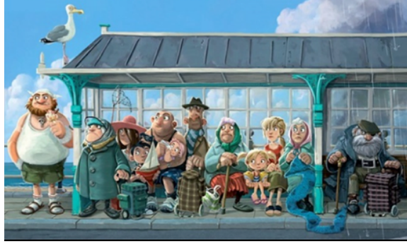
Resim 1. The Pirates Next Door Kitabı İçin Hazırlanan Jonny Duddle İllüstrasyon Örneđi

İllüstrasyon, uzunca bir yazıyı, anlık olarak izleyiciye doğru bir şekilde aktarabilirse başarılıdır. Dolayısıyla çocuk kitaplarında kullanılan illüstrasyonlar, küçük okuyucunun kitapta anlatılmak istenen her ne ise doğru bir şekilde faydalanmasını sağlamalıdır. İllüstrasyonlarda kullanılan formlar, biçimler ve renkler ve hatta aktarım biçimi hedef kitlenin yaş gurubuna uygun olarak hazırlanmalıdır. Tasarım aşamasında onların anlayabileceđi sahneler, çözebileceđi semboller ve anlamlar çıkarabileceđi renkler dikkate alınmalıdır.