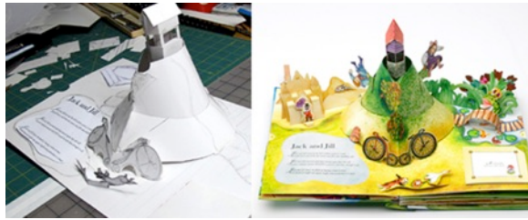
Resim 4. Pop-Up Kitap İllüstrasyon Hazırlık Aşaması

Kitabın tasarım aşamasında her parça titiz çalışmalar sonucunda çıkmakta ve birleştirilmektedir. Öncelikli olarak her parça tek tek çizilip birleştirilip daha sonra basılmaya karar verildiğinde bu parçalar, bilgisayar yardımıyla uygun renge dönüştürülüp tabakalar halinde basılmakta ve yeniden birleştirilmektedir. Günümüzde bu tip kitaplar, teknolojinin gelişmiş olmasına karşın elle hazırlanmakta ve uzun ve zahmetli inşa prensiplerine sahiptir (Keş ve Sarıca, 2014, s: 268)