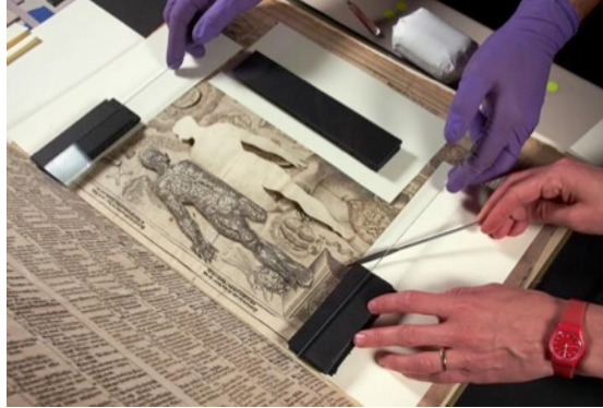
Resim 6. 17. Yüzyılda Basılmış Tıbbi Hareketli Kitap

Çok eski tarihlerden bu yana kullanılan pop-up kitaplar, ilk olarak mühendislik ve tıp alanları için üretilmiştir. Kaslar, kemikler ve katmanlar halinde düzenlenmiş olan iç organlar gravür illüstrasyonlar halinde basılmıştır. Zamanla farklı alanlara ait yayınlarda da hareketli mekanizmalardan yararlanılmıştır.