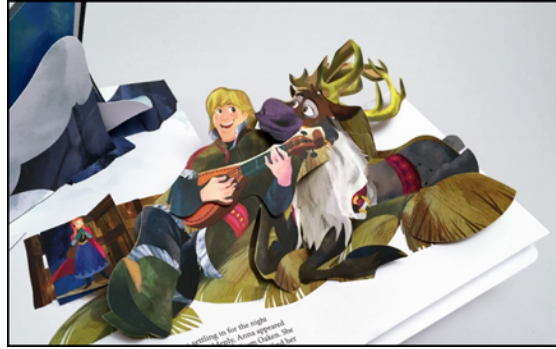
Resim 3. Frozen Hareketli Masal Kitabı İllüstrasyonu

sıra, bilgileri daha kolay yoldan aktarmakta ve akılda kalıcılığı sağlamaktadır.