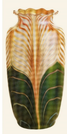
Görsel 2.3.3. Steuben Cam Fabrikası, "Auerene" Vazo, H: 23 cm, 1915, Amerika