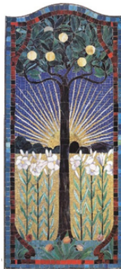
Görsel 2.11.1. Miksa Róth, "Doğan Güneş", Cam Mozaik, 171x76 cm, 1897, Macaristan