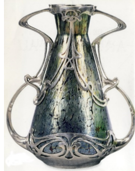
Görsel 2.10.1. Loetz Cam Fabrikası, "Iridescent Vase",