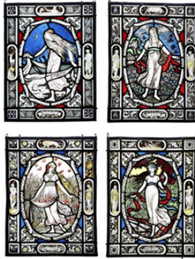
Görsel 2.7.1. Jan Schouten, "Dört Mevsim", Vitray Tekniği, 1905, Delft

Cam sanatında, 19. yüzyıl başlarında, vitray sanatında başlayan canlanma Nijmegen ve Rotterdam'daki amatör sanatçıların deneysel çalışmaları sayesinde gerçekleşmiştir. 1840'lı yıllarda, vitray sanatında gotik tarza dönüş başlamış, renklendirilmiş camın ve orta çağ vitray sanatı tekniklerinin yeniden kullanımı artmıştır. Ağırlıklı olarak kilise mimarisinde kullanılan vitray, 1890 yılından itibaren kentlerde inşa edilen büyük evler için artistik anlamda da üretilmiştir. Amsterdam Okulu, Jan Schouten (1852-1937), Willem Bogtman (1882-1955) Hollanda'da Art Nouveau cam sanatına katkıda bulunan kurum ve sanatçılara örnek gösterilebilir (Bkz. Görsel 2.7.1) (Muller, 2011, s. 356,357).