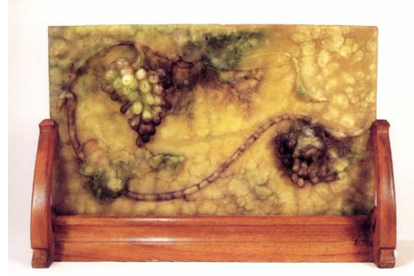
Görsel 2.2.7. Victor Amalric Walter, "The Grape Vine", Daum'da Üretilen ilk Pâte de Verre Çalışma, Daum, Fransa