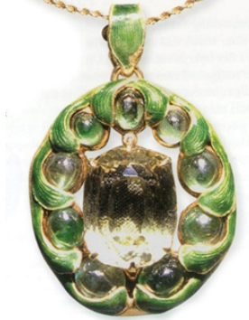
Görsel 2.3.2. Louis Comfort Tiffany, "Altın Kolye", Mine Tekniği, 1912, Amerika