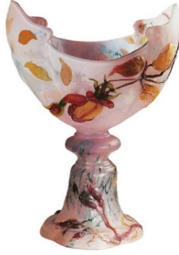
Görsel 2.2.5. Gallé, "Roses de France" Kap, 44.7 x 31.1 cm, Marquetry Tekniği, 1901, Nancy, Fransa

Art Nouveau döneminde doğal dünya - bitkiler ve çiçekler, böcekler, kuşlar, hayvanlar, deniz yaşamı ve hatta insan figürü - cam sanatçılarına genellikle sembolik anlam taşıyan zengin bir ifade dili sağlamıştır. Gallé'nin doğadan ilham alarak belli belirsiz figüratif bağlantılarla formları soyut biçimlere dönüştürdüğü bazı eserleri Sürrealist akımının doğuşunun öncesine tarihlendirilmiştir (Bkz. Görsel 2.2.6). (Klein & Lloyd, 1989).