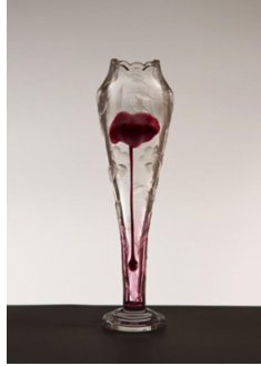
Görsel 2.10.2 : Moser Cam Fabrikası , "Rose", H: 30 cm, 1900-1910, Karlsbad