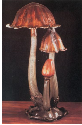
Görsel 2.2.6. Gallé, "Les Coprins" Lamba, 1904, Fransa

Art Nouveau döneminde doğal dünya - bitkiler ve çiçekler, böcekler, kuşlar, hayvanlar, deniz yaşamı ve hatta insan figürü - cam sanatçılarına genellikle sembolik anlam taşıyan zengin bir ifade dili sağlamıştır. Gallé'nin doğadan ilham alarak belli belirsiz figüratif bağlantılarla formları soyut biçimlere dönüştürdüğü bazı eserleri Sürrealist akımının doğuşunun öncesine tarihlendirilmiştir (Bkz. Görsel 2.2.6). (Klein & Lloyd, 1989).