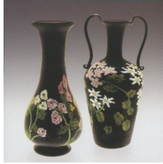
Görsel 2.8.2. Fratelli Toso Cam Fabrikası, "A Murrine Foreali", Sıcak Cam Üfleme ve Murrini Dekor Tekniği, 1920, İtalya