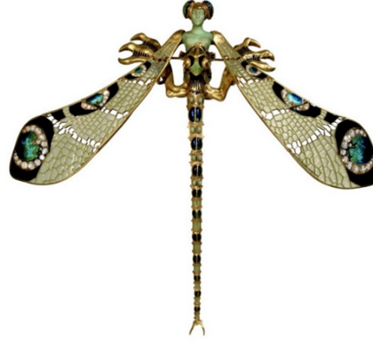
Görsel 2.2.9. René Lalique, "Yusufçuk Böceği Broş", Vitray ve Mine Tekniği, Fransa