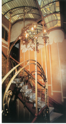
Görsel 2.6.1. Victor Horta, "Victor Horta Müzesi Girişi", 1901, Belçika