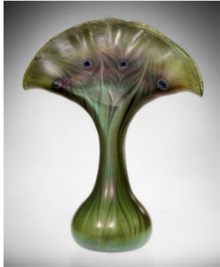
Görsel 2.3.1. Tiffany, "Vazo", Favrile Cam, 35.9 x 29.2 cm, Üfleme Tekniği, 1893-96, Amerika

Louis Comfort Tiffany, 1878 yılında Louis Comfort Tiffany and Associated Artists 'i kurarak çeşitli cam yapım teknikleri ile çalışmaya başlamıştır. Sanat camı tasarımlarında yalnızca doğadan değil, aynı zamanda Çin, Japonya ve Orta Doğu'nun sanatından da esinlenen sanatçı, 1880 yılında metal oksit kullanarak elde ettiği Favrile olarak adlandırılan yanardöner camın patentini almıştır (Bkz. Görsel 2.3.1) (Klein & Lloyd, 1989, s. 207-213). Tiffany'nin üfleme tekniği ile ürettiği eserleri dışında popüler olan diğer çalışmaları Tiffany Lamps olarak adlandırılan aydınlatmalar olmuştur ve takı tasarımları olmuştur (Bkz. Görsel 2.3.2).