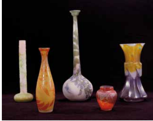
Görsel 2.2.4. Gallé, "Cam Vazo Grubu", En Uzun Vazo 30.5 cm, 'Cameo' Tekniği, Art Nouveau Dönemi, Fransa