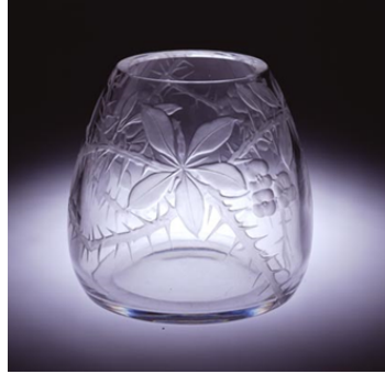
Görsel 2.9.1. İmparatorluk Cam Fabrikası, "Vazo", H: 21,7 cm, 1908, St Petersburg

renkli cam üretimine doğru bir değişim gözlemlenmiştir. Rusya'nın önde gelen fabrikası olan St. Petersburg İmparatorluk Cam Fabrikası, yüzyılın ilk yarısı boyunca herhangi bir Avrupa ülkesinin en iddialı ve sanatsal camlarından bazıları ile eşdeğer camlar üretmiş, bu üretimleri neo klasik çömlekler, vazolar ve ibrikler takip etmiştir (Bkz. Görsel 2.9.1) (Klein & Lloyd, 1989, s.171).