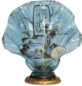
Görsel 2.2.3. Gallé, "Flower Vase", "Ayışığı Camı", 24 x 22 x 14 cm, 1878, Fransa Kaynak: Gallé, 2014, s.91

(Yanardöner Cam) eserler sanatçının sonraki çalışmalarına esin kaynağı olmuştur (Bkz. Görsel 2.2.4). (Arkas Sanat Merkezi, 2014, s.44).