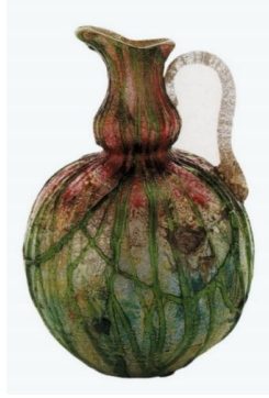
Görsel 2.1.1. Stevens & Williams Cam Fabrikası, "Silveria" Cam Sürahi, Yükseklik: 17 cm, Üfleme Tekniği, 1901, İngiltere Kaynak: Miller, 2004, s. 93