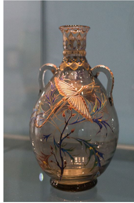
Görsel 2.2.2. Gallé, "Praying Mantis and Beetle Vase", Yükseklik: 23.3 cm, Çap: 12 cm, Mine Dekoru, Fransa

Seramik ve cam sanatındaki ilk öğrenmelerini babasının fabrikasında gerçekleştiren Emile Gallé, Art Nouveau Dönemi'nde hem sanatsal hem de endüstriyel cam üretimleri ile dünya çapında bir üne sahip olmuştur. Başlıca ilgi alanları felsefe, botanik, şiir ve cam üretimi olan sanatçının çalışmalarını tanımlamak için "camın şairi" tabiri kullanılmıştır (Miller, 2004, s.74). Saydam cam ya da saydam renkleri kullandığı erken dönem eserlerinde Ortaçağ İslam mine dekoru etkisi açıkça görülür (Bkz. Görsel 2.2.2).