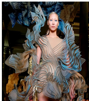
Görsel 21. https://www.magazinespain.com/mercedes-benz-fashion-madrid-2015-francis-montesinos/#gallery/75341/15876