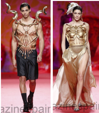
Görsel 20. https://www.vogue.com/fashion-shows/spring-2014-ready-to-wear/pedro-lourenco