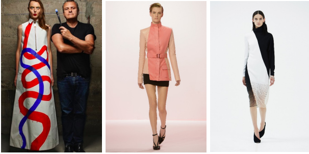
Görsel 18.

Günümüz moda tasarımcılarından Jean-Charles de Castelbajac (Görsel 18), Pedro Lourenço (Görsel 19, 20), Francis Montesinos (Görsel 21-22), Devastee, Iris Van Herpen(Görsel 23) tasarımlarında da sürrealizm etkileri görülmektedir.