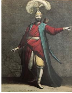
Resim 7. Solak (Öndeş, Makzume, 2000: 57)

kullandığı tüylü sorguç vardır. Osmanlı'da buna benzer başlıkları yayabaşılar ve çorbacılar da kullanmaktadır (www.islamansiklopedisi.org.tr).