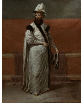
Resim 2. Vezir-i Azam Nevşehirli Damat İbrahim Paşa

Padişahın başındaki kavuk, beyaz renkte olup üzerinde ise altın işlemleri bulunmaktadır. Ayağında altın rengi çarıklar görülmektedir.