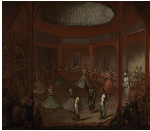
Resim 13. Galata Mevlevihanesi

Kadı'nın kıyafetinin yer aldığı Resim 12'de, kahverengi entari üzerine giyilmiş yeşil renkli hırka görülmektedir. Hırkanın ön ortasına, yaka çevresine ve kol uçlarına kahverengi kürk geçirilmiştir. Bol ve dökümlü olan hırkanın kolları genişleyerek uzamaktadır. Başında beyaz şişkin sarığı, ayaklarında ise sarı renkli çizme ya da mest olduğu düşünülen ayakkabıları bulunmaktadır.