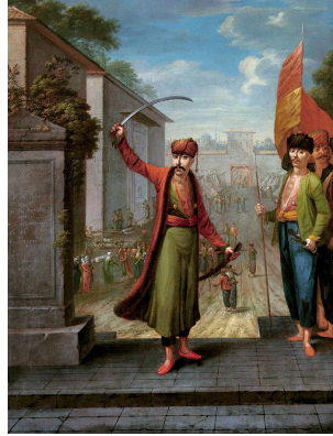
Resim 8. İsyancı Patrona Halil

Van Mour'un resmettiği eserlerinden biri olan Solağın (Resim 7), sarı bir çakşırı ve onu tamamlayan beyaz çizmeleri vardır. Üstünde ise kırmızı renkli entarisi bulunmaktadır. Entarinin bol kesim olan kolu, dirsekten bileğe doğru vücudu saran model özelliğine sahiptir. Entarinin etek uçları beldeki açık kahverengi kuşağın içine doğru katlanmıştır. Mavi kaftanı dört kolludur. Başında ise tüylü sorguç yer almaktadır.