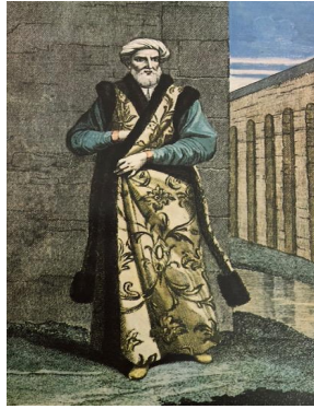
Resim 3. Kaptan (Kapudan) Paşa

Resim 2'ye bakıldığında, Damat İbrahim Paşa'nın beyaz renkli (sedefli) entarisi göze çarpmaktadır. Entarinin aynı renginden, kruvaze kesimli ön ortası -boyun çevresini saran ve kol takım yerinde koyu kahve kürklü kaftanı (dört kollu kaftan) bulunmaktadır. Dört kollu kaftandan kasıt, kaftanın arka kısmına doğru düşen dar ve uzun kol parçalarının giyside yer almasıdır. Bu parçalar işlevsiz olup gösteriş amaçlıdır (Çetin, 2016: 265). Başında beyaz oyma şekilli başlık bulunmaktadır.