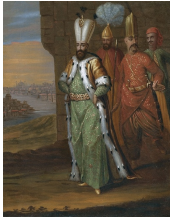
Resim 1. Padişah III. Ahmet

Bu bölümde, Jean Baptiste Van Mour' un belirlenen tablolarındaki ; XVII. yüzyıl sonu ve XVIII. yüzyıl başındaki Osmanlı yaşamının sivil, dini ve ümera (yönetici) kesiminin erkek giyimleri incelenecektir.