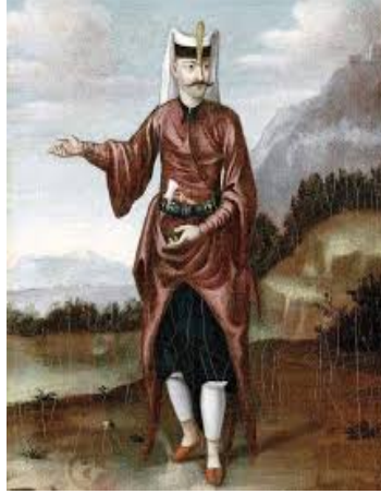
Resim 5. Yeniçeri

Jean Baptiste Van Mour'un Yeniçeri Ağası'nı resmettiği Resim 4'teki giyimler incelendiğinde; kırmızı uzun şalvar, sarı kendinden işlemeli entari (bol kesim kolları dirsekten sonra vücudu saran), taşlar ile süslenmiş (murassa) altın kuşak görülmektedir. Bu giysileri, entari kumaşından dikilmiş ön ortası – yaka çevresi ve kol uçları koyu kahverengi kürk ile zenginleştirilmiş dört kollu kaftan tamamlamaktadır. Yeniçeri Ağasının başında beyaz renkli kavuk görülürken, çarıkları ise sarı renklidir.