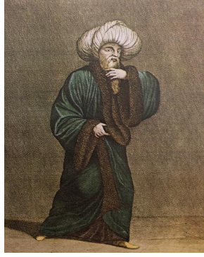
Resim 12. Kadı