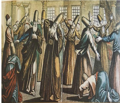
Resim 14. Galata Mevlevihanesi