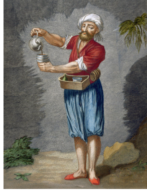
Resim 10. Sokak Kahvecisi

Seyyar berberin giysilerine bakıldığında (Resim 9); kırmızı uzun şalvar ve yeşil renkli bir entari göze çarpmaktadır. Beline bağlanmış mavi renkli esnaf futası, elinde tuttuğu ibrik, omzunda ise kahve renkli malzeme çantası ile beyaz havlusu vardır. Başında beyaz bir sarık sarılmış olan berberin çarıkları sarı renktedir.