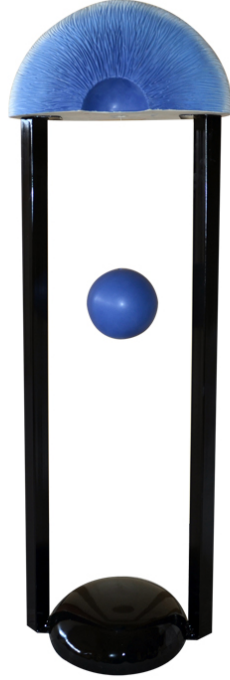
Görsel 16. Bakış 1, 140x45x25cm. Döküm 1040°C

dünya, yere basan bir yarı küre halinde yerde; tanrı bir göz formunda, tanrı görür, izler uhrevi bir dünyada; insan ise bu ikisinin arasında serbest, hareketli bir kürecik olarak ifade edilmiştir (Görsel 16).