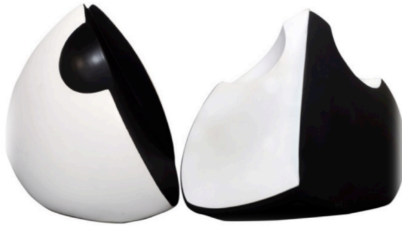
Görsel 17. Bakış 12, 140x45x25cm. Döküm 1040°C

İyi gören göz kötü gören göz aslında ikisi de aynı göz. Baktığın yerden bazen iyiyi bazen kötüyü gören duyu ve düşüncelerine, ruh haline, zaman ve mekâna bağlı olarak değişir. Bazen doğruyu bilsek te ona doğru demek içimizden gelmez kendimizi kandırırız ona yanlış diyerek rahatlarız gördüğümüzü değil görmek istediğimizi algılarız. Bu yapılan bir eyleme ya da yorumlanan nesneye ak (iyi) veya kara (kötü) demenin temel sebebidir. Oysa bu algısal bir farklılıktır gerçek değildir. Dış bükey, iç bükey olarak aynı olan dairesel iki formdan oluşan bakış12 isimli işinde siyah ve beyaz renkleri ve keskin hatlı formuyla iki farklı bakış açısının aslında farklı algılandığını ama gerçekte bu farkın bıçakla ikiye kesilmiş gibi ayrılamayacağını vurgulamaya çalışılmıştır.