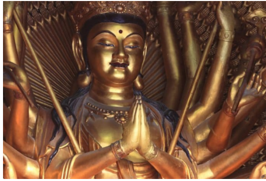
Görsel 2. Bilgelik Gözü, Üçüncü Göz

Hinduzim'de ve Budizm'de bir tanrının altıncı çakrasında yer alan ve aydınlanmayı temsil eden göz, üçüncü göz ya da bilgelik gözü olarak sembolleştirilmiştir (Görsel 2) (Wilkinson, 2018:102).