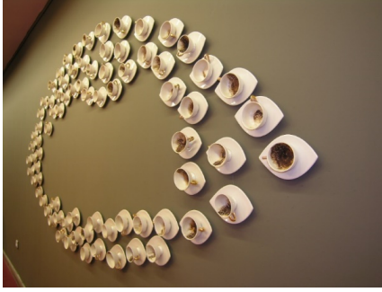
Görsel 11. "acı kvnnkrkylhtrvr" adlı seramik pano, 3,5 m, 2005

ilişkilerinde kahvenin öneminden çıkararak, ülkemizin bulunduğu coğrafyada komşusuz bir hiç olacağı göndermesiydi" (Lerzan Özer Kişisel İletişim: 15. 08. 2019).