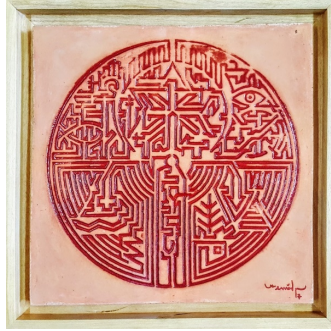
Görsel 14. Dolambaç-Dünyevi, 46x46x2 cm. Şamot-Baskı 1200°C 2017

yorumlanabilir. Sanatçı eserinin ana temasını şu cümleyle özetlemiştir. "Dolambaç-Dünyevi" isimli seramik eserimde üst kısmı uhrevi alanlarımızı simgeliyor. Eserimde stilize ettiğim bütün din simgelerini yer vermeye çalıştım" (Kemal Uludağ, Kişisel İletişim: 09. 08. 2019).