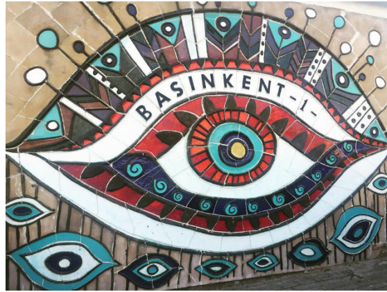
Görsel 4. Seramik Pano, Kem Gözlerden uzak Basın Sitesi, İstanbul. (https://gramho.com/media/1585543763043196872,2017: 119)