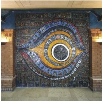
Görsel 3. Seramik Pano, Koç Holding, Kuzgunlar, İstanbul. (Kahraman, 2017: 119)

Yılmabaşar eserlerinde göz sembolüne, horoz ve cennet kuşu gibi diğer sık kullandığı simgelere göre daha az yer vermiştir. Sanatçının göz sembolünü doğrudan kullandığı en önemli eserlerinden biri İstanbul'dan Koç Holding binasında (Görsel 3) ve Basın Sitesi (Görsel 4) girişinde yer alan panolarında görülmektedir. Her iki bina ve site girişinde yer alan panolardaki gözlerle nazara gönderme yapılmıştır. Uğuru ve iyi şansa atıfta bulunmuştur.