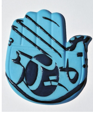
Görsel 9. Hz. Fatma Ana'nın Eli

Zehra Çobanlı Hz. Fatma ananın elini yorumladığı mavi astarlı lacivert sırlı küfi yazı ile dekorlanmış eserinde bereket ve bollukla birlikte kötü gözü nazarı kem gözlerden arınmaya gönderme yaparak sembolize etmiştir (Görsel 9). Ayrıca sanatçının işinde kullandığı mavi astar zeminde "Hz. Fatma Ana'nın Eli"nin ortasında yer alan göz sembolüyle birlikte nazarı yani bakışı algılatmaktadır.