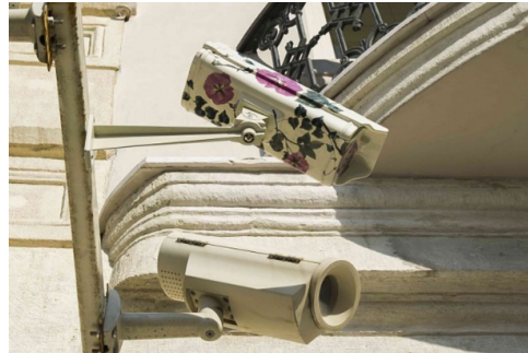
Görsel 18-19. Günebakan Serisinden 33x34x38cm, 2011 ( https://www.burcakbingol.com/follower )