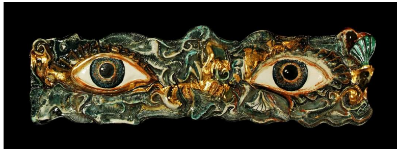
Görsel 20. Nazar, 200x80 cm, Alçı kalıp ve elle şekillendirme 1280°C (Kaynak:Orçun İlter, sanatçının izniyle)

Orçun İlter "Nazar" isimli eserinde derin ve anlamlı bir bakışın hikâyesi olduğunu belirtmiştir (Görsel 20). Bu panoyu yaparken nazarı araştıran sanatçı nazar yazdığına karşısına çıkan göz kelimesinden hareketle panosunu şekillendirmiştir. Sonra nazar boncuğundaki renkleri harmanlayarak yeşil ve mavi geçişli renkleri kullanarak etrafındaki dokuları, göz damarlarını ve irisin boyut kazanmış halini yorumlamıştır. Gözün beyazlığından irisin içinden çıkan göz bebekleri derinlikle bakmaktadır. Kem gözlerdeki kötü enerjiyi dağıtmak için deniz kabuklarından ve organik göz dokularıyla tamamlanmış sonsuzluğa bakan yatan bir yüz silueti oluşturulmuştur. Evrendeki sonsuz dengede ortaya çıkan altın orana uygun gezegenlerin dizilişi gibi gözün de çevresinde kirpikler oluşturmuştur. Sanatçı eserine "aslında bu sonsuz enerjinin yani evrenin gözüdür. Bir nevi bizim nazar diye tabir ettiğimiz. İyi düşün iyi olsun " (Orçun İlter, Kişisel İletişim: 11. 08. 2019) diyerek; kötü enerjili gözlerin oluşturduğu düşünülen tehlikelerden uzakta tutmak için tasarlamıştır.