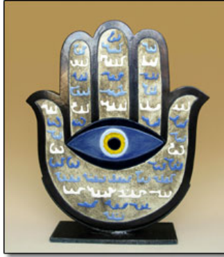
Görsel 13. Fatma Ana'nın Eli

Hız. Muhammed'in kızı Fatma kocası Hız. Ali'yi genç ve güzel bir odalıkla görünce o sırada pişirmekte olduğu helvaya şaşkınlıkla elini daldırır ve karıştırmaya başlar. Kocasını durumu fark edince Fatma'nın elini tencereden çıkartır. Fatma'nın eli yüzyıllardır sahiplerine şans getirdiğine ve onlara sabır ve sadakat erdemleri verdiği inanan bir tılsım haline gelir. Bu nesne genellikle Fatma'nın Eli olarak bilinilirse de Araplar arasında Hamse Eli olarak anılır. Hamse beş demektir ve bir elin parmak sayısını gösterir. Hindu'lar Humsa Eli, Museviler ise Hameş Eli veya Miryam'ın Eli adını vermişlerdir. Bazı kültürlerde yukarıya dönük, bazı kültürlerde aşağıya dönük el şeklinde bulunmaktadır."