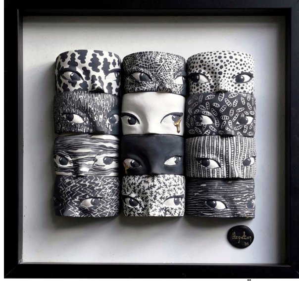
Görsel 21. Ben'in bi'kaç hali, 29x29x6 cm. 1040°C 2018. (Kaynak: Özge Tan, sanatçının izniyle)

Dil gizler, gözler söyler gerçeği. Gerçeği arıyorsan dili tamamen dışlayıp gözlerin ardına bak. Benliğin içindeki gerçeğe inince, bakışlarını başkalarından kaçırma da birbirinden kaçırmayan ne çok ben varmış der insan, Ben'in içinde. Siyahla beyaz, ne siyah ne beyaz, biri neşeli biri somurtkan, birbiriyle çatışan, birbiriyle anlaşılan, birbirini umursayan ya da hiç umursamayan sayısız ben var içimde. Birinin zaferi, bir diğeri için yenilgisi, her iki türlü de, benim zaferim ve benim yenilğim. Her iki türlü de bir damla yaş gözlerimde, zafer de, yenilgi de (Görsel 21).