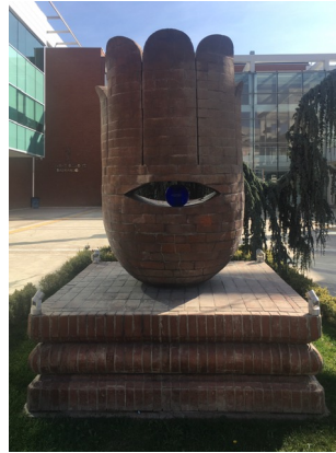
Görsel 7-8. Fatima’nın Eli, Eskişehir, 2 m. 2010 (Kaynak:Tüzüm Kızılcan, sanatçının izniyle)

Eskişehir’e bir ziyaretimde Eskişehir Büyükşehir Belediyesi’nin sanatla olan ilişkisini imrenerek izlemiştım. Yılmaz Hoca’nın ilk yıllarıydı... İlerleyen zamanlarda Eskişehir Tepebaşı Belediyesi’nin her yıl düzenlediği Pişmiş Toprak Sempozyumu’na davet edildim ve sempozyum için yapacağım işin yerini seçerken, Tepebaşı belediye binasının önünü bana önerdiler. Ben de seyerek kabul ettim. Çünkü bu etkinliğin devam etmesini canı gönülden istiyordum. Yani burada bu etkinliğı düzenleyen kurumu ve etkinliğı kem gözlerden korumak için yapacağım eserimi yerleştirmek için mükemmel bir yerdı. Geleneğimizde nazar kavramı, nazardan korunma ritüelleri ve sembolleriyle kem gözleri uzaklaştırmak isterken aynı zamanda da bu etkinliğe davet edildiğim için beni davet edenlere şükranlarımı sunmak istedim. Şükran deyince işin içine el girdi. El çağrışımı nazarla birleşerek, Fatima’nın Eli fikri oluştu. Geleneğimizde nazar sembolleştirilen Fatima Ana’nın Eli düşey hatların yoğun olduğu bir form olduğundan işe bir boyut kazandırmak istedim. Halk arasında nazarı değenler için “kaşık düşmanı tabiri kullanılır. Bu tabir bana çanağı çağrıştırdı. Çanak formu ile Fatma Ana’nın el formunu birleştirdim. Göz boncuğı koydum. Bitirdim. Klasik nazar algısı için boncuğı camdan yaptım. Çünkü nazar değdiğinde cam kırılır ve nazar uçup gider.