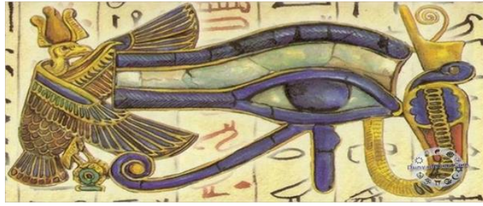
Görsel 1. Eski Mısır'da Güneş Tanrısı'nın sembolü olan göz https://www.dunyadinleri.com/tr-TR/mitoloji/mitoloji/oku_antik-misirda-horusun-gozu-mitolojisi-ve-mitolojide-goz

Eski Mısırlılar, göz sembolünü nazarlık olarak sıkça kullanmışlarının yanında ölümler ve ruhlar dünyasını görme gücünü de göz sembolü ile ifade etmişlerdir. Osiris ve Isis'in oğlu olan Horus'un güneşi temsil eden sağ gözü beyaz, Ayı temsil eden sol gözü siyahtır. Horus'un kötü kardeşi Seth kavgada kardeşinin sol gözünü çıkarmış ama Thoth onu iyileştirmiştir. Horus bu gözünü babasına vermesi nedeniyle Osiris yeraltını görebilme kabiliyetine ulaşmıştır. İşte bu nedenden dolayı mezarlara tabutlara ve hatta mumyalara kıymetli taşlardan yapılmış gözler yerleştirilmiştir (Özden, 2010).