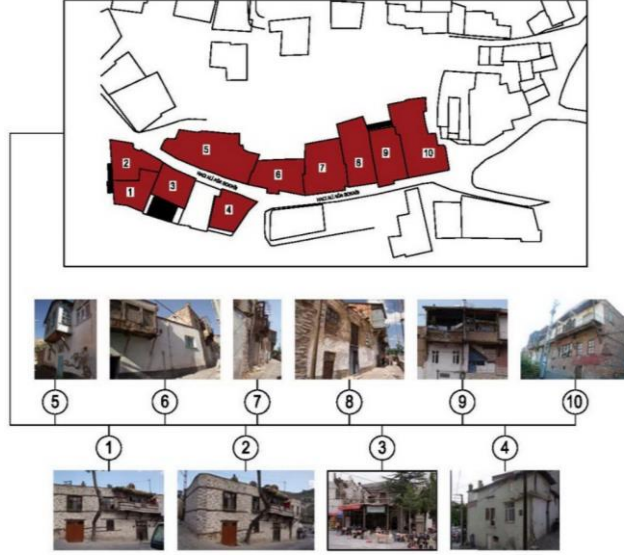
Şekil 3. Hacı Ali Ağa Sokağında belirlenmiş konutlar

üzerinde yer alan çoğunlukla konut ve ticaret işlevinin bir arada bulunduğu yapı tiplerini içeren, Hacı Ali Ağa Sokağında; bölgenin ticari hayatını, sosyo-kültürel yapısını ve mimari karakterini yansıtan ve özgün durumunu koruyan 10 adet sıralı konutta meydana gelen mekansal ve strüktürel değişim süreçleri; fiziksel ve fonksiyonel değişim tabloları üzerinden, 2016 yılına kadar geçen süre içerisinde irdelenmiştir (Şekil 3).