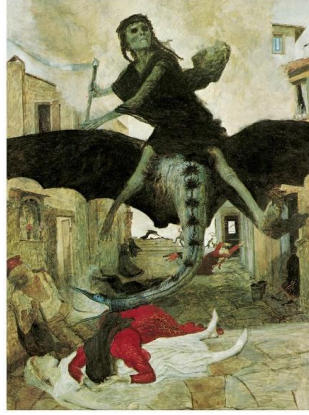
Resim 6. Arnold Böcklin, Salgın, 149.5 cm x 104.5 cm, 1898

bellekte "Kara Ölüm" olarak anılan salgın kaynaklı korkuların sembolü olarak değerlendirilebilir. Resimde, gerilimli bir atmosfer hakimdir. Yarasaya benzeyen uçan yaratığın üstünde yer alan ölüm meleđi, geçtiđi her yerde ölüm saçmaktadır. Resmin kompozisyonunda Ortaçađ mimarisine sahip bir mekan yer alır. Issız ve sessizlik içinde olan bu mekan, ölüm meleđinin çürümüş yeşil bedeniyle uyum içindedir. Resmin ön planında yer alan ölü bedeninin üstüne yüz üstü kapaklanmış kadın dikkat çekmektedir. Kadının elbisesindeki altın işlemler, kadının zengin bir yaşam sürdürdüğüne ancak salgınla gelen ölümün sınıf farkı gözetmediğine işaret etmektedir. Kısacası, korku, ölüme karşı bir direnç gösterememiştir (Dominiczak, 2012:720). İnsanın acizliđi yine sanat aracılıđıyla görünür olmuştur.