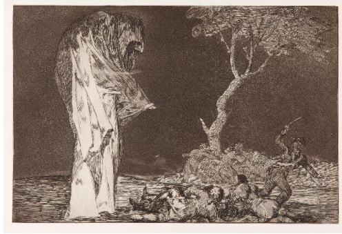
Resim 4. Francisco Goya, Disparate de Miedo (eng. Folly of Fear), 251 mm x 366 mm, 1815-19

Goya, akli ve bilimi merkezine alan Aydınlanmanın etkisiyle geleneksel değerlerin sorgulandığı, açlık ve kıtlığın, sayısız savaş suçlarının yaşandığı bir dönemin ressamıdır. Şahit olduklarının etkileri sanatının her evresinde hissedilir. Özellikle gravürleri yaşadığı döneme getirilen bir eleştiri olması açısından ayrı bir öneme sahiptir. Siyasi ve toplumsal açıdan keskin eleştiriler taşıyan bu gravürlerinde canavarların varlığı dikkat çekicidir (Resim 4). Bu resimler ilk bakışta hayali bir kabus gibi algılansa da dikkatle izlendiğinde, dönemin acımasızlığına karşı korkutucu bir dille cevap verdiği sezilmektedir. Korku ve ürkütücü olanı bir arada görebileceğimiz bu resimler, tarihe tanıklık eden bir belge olmaktan çok daha fazla şey söylerler. Çünkü bu resimler, sadece dönemini temsil etmez, korkunun biçimi değişse de kaynağının hiç değişmediğini yani insanın acizliğini ve ölüm karşısında çaresizliğini her defasında hatırlatırlar.,