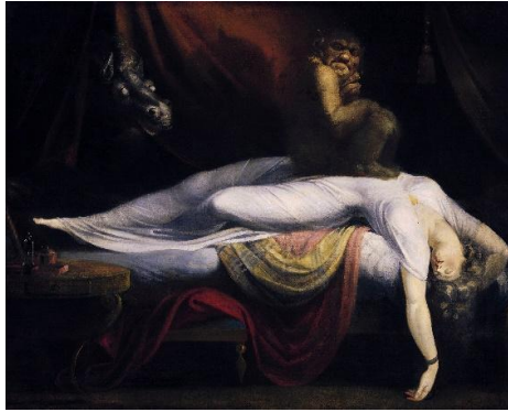
Resim 5. Johann Heinrich Füssli, Kabus , 1.02 m x 1.27 m, 1781

Resimdeki korkutucu atmosfer barok tarzı ışık ve gölge kullanımıyla elde edilmiştir. Arka planda yer alan gösterişli perdeler, resmin sol köşesinde yer alan sehpa ve üzerinde bulunan şişe, kitap ve objeler, dönemin algısıyla birlikte düşünüldüğünde bir takım günahlara gönderme olarak yorumlanabilir. Romantizmde öne çıkan bu dini mistik bakış açısı ve sanatçının dini eğitimi hesaba katıldığında, resimdeki korku temasını dini inançlara bağlı günah korkusuyla açıklamayı olanaklı kılmaktadır. Kısacası, günah korkusu bu resimde, İsa'nın acısına ihanet olarak kabul edilen bedenin hazzı üzerinden kabus ile sembolize edilmiştir.