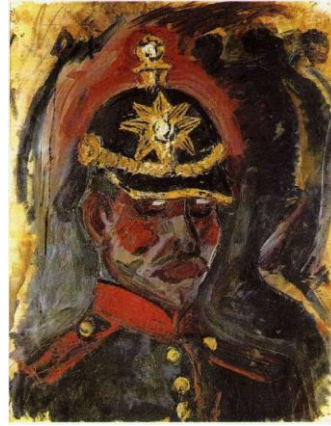
Resim 9. Otto Dix, Topçu Kaskı ile Oto-portre (eng. Self portrait with a Gunner's Helmet), 68 x 53.5cm, 1914

Dix, ölümden bile korkunç, savaşın tek manifestosu olan canavarlığı ve katledilişi fiilen deneyimlemiş biri olarak ömrü boyunca savaşı sanatına konu edinmiştir. "The War" isimli çalışması ise, (Resim 10) eserlerinin arasında birçok açıdan öne çıkmaktadır. Dört panelden oluşan bu resim, biçimsel açıdan sanat tarihine birçok göndermeler içerir. İkona resimlerinden, Bosch'un "Zevkler Bahçesi"ne, Matthias Grünewald'ın altar