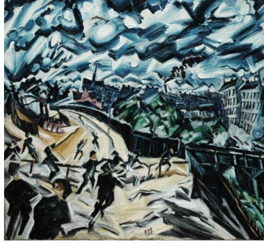
Resim 11. Ludwig Meidner, Kıyamet Manzaraları Serisi-1 (eng. The Series of the Apocalyptic Landscape, 95.25 x 80.33 cm, 1913

Meidner'in 20. yüzyılın ilk dönemlerinde oluşturduğu "Kıyamet Manzaraları" (Apocalyptic Landscape) seri olarak üretilmiştir ve distopik bir dünya görüntüsü içerir. Ancak bu distopya, gelecek zamanı işaret etse de Kafka'nın metaforlarında olduğu gibi modern dönemin insanlar üzerinde bıraktığı kaotik duygunun bir yansımasıdır. Bu dışavurumcu çalışmalarda dikkat çeken bir diğer özellik ise El Greko'nun resimlerinde de görülen siyahın etkin kullanımınıdır. Empresyonistlerin paletlerinden çıkartılan siyahın, Meider gibi çağdaşları olan Alman dışavurumcular tarafından bu denli kullanımı, kültürel faktörlerin oluşturduğu diyalektik bakış açısıyla ilişkilidir (Cook, 2015: 35). Jestüel bir tavırla biçimlenen resimlerde siyah, dışavurumda, duygunun yansımasında ve olayı dramatikleştirmede aracı görevi üstlenmiştir.