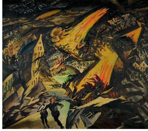
Resim 12. Ludwig Meidner, Kıyamet Manzaraları Serisi-2 (eng. The Series of the Apocalyptic Landscape, 76.2 x 66.04 cm), 1912

Eberhard Roters'e göre Kıyamet Manzaraları serisinin modern sanata kazandırdığı sadece korku duygusunun derinliği değildir. Sanatçının teknik olarak boya ile kurduğu ilişki, aynı zamanda dışavurumlarının alfabetini oluşturmaktadır. Sanatçının bu tekniksel olgunluğu, içeriğın algılanmasında büyük önem taşımaktadır. (Roters, 1988:35-38). Rüyaları anımsatan bu resimler aynı zamanda, gelecek üzerine kehanetlerde bulunan Orwell'in 1984 kitabı gibi bugünün korkularını gelecek zamana aktarmaktadır.