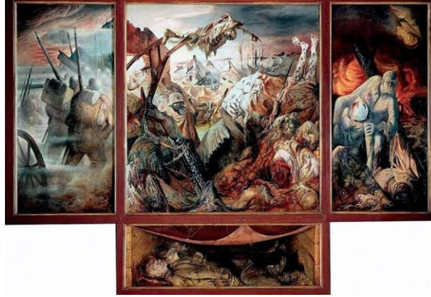
Resim 10. Otto Dix, Savaş (eng. The War)-Dix triptych, orta panel: 204 cm x 204cm, sağ ve sol paneller: 204cm x 102cm, alt panel: 204cm x 60cm, 1929-1932

Otto Dix'in bu savaş öncesi ve sonrası deđişim süreci Kafka'nın Dönüşüm kitabında yer alan Samsa ile bir benzerlik kurulabilir. Kitabın ana konusu deđişimdir. Roman, muhasebeci olarak hayatını geçindiren Gregor Samsa'nın bir şafak vakti yatađının içinde büyük bir böceđe dönüşmesi ile başlamaktadır. Bu deđişimden sonra Samsa, bir anda bu deđişimin getirdiđi 'anormallik' ve 'marjinal'likle kendisiyle ve ailesine karşı müthiş bir çatışmaya girer. Bu mücadeleler onun ruhsal bir aydınlanma yaşamasına sebep olur. Sonucunda bu dönüşümle Samsa, sözde mutluluklarla hayatını devam ettiren geçmişindeki kimliğinden uzaklaşarak, toplumun, ailesinin ve çevresinin dayatmış olduđu beklentilerinden uzak bir biçime başlangıç yapar. Kafka'nın kısa ömrü, modernizmin ütopyalarına kapılan Otto Dix gibi kendisiyle aynı dönemi yaşamış birçok insanın içine düşmüş olduđu çıkmazları gözlemlemesine yetmiştir. Romanlarında savaşın etkilerinden çok, dönemin gerilimli atmosferinden yola çıkan yazar, metaforlarıyla bireylerin içine düştükleri çaresizlikleri ve korkularını dile getirmesi açısından önem taşımaktadır. Çünkü 20. Yüzyılın korkuları geçen yüzyılın korkularından birçok nedenle farklıdır.