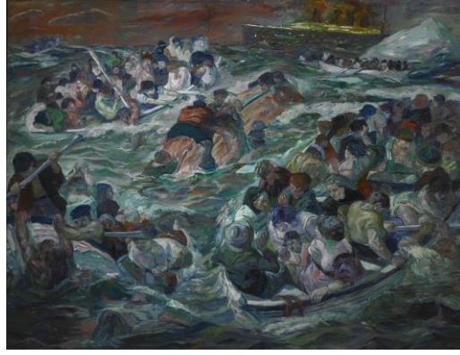
Resim 7. Max Beckmann, Titanik'in Batışı (eng. Sinking of the Titanic), 264.8 x 330.2 cm, 1912

20. yüzyılın teknoloji ve sanayisinin sembolü olmayı vaat eden Titanik Gemisi, hem vaat ettikleri hem de nihai sonu ile modern dönemim egosunun yerini alacak korkuya örnek olması açısından önem taşımaktadır. 20. yüzyıl modern dönemin ilk evrelerinde Sanayileşmenin en büyük başarısı olarak gösterilen Titanik Gemisi buz kütesine çarptıktan kısa süre sonra batmıştır. Doğanın karşısına kendi gücünü koyan insanoğlunun yenilgisini ikonikleştiren Titanik Gemisi, Dünya savaşları arifesinde modernizmin yaratacağı hayal kırıklıklarına işaret vermesi açısından yukarıda bahsedilen konulara örnek olacak nitelikte bir felakettir.