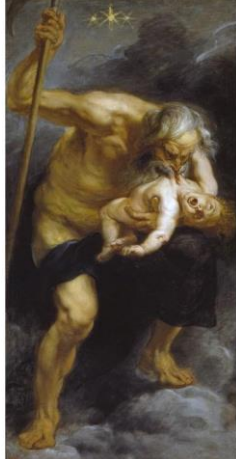
Resim 2. Peter Paul Rubens, Çocuklarını Yiyen Satürn, 182.5 cm x 87 cm, 1636-38

düşsel dünyanın yanı sıra yaşadığı çağın etkilerini görmek mümkündür. "Sanatıyla yaşama ve daha sonra Fransız-İspanyol savaşına tam anlamıyla katılan Goya, hem resim hem baskı alanında, korkunç bir tarihin ressamı, büyük toplumsal çalkantıların acımasız çözümleyicisi, hangi çağda olursa olsun savaşların iğrençliklerini doğuran bütün karabasanların yansıtıcısı olmayı başardı" (Claudon, 2006:85).