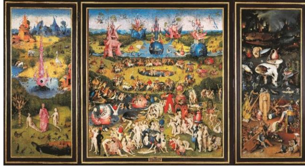
Resim 1. Hieronymus Bosch, Dünyevi Zevkler Bahçesi, 2.2 m x 3.89 m, 1503-4

Peter Burke (2003), bu gibi resimlerin farklı kültürlerdeki bireylerin ve grupların korkuları konusunda tarihçilere önemli ipuçları sunması açısından da rehberlik edeceğini ifade etmektedir. Bu resim, kültürel anlamda ortaçağa hakim görüşünün sınırları olarak da değerlendirilebilir. Burke, cennetteki azizlerin olumlu imgelerinin karşılıkları olan cehennem ve şeytan tasvirlerinin bu dönemde artış göstermesini de yaşananlarla ilişkilendirmektedir (Burke, 2003:58).