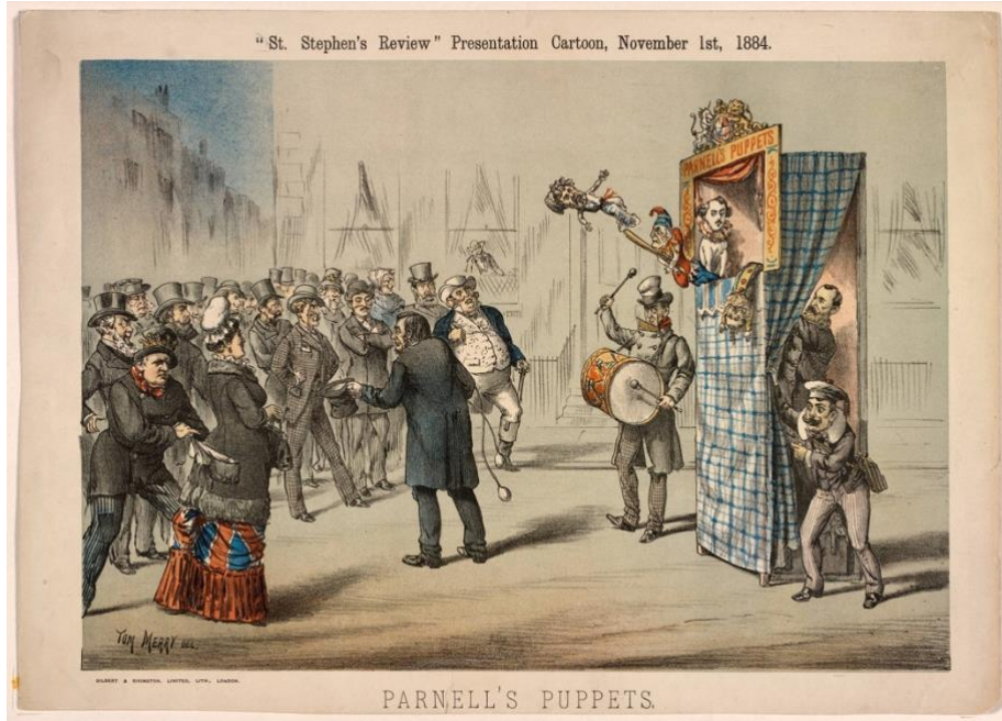
Görsel 4. Parnell'in kuklaları, St. Stephen'in inceleme sunumu için basılan karikatür – 1 Kasım 1884, Londra. Müze no. S.1291-2010.

Günümüz kukla karakterleriyle oldukça farklı özelliklere sahip olan Punch; yalnızca politik rolü ile değil, dış görünüşüyle de kesinlikle sevimli bir karakter değildir. Dönemin ekonomik ve politik anlamda içerisinde bulunduğu çalkantılı süreç ile birlikte Punch, hakim otorite açısından oldukça tehlikeli ve kusurludur.