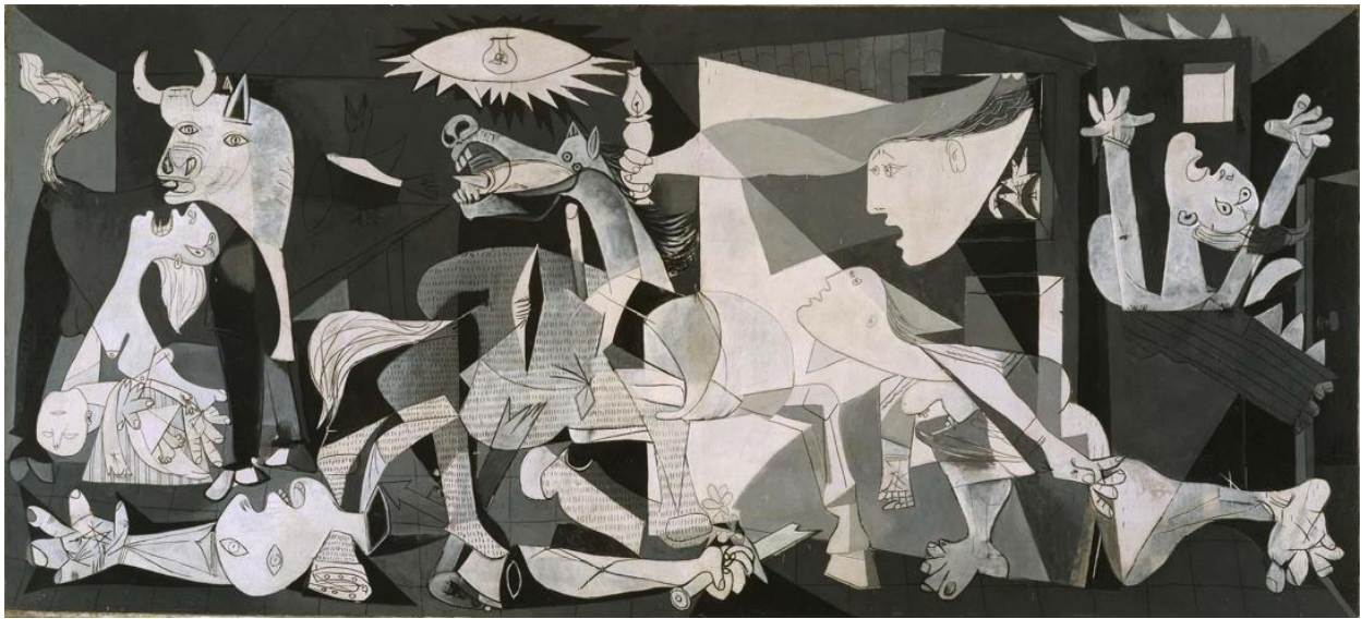
Görsel 6. Pablo Picasso / Guernica (776x349cm) – 1937

Propaganda sözcüğünün tarafsızlığı I. Dünya Savaşı zamanında sona ermiştir. Çok sayıda askerinin hayatını kaybettiği bu savaşta; ölenlerin yerine gelecek yeni askerleri toplamak oldukça zor olmuş, kullanılan geleneksel yöntemler yetersiz kalmıştır. Savaş içerisinde yer alan devletler sinema, gazete, afiş gibi daha gelişkin kitle iletişim araçları ile halkı neredeyse her gün devlet propagandasına maruz bırakmıştır. Daha sonraki yıllarda, Vietnam Savaşı ve Vatandaşlık Hakları Hareketi gibi dönüm noktaları ile beraber ABD'de sanatçı ve eleştirmenler radikalleşmiş ve bu kuşak özelinde büyük bir etki yaratmıştır. Bununla beraber sanatın politik kaygılardan uzak olması gerektiği fikrine karşı bu kesimler savaş açmıştır. Bu sanat eleştirmenlerinden biri olan Lucy Lippard sanatçıları cesaretlendirmeye çalışmıştır: