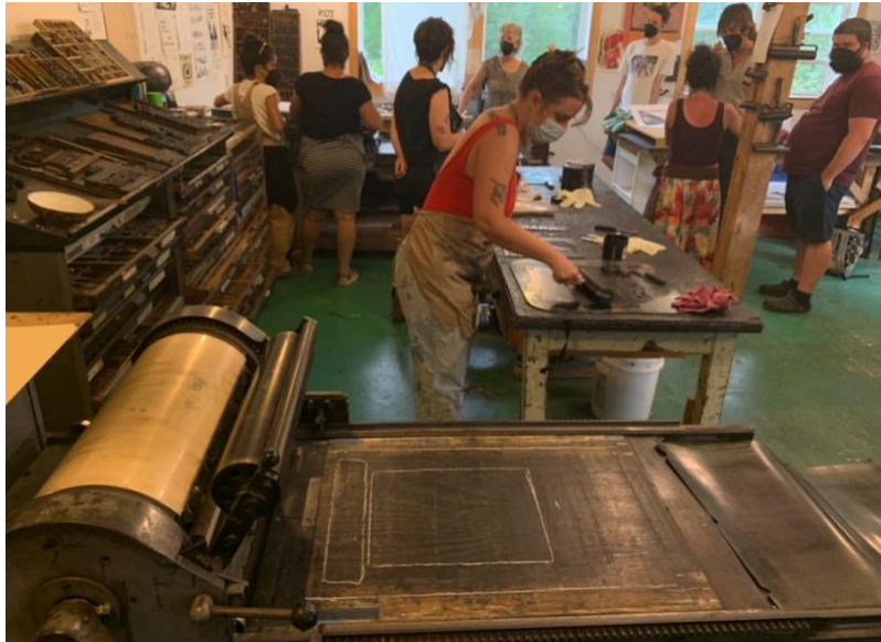
Görsel 10. Ekmek ve Kukla Tiyatrosu Matbaası - Glover/Vermont 2022

Schumann'ın bu özgürlük anlayışı, toplumsal ve siyasal gelişmelerin de etkisiyle topluluğun politik anlamdaki gelişimine ışık tutmuştur. Barkod sistemini reddeden bu anlayış ile yalnızca Amerika'nın çöplüğünden çeşitli tekniklerde kuklalar üretmekle kalmamış; aynı zamanda tüm çiftlik çalışanları ve çırakları ile birlikte kolektif ve ekolojik bir yaşantı inşa etmişlerdir. Sabahın erken saatlerinde herkesin bir araya toplandığı kahvaltı buluşmalarında, çiftliğin günlük işlerinden, performans ve provaların planlanmasına kadar günün her saati kolektif olarak ilerletilmektedir. Bir yanda yemekler hazırlanırken, diğer yanda gönüllüler müze temizliği ile ilgilenmekte; bir diğerleri serada yetişen sebzeleri toplamakta, başka bir grup ise "baskı dükkanı" adını verdikleri atölyede Ekmek ve Kukla Tiyatrosu'na özel poster ve kumaş baskıları hazırlamakla sorumludur.