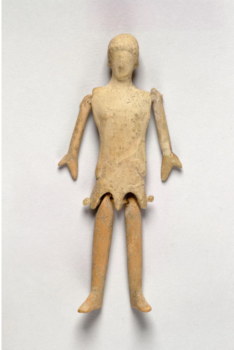
Görsel 3. M.Ö. 5. Yüzyıla ait Yunan pişmiş toprak bebek ( https://olh.openlibhums.org/article/id/6568/ )

Kuklanın gelişimi maskelerden de bağımsız değildir. Ritüellerde dansçıların başlarına takarak kullandıkları ve duygularını ifade ettikleri bu maskelere zamanla beden formları eşlik etmiş ve kuklaya evrilmiştir. Dini ritüeller ve büyü ile ilişkilendirilen ve geleneği çok eskiye dayanan kuklanın tiyatral bir yana sahip olduğu da söylenebilir. Antik Yunan'da kukla yaklaşık MÖ 6. Yüzyılda dini törenlerden ayrılarak estetik kaygılar eşliğinde sanatsal bir boyut kazanmıştır. Dönemde, Dionysos Şenliklerinde kullanıldığı düşünülen çeşitli kukla temsillerine rastlanmıştır. Bu şenliklerde Antik Yunan'ın ilk kuklacısı olarak bilinen Potheionos'un kukla oyunlarının en ilkel hallerini sergilediği bilinmektedir. Her coğrafyada, siyasal, ekonomik ve kültürel çeşitliliğin etkisiyle kukla tiyatrosu ve karakterleri birbiriyle harmanlanmış ve değişiklikler göstermiştir. Genel olarak tiyatro sanatının 5. yüzyıl civarında geçirmiş olduğu karanlık dönemden kuklacılar etkilenmiş olsa da gezici kukla tiyatroları ile çeşitli yöntemler geliştirmekten geri durmamıştır.