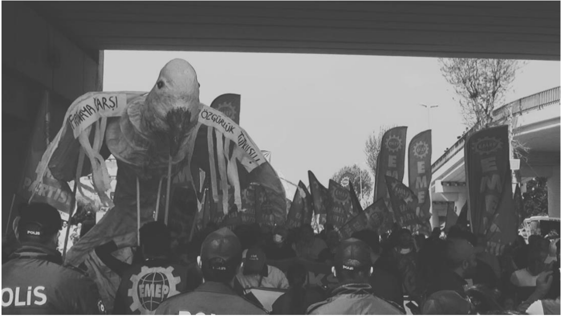
Görsel 7. Fırtına Kuşu - 1 Mayıs 2022

Sanat eserinin kamusal alandaki varlığı, toplum tarafından daha kolay ulaşılabilir olmasını sağlar. Aynı zamanda yine bu durumun bir getirisi olarak, kamusal alandaki varlığı sebebiyle tanımını yani sanat eseri oluşunu tamamladığını söylemek mümkündür. Eser dahil olduğu mekân ve atmosfer ile tamamlanır. Aynı zamanda sanatçının bir ifade ediş biçimi olarak ürettiği iş ile bu mekansal ve politik buluşma, beraberinde protestoya farklı bir doku ve atmosfer yaratmakta; içeriğin ve söylemlerin anlaşılması ve kitleler ile buluşması konusunda kolaylaştırıcılık işlevini üstlenmektedir.