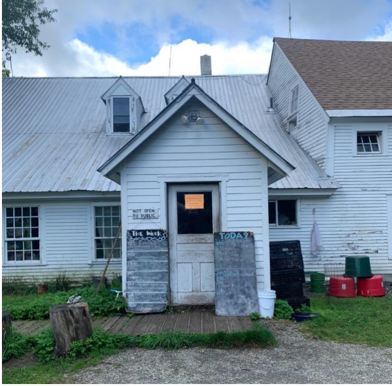
Görsel 9. Ekmek ve Kukla Tiyatrosu Kuklacı Evi - Glover/Vermont 2022 (Haftalık ve günlük planlama panoları)