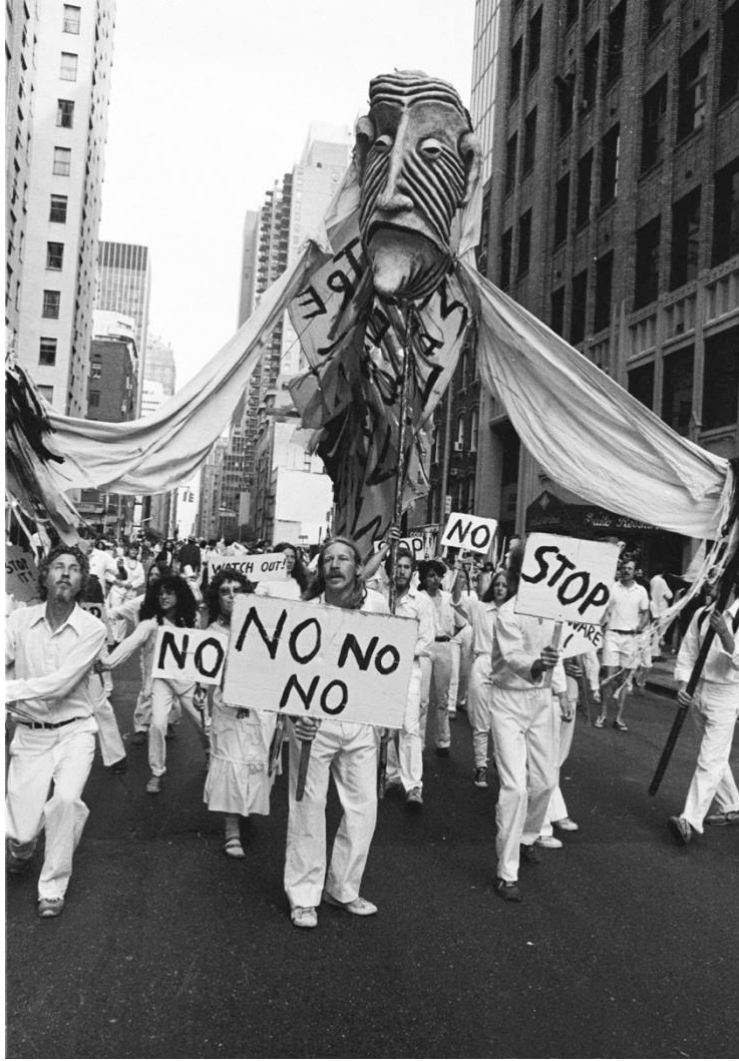
Görsel 8. Bread and Puppet Theater performs during a protest in New York in June 1982 (Ekmek ve Kukla Tiyatrosu Haziran 1982'de New York'ta bir protesto sırasında sahne aldı) ( https://www.npr.org/2013/08/24/214818319/bread-and-puppet-celebrates-50-years-of-paper-mache-and-protest )