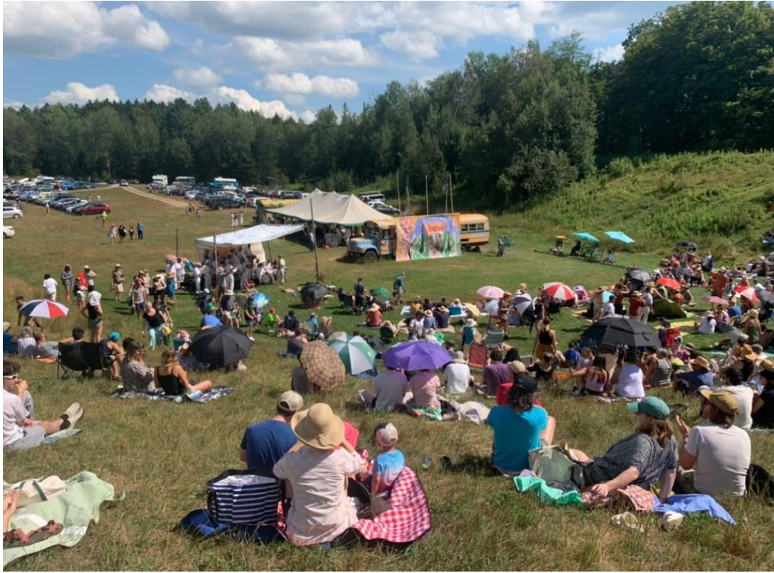
Görsel 12. Ekmek ve Kukla Tiyatrosu - Kıyamete Meydan Okuma Sirki (The Apocalypse Defiance Circus) Glover/Vermont 2022