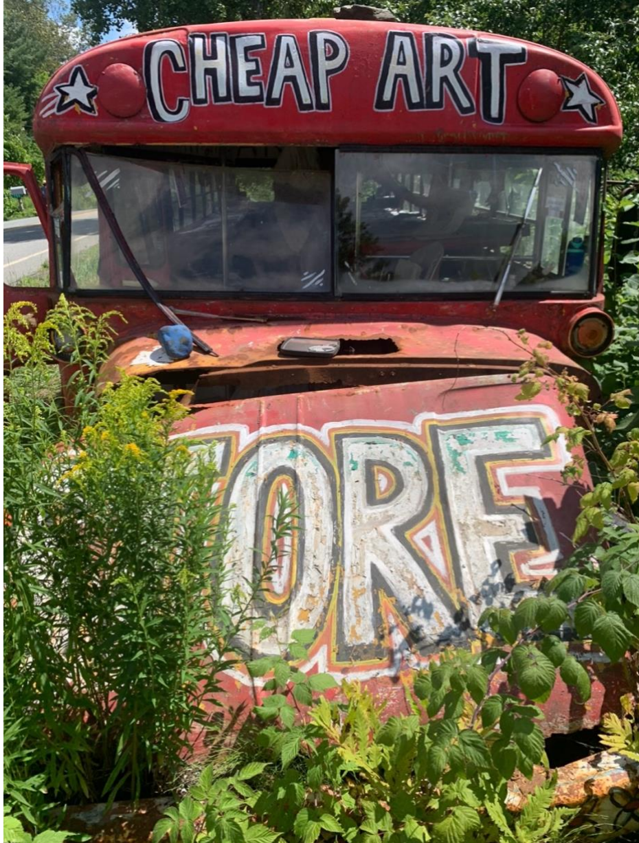
Görsel 11. Ekmek ve Kukla Tiyatrosu Ucuz Sanat Dükkanı - Glover/Vermont 2022

"Ucuz Sanat sergileri ve satışları, tiyatro çalışmalarına ikincil bir yan çizgi olarak görülmez, ancak 60'ların başında New York'ta Ekmek ve Kukla Tiyatrosunu başlatan aynı inançtan kaynaklanır: sanat ekmektir, sanat ekmek gibi erişilebilir olmalıdır ve bu yüzden elitist sanat tüketicisi uyandırılmalı ve sanatın aşırı tüketicilerin, duygusal olarak rahatsız olanların ve iç mimarların kulüplerinin apolitik üyelerinin bir ayrıcalığı gibi gösteren yanlış eğitim konseptine meydan okunmalıdır. Bu meydan okuma onları yeni bir amaca ikna etmek için değil, yeni sanat meraklılarını doğru malzemelerle başlamasını sağlamak için olmalıdır." (Schumann, 1987: 3)