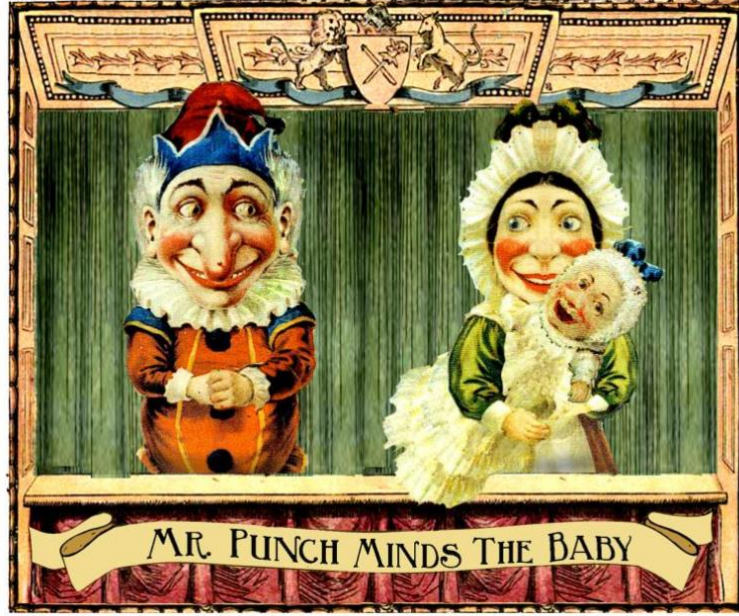
Görsel 5. Punch ve Judy karakterleri

( https://www.patheos.com/blogs/monkeymind/2016/05/mr-punch-wields-his-stick-and-once-again-trickster-walks-the-stage.html )