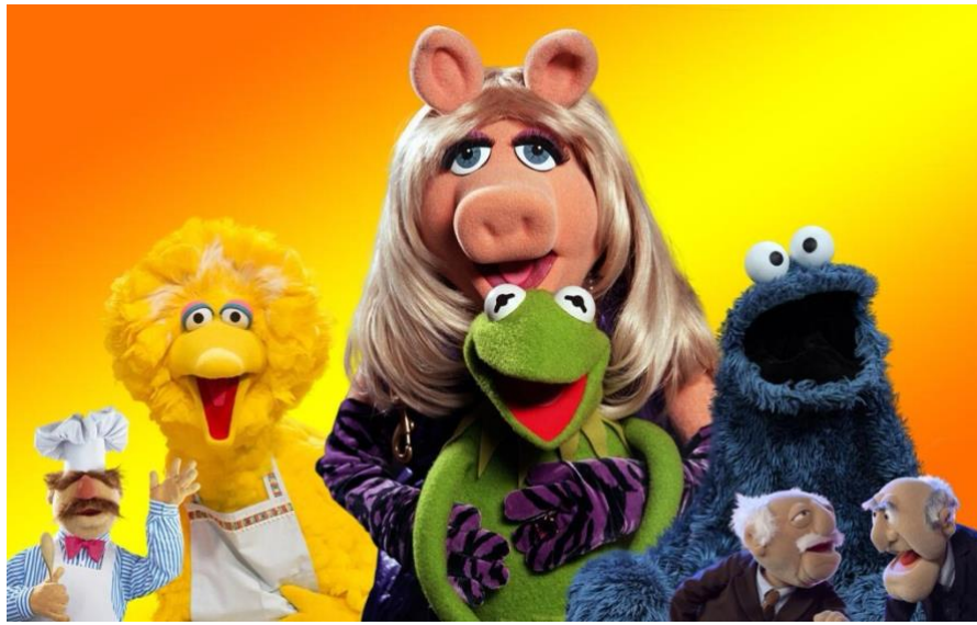
Görsel 1. Muppet Şov Karakterleri ( https://www.latimes.com/entertainment-arts/tv/story/2021-02-19/the-muppet-show-disney-plus-jim-henson-sesame-street )